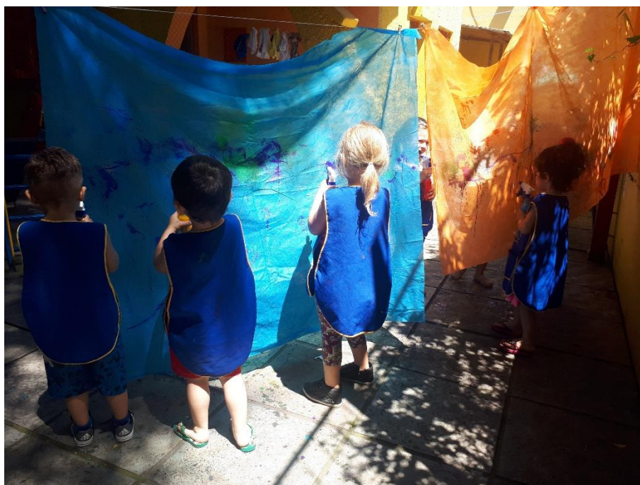
Figura 14: Fotografia 14, borrifando o tnt no varal.

A maioria das crianças rapidamente entendeu o funcionamento e começaram a borrifar o tecido, mas como tínhamos um pouco de vento neste dia, em seguida começaram a borrifar uns aos outros e fizeram disto uma brincadeira muito divertida. Tive um pouco de dificuldade de que eles me escutassem para que assim eu pudesse explicar os cuidados que deveriam ter com olhos, bocas e nariz. Foram várias borrifadas nestas áreas e nos muros, no chão e em mim. Neste dia sai literalmente toda estampada (figura 14 e 15).