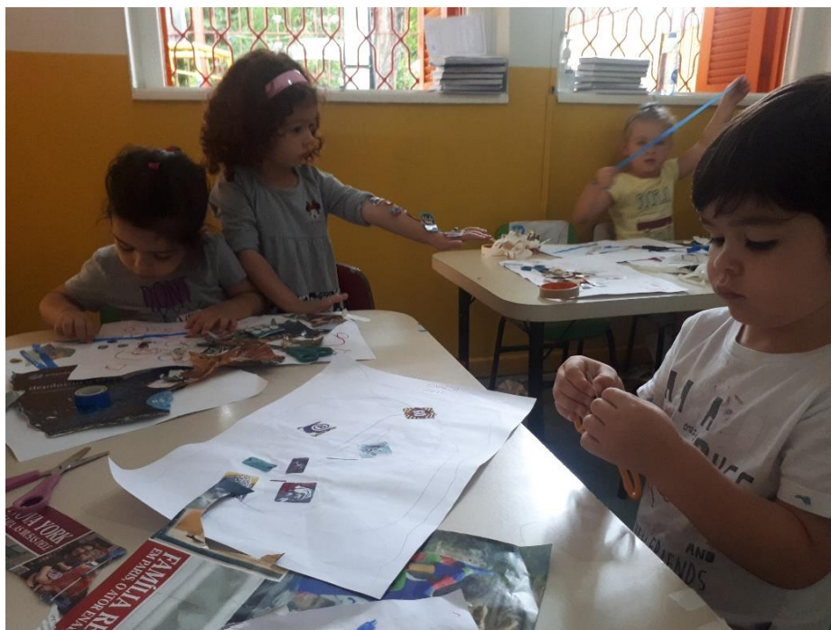
Figura 17: Fotografia 17, interferência com fitas e adesivos no desenho do dia anterior.

Algumas ficaram frustradas por não conseguirem cortar a fita crepe, ou pela dificuldade de manterem a fita esticada para que colassem as revistas no papel. Algumas colaram pequenos pedaços de revista com as fitas e uma das meninas disse que estava fazendo uma “colcha de retalhos” como na história da vovó.