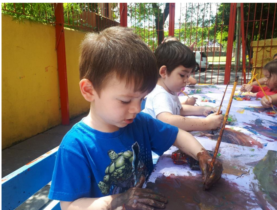
Figura 12: Fotografia 12: Pintura no tecido com as mãos e com o pincel

Pelo fato de estarmos no pátio da frente, aonde ficam alguns brinquedos da pracinha, foi mais fácil, que elas pudessem ir se desligando da proposta à medida em que iam perdendo o interesse. Tinha combinado com elas, que àquelas que saíssem e tivessem a primeira higienização de mãos, braços e rostos não poderiam retornar e que teriam que brincar só no pátio da frente por causa da sombra e para que eu pudesse observá-las.