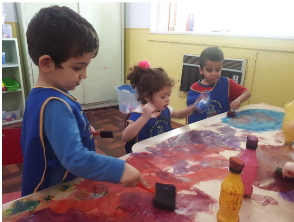
Figura 4: Fotografia 4, pintando com esponjas e rolinhos.