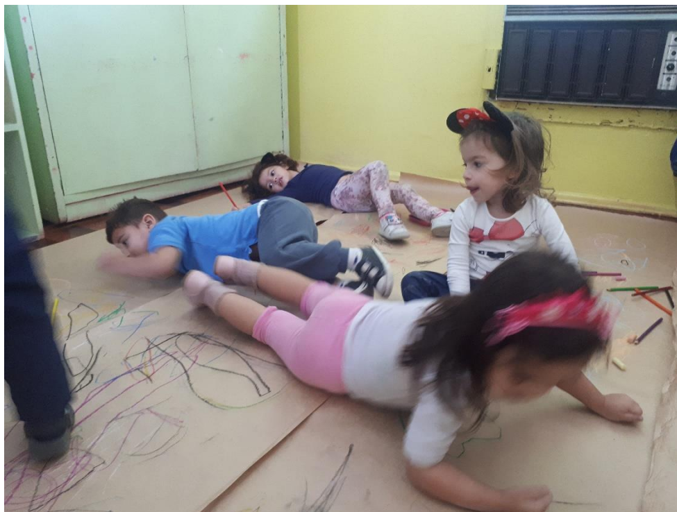
Figura 7: Fotografia 7, desenhando sobre o papel pardo.

Antes de levá-las para a sala, que é no andar de cima da escola, conversei com as crianças em uma sala que costumamos usar também no andar de baixo. Fizemos uma roda e contei para elas que tinha preparado uma surpresa na sala delas. Um deles na hora me perguntou se era uma “surpresa de atividade”. Brinquei com as crianças que a graça da surpresa era “se surpreender” e que elas já iam ver o que era. Pedi que elas subissem. Foram subindo as escadas e à medida em que iam entrando na sala, escutava as exclamações e risadas. Algumas já foram escolhendo alguns dos materiais disponíveis e foram produzindo marcas, rabiscando no papel, outras me olhavam, esperando meu consentimento, outras perguntaram se podiam desenhar. Neste momento peguei cada um dos diferentes gizes e rabisquei no papel e disse a elas que elas podiam desenhar e riscar naquele papel do jeito que quisessem. Logo uma deitou sobre o papel e perguntou se podia e eu disse que sim, que podiam sentar, deitar, fechar os olhos, rolar, enfim, explorar o papel com o corpo e com os marcadores da forma que tivessem vontade (figura 7).