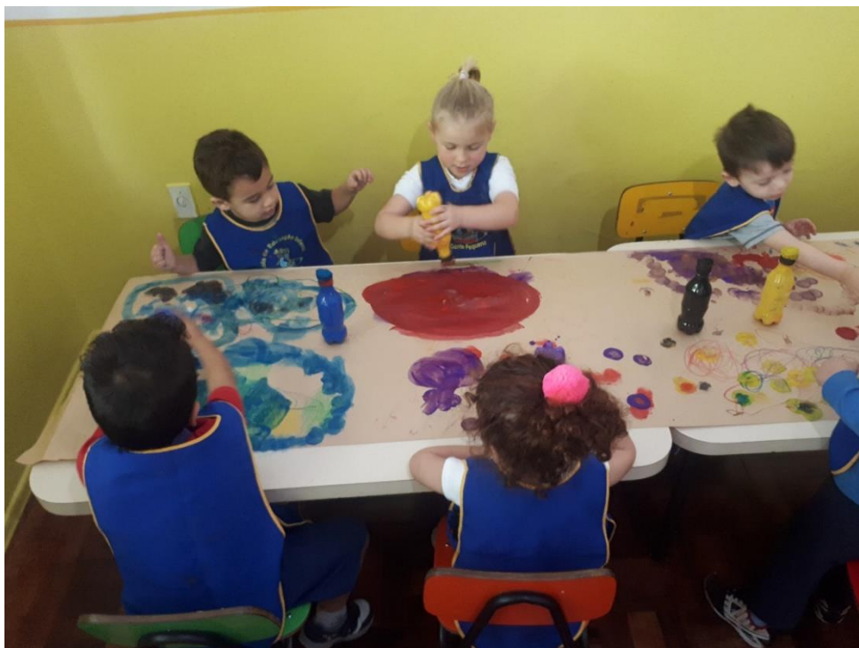
Figura 3: Fotografia 3, pintando com carimbos de garrafinha pet .

de garrafinha pela variedade de cores ofertadas foi muito interessante (eles tiveram acesso ao amarelo, vermelho, dois tons de rosa, roxo, marrom, preto, branco, dois tons de azul, dois tons de verde – figuras 5 e 6).