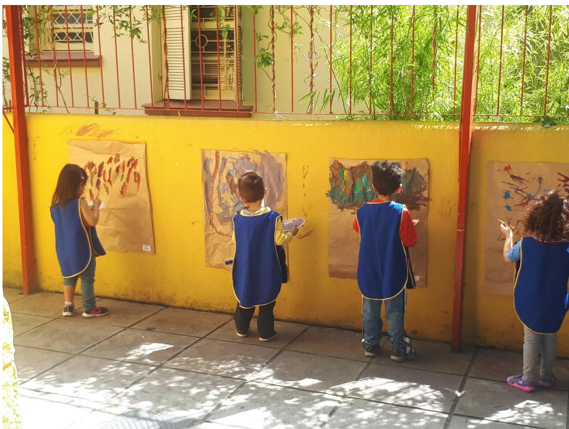
Figura 9: fotografia 9: Compondo minha tela com cores e pincéis variados

Neste momento conversamos sobre as diferentes cores produzidas a partir das diferentes misturas iniciais. Rapidamente se deram conta que a cor produzida dependia da mistura de cores que tinham sobre suas paletas e foram pedindo variadas cores produzindo diferentes cores que eram espalhadas pelas telas. Percebi que os traços mais distintos e texturas mais diferenciadas logo eram sobrepostas com novos traços, texturas e cores (figura 9).