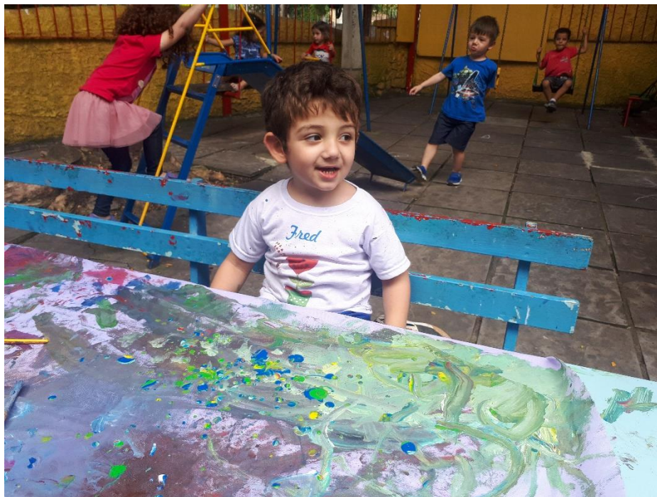
Figura 13: Fotografia 13: “Baleias mães e peixinhos filhinhos”.