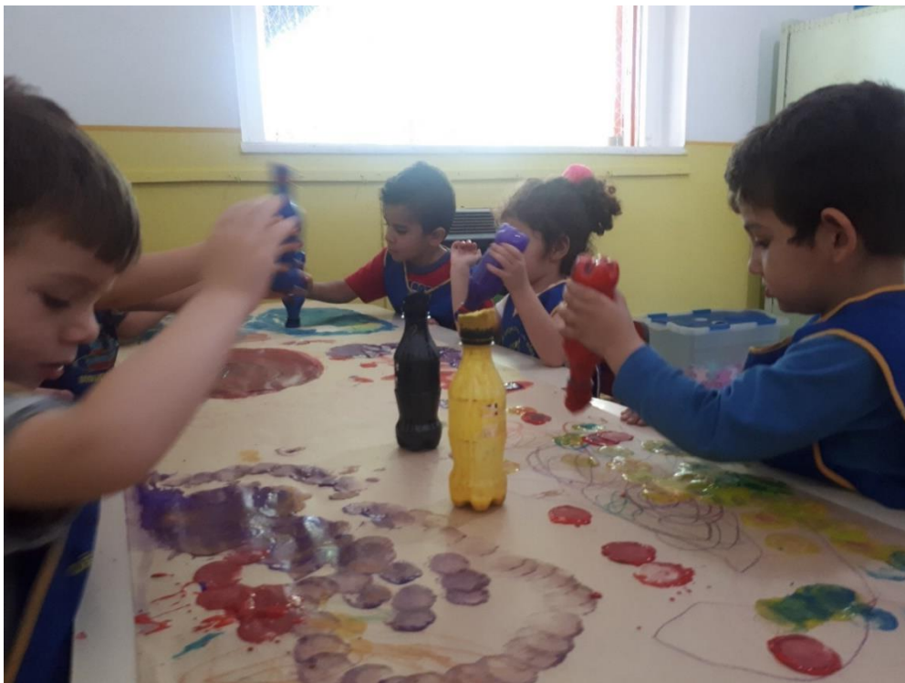
Figura 5: Fotografia 5, as marcas produzidas