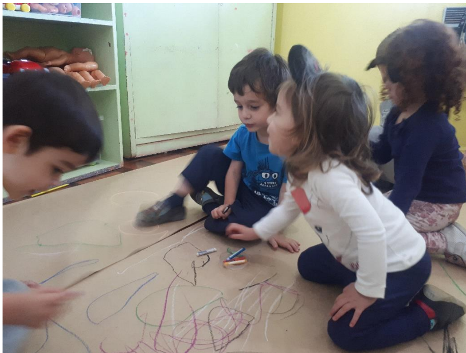
Figura 8: Fotografia 8, um mar de peixes e tubarões.

Algumas delas começaram a caminhar sobre o papel pardo e produzir sons com seus passos no papel e perceber que se corressem ou pulassem os sons ficavam mais altos, fomos migrando para um momento de exploração dos sons sobre o papel pardo e resolvi introduzir balões na brincadeira para explorarmos os movimentos. Fui enchendo balões e soltando pelo chão da sala e elas foram pegando e fui propondo jogarmos com os balões, colocarmos sobre a cabeça, nos encostarmos uns nos outros com os balões. A medida em que nos movimentávamos sobre o papel rabiscado as marcas produzidas pelo giz de quadro e pelo carvão vegetal foram ficando borradas e nossos pés cada vez mais marcados. Uma das crianças disse: