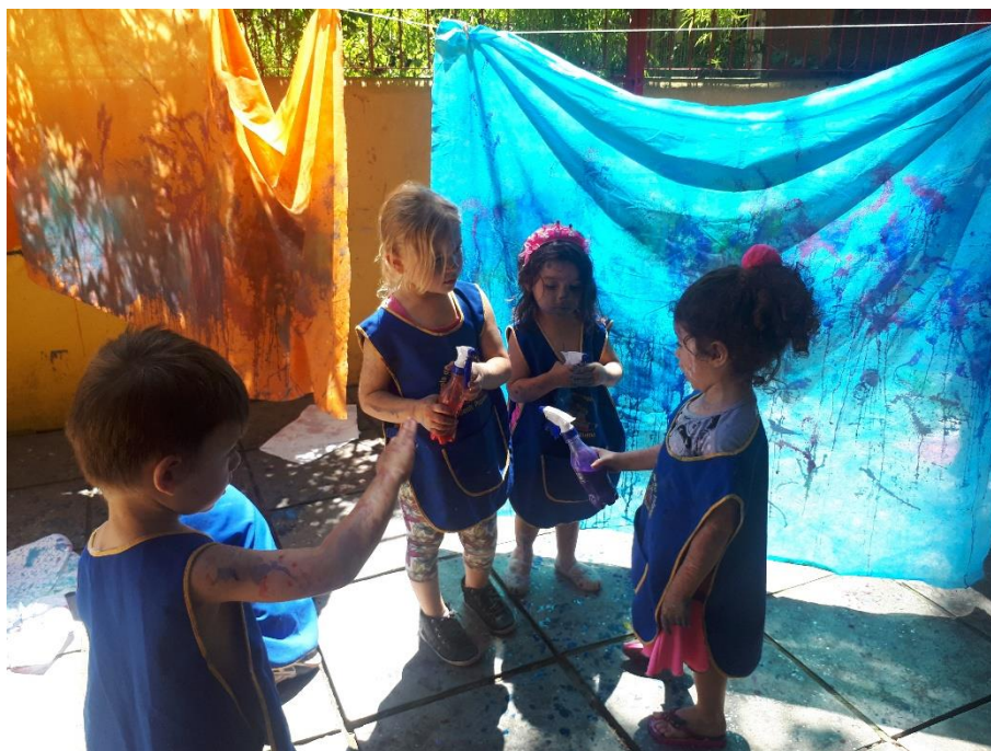
Figura 15: Fotografia 15, as conversas das crianças a respeito do funcionamento dos borrifadores.

Tivemos um contratempo que nos atrapalhou e acabou gerando um pouco de stress e precipitando o fim da proposta em um tempo menor do que poderia ter sido explorada. Algumas pistolas arrebentaram e perderam suas molas, fazendo com que algumas das crianças ficassem sem borrifador. Tivemos que revezar o uso e esta condição foi complicada, uma vez que todas elas queriam “borrifar” o tempo todo. Foi o primeiro momento que senti a falta de uma parceira para organizar melhor a situação. Percebi que imprevistos podem acontecer e temos que ter um certo jogo de cintura para lidar com choros e frustrações. Em determinado momento percebi que teria que retirar os borrifadores delas. Estavam muito agitadas e tive dificuldade em conseguir que sentassem para que pudesse ir tirando o excesso de tinta. Como resolvi interromper a atividade com todas ao mesmo tempo, tive mais dificuldades ainda. Fiz uma roda e procurei explicar que tivemos que parar, pois alguns borrifadores tinham estragado. Que eu ia arrumá-los e em outro dia faríamos novamente. Comecei a higienizá-las uma a uma e uma das crianças começou a trazer folhas e colocar na bacia com