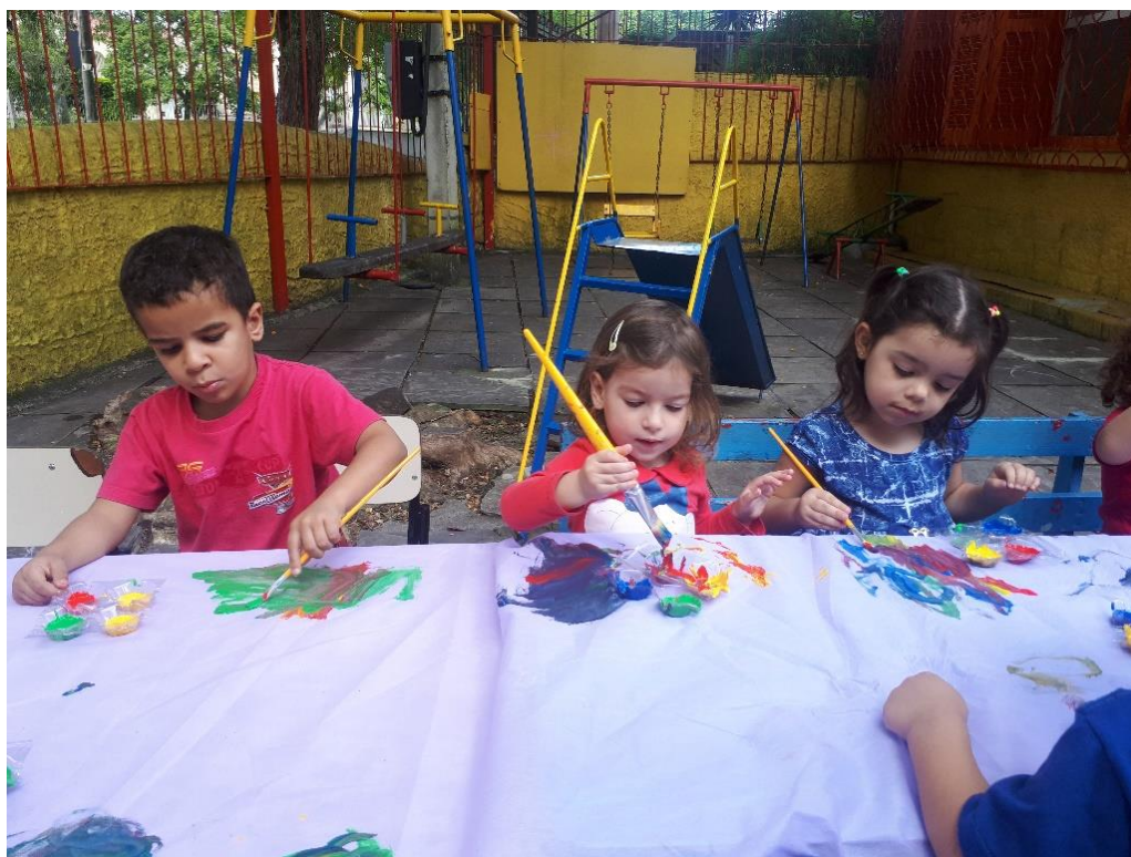
Figura 11: Fotografia 11, a mistura continua.