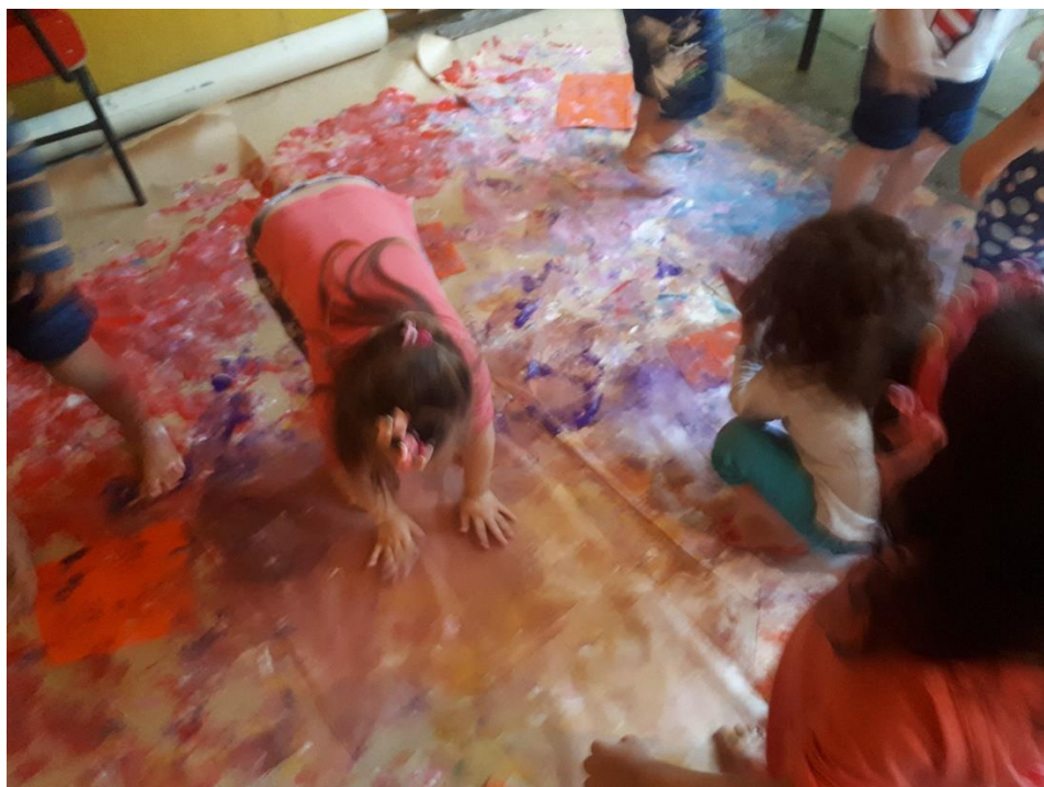
Figura 2: Fotografia 2, a exploração da tinta com as mãos e outras partes do corpo.

Tivemos ainda a grata presença de uma intensa chuva que fez com que escorresse um pouco de água sobre as bordas do papel, borrando a tinta e produzindo novas marcas observadas por eles com alegria. Entusiasmados com a presença da chuva, alguns tiveram um pouco de medo e pudemos conversar sobre estes medos naquele momento. Propus que observássemos um pouco a chuva antes de encerrarmos e começássemos a retirar a tinta dos pés, mãos e por onde mais tivessem se coberto. Alguns se queixaram que estavam com os pés “sujos”, “melecados”, demonstravam algum desconforto com a tinta, outros não resistiram e sentaram sobre o papel e a tinta e usaram as mãos também caminhando de quatro sobre o papel. Ficaram surpresos com o consentimento de “sujarem”, mãos e roupas (figura 2).