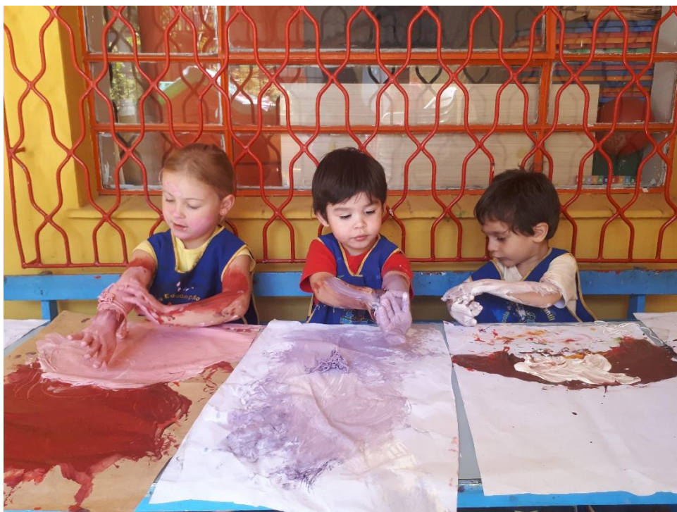
Figura 18: Fotografia 18, as coberturas com as tonalidades mais claras.

Quando cansaram do tingimento dos barbantes foram pedindo mais tinta e como neste dia tínhamos preto e vermelho dois meninos maiores (5 anos), disseram que iam se transformar em vampiros. Logo um outro pediu o marrom pois disse que seria o lobo e começaram a cobrir mãos, braços e rostos. Tivemos nesta tarde a visita de vampiros, lobos, fantasmas e até mesmo a “Pepa”. Foram coberturas de preto, marrom, rosa claro e rosa escuro. A cor rosa claro já foi uma construção de um dos momentos anteriores, em que se deram conta que com o branco “clareava” as cores (figura 18).