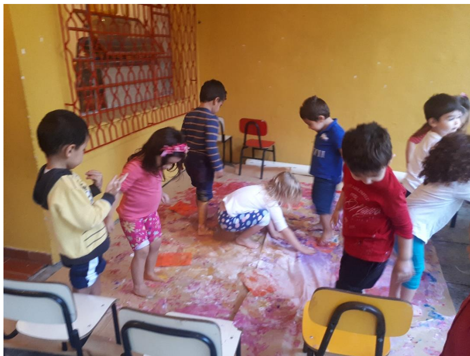
Figura 1: Fotografia 1, a pintura com os pés.

Formamos uma roda depois do lanche no início da tarde, apresentei a proposta e pedi que neste primeiro momento utilizássemos somente os pés. Fizemos algumas combinações com relação a estrutura e organização da nossa dinâmica. Neste dia, além do meu grupo de sete crianças entre 2 e 3 anos, tivemos a presença de alguns colegas do Maternal II que não puderam acompanhar o grupo que faz natação. A atividade foi muito interessante, e produziu alguns estranhamentos e receios nas crianças num primeiro momento. Quando começaram a se movimentar ao som da música do Mano Chao (grupo de música pop espanhola), estavam em um misto de euforia e medo. A tinta, em um primeiro momento, estava mais acumulada e produziu alguns escorregões e quedas. Na primeira parada retomei alguns cuidados que eles deveriam ter e propus que nos mexêssemos “bem” devagar para que não caíssemos. A cada parada uma surpresa com relação às marcas e cores que iam se misturando e produzindo marcas no papel conforme ilustrado na figura 1.