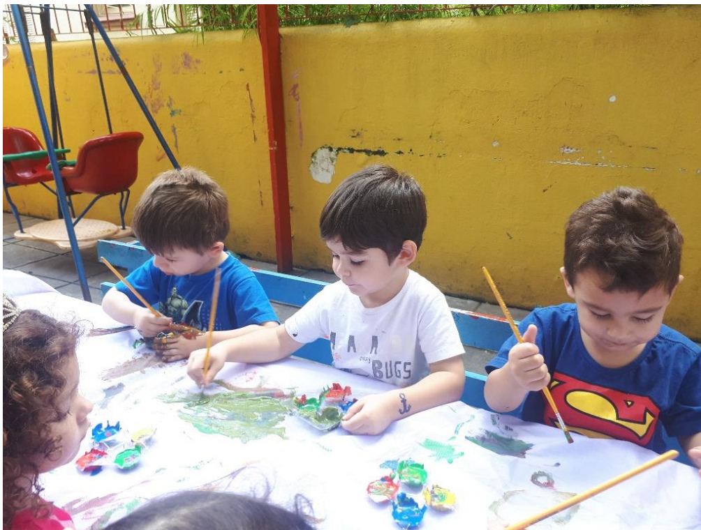
Figura 10: Fotografia 10, a mistura das cores sobre o tecido.