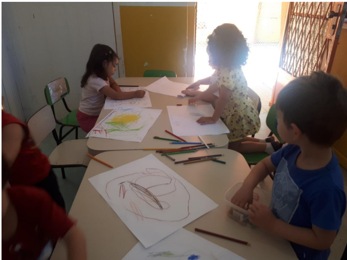
Figura 16: Fotografia 16, desenho com lápis aquarelável e giz pastel.

Quando esgotamos a exploração do desenho mostrei a elas uns potinhos de iogurte baixinhos e uns pincéis e disse que elas iam ganhar água naqueles potes para que pudessem molhar o pincel e passar nos desenhos. Ficaram animadíssimas com a ideia de usarem água. Passei meu pincel molhado na água sobre um dos meus desenhos e mostrei o que acontecia com os traços de lápis aquarelável. A maioria delas disse: