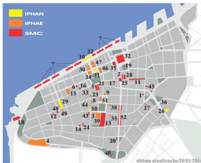
Figura 3 - Patrimônio cultural: bens tombados no centro de Porto Alegre