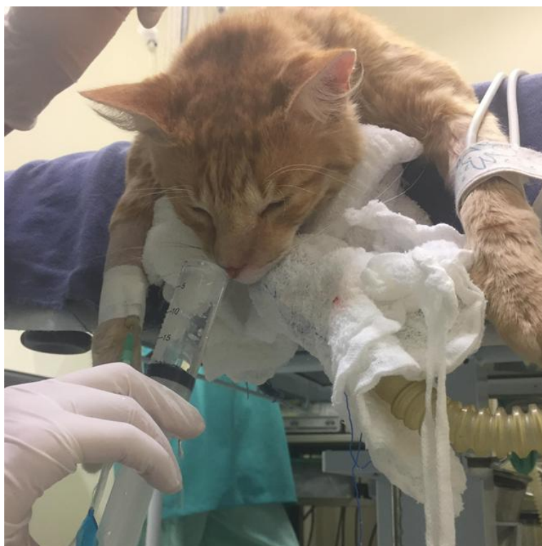
Figura 3 Lavado nasal para coleta de material biológico realizado com o auxílio de uma seringa de 20 mL

É necessário um tratamento de suporte para estabilizar os pacientes que, comumente, se apresentam anoréxicos e desidratados. A fluidoterapia pode ser indicada, e a necessidade de alimentação facilitada ou alimentação via sonda deve ser avaliada, uma vez que a incapacidade de sentir o cheiro dos alimentos afetará o apetite do paciente. A limpeza das narinas é importante para remover as descargas nasais e a nebulização com solução salina pode melhorar a inspiração (REED e GUNN-MOORE, 2012).