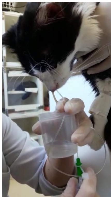
Figura 4 Lavado nasal para coleta de material biológico realizado com o auxílio de uma sonda estéril

A terapia antibacteriana de amplo espectro com boa penetração em osso e nas secreções é indicada. Os antibacterianos de amplo espectro são, por vezes, recomendados por períodos prolongados (2 a 4 meses). A cultura bacteriana e testes de susceptibilidade aos antibióticos são requeridos, especialmente quando há envolvimento ósseo (LEE-FOWLER e REINERO, 2012). Alguns antibióticos usualmente administrados na resolução da ITRS bacteriana em gatos foram tabelados (Tabela 1).