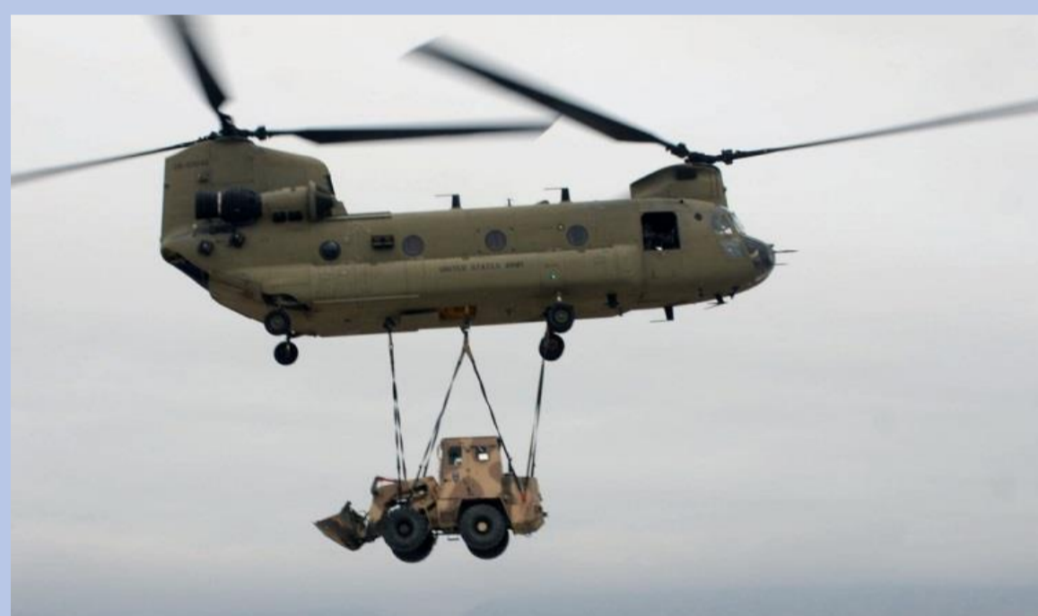
Fitas de transporte de cargas