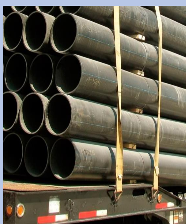
Cintas de amarração de cargas