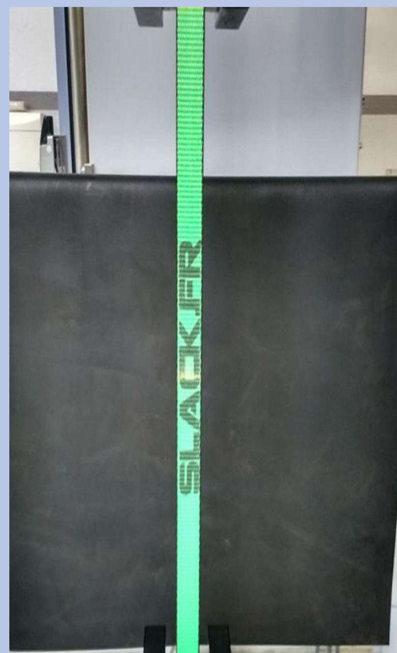
Fita durante o ensaio de tração

Os dados de Força x Deslocamento fornecidos pela máquina de ensaio estão a seguir.