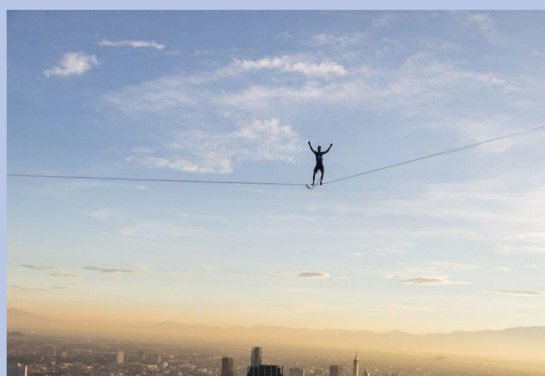
Highline - Slackline em grandes alturas

Para todo atleta de Slackline, existe uma preocupação constante com a qualidade do equipamento usado. Atualmente não existem normas específicas para fitas de amarração de carga nem de Slackline, os quais requerem elevados índices de segurança, desse modo não se pode assegurar que a carga máxima disponibilizada por cada fornecedor está correta. Dessa forma, surgiu a necessidade da realização de uma análise quantitativa e qualitativa das fitas disponíveis no mercado, nacionais e importadas, comparando seus resultados, entre si e com os valores disponibilizados.