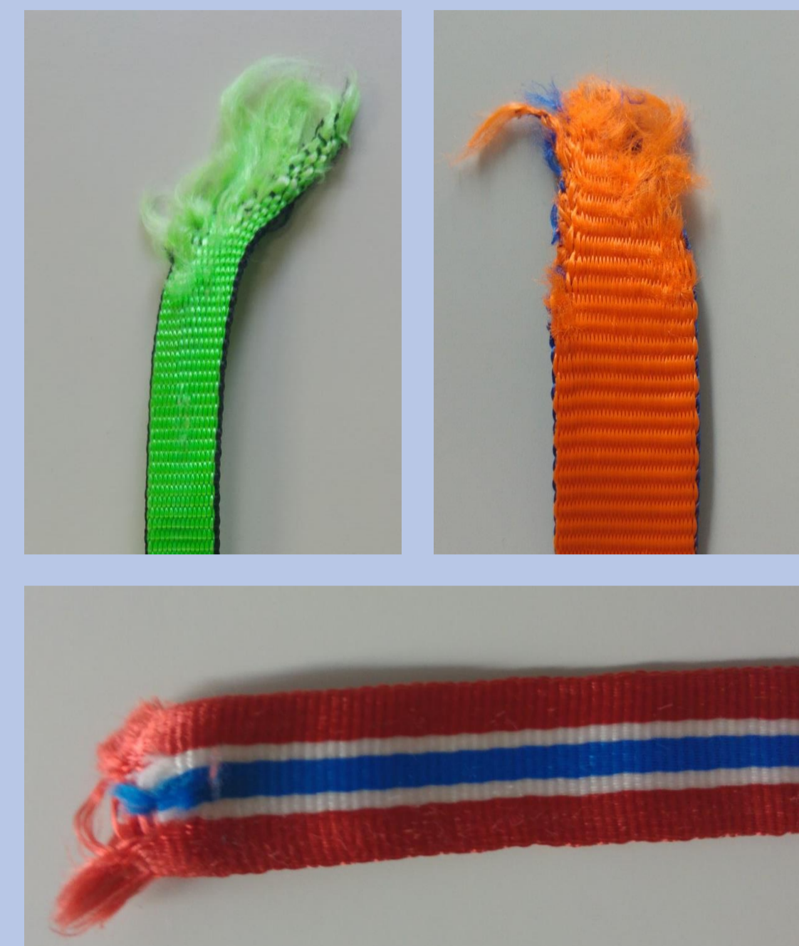
Fitas após o rompimento