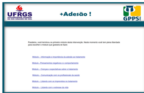
Fig. 2. Exemplo de página da intervenção (Menu de módulos).