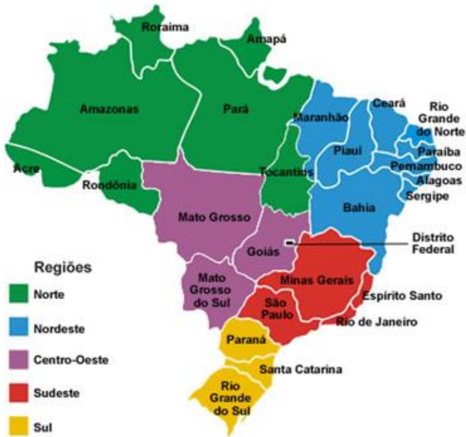
Imagem 1 – Mapa Atual do Brasil com Estados e Regiões