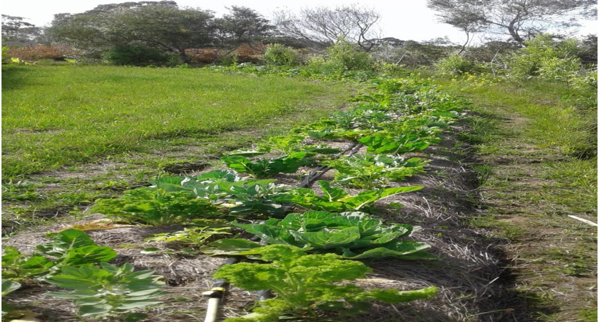
Figura 7: Produção de hortaliças no interior da propriedade A