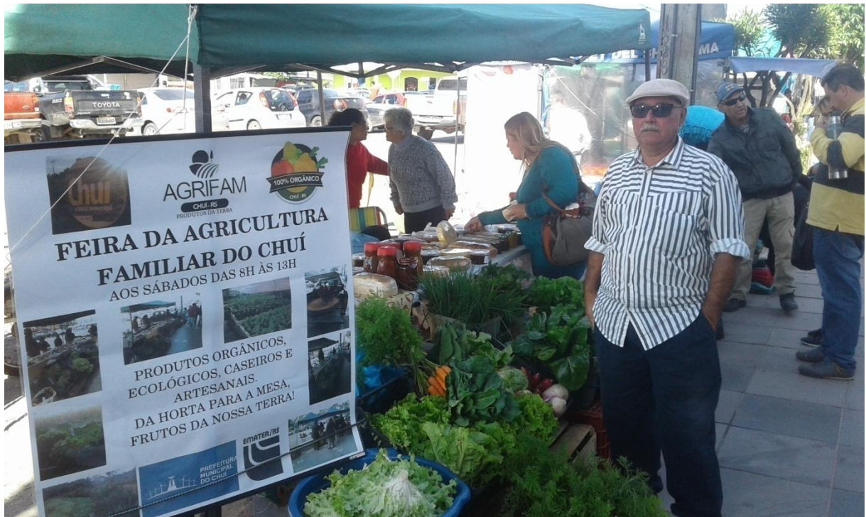
Figura 11: Feira do Produtor Rural do município de Chuí

Construindo a rota extremo sul, explorando o Parque Eólico, hortas orgânicas, marco do extremo sul, dando oportunidade do produtor rural expor seus produtos no comércio. Afirmou-me também que está ajudando os produtores a organizar e legalizar uma associação de produtores rurais, Agricultura Familiar (AGRIFAM) e artesãos, e a feira do produtor todos os sábados em um espaço oferecido pela prefeitura no centro da cidade para dar o suporte ao produtor rural, que é uma das metas de seu governo.