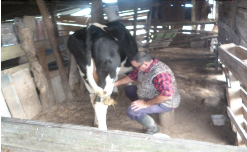
Figura 9: Ordenha no interior da propriedade B

A atividade principal é a produção de leite, cerca de 30 litros de leite por dia. Os proprietários residem no local a mais de 25 anos, o casal executa a mão de obra na propriedade, são aposentados, mas a metade da renda vem da propriedade.