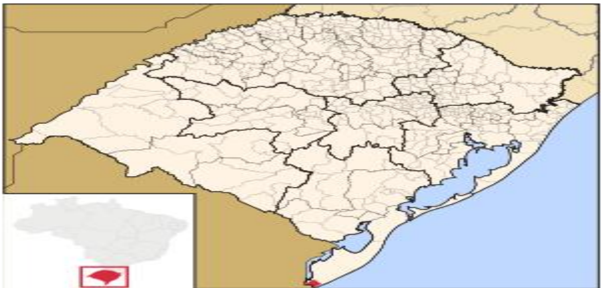
Figura 3: Mapa de localização do Chuí

O Chuí município brasileiro do estado do Rio Grande do Sul, que está localizado no extremo sul do Brasil. Faz fronteira com a cidade do Chuy, no Uruguai. A população de 6.320 habitantes, e área de 203, 201 km 2 , o clima subtropical, constituída por brasileiros, uruguaios e árabes palestinos. A principal atividade econômica do município é o turismo, havendo muitos comércios. O município é banhado pela praia Barra do Chuí, que está localizada no município de Santa Vitoria do Palmar, a 9 km, um dos pontos turísticos, também os free shops que este localizado do lado uruguaio, atraindo muitos turistas.