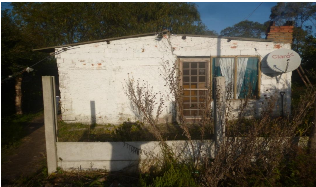
Figura 8: Casa da propriedade residência do proprietário B

Entrevistado B, um dos proprietários que reside também próximo ao Parque Eólico, a propriedade denominada Chácara da Barra, agricultura familiar, com 19 hectares, sendo distribuído 200m 2 de área familiar, 500m 2 de área de plantação de hortaliças e frutíferas, o restante destinada para os animais leiteiros e ovinos. Duas casas de alvenaria e um galpão para ordenha