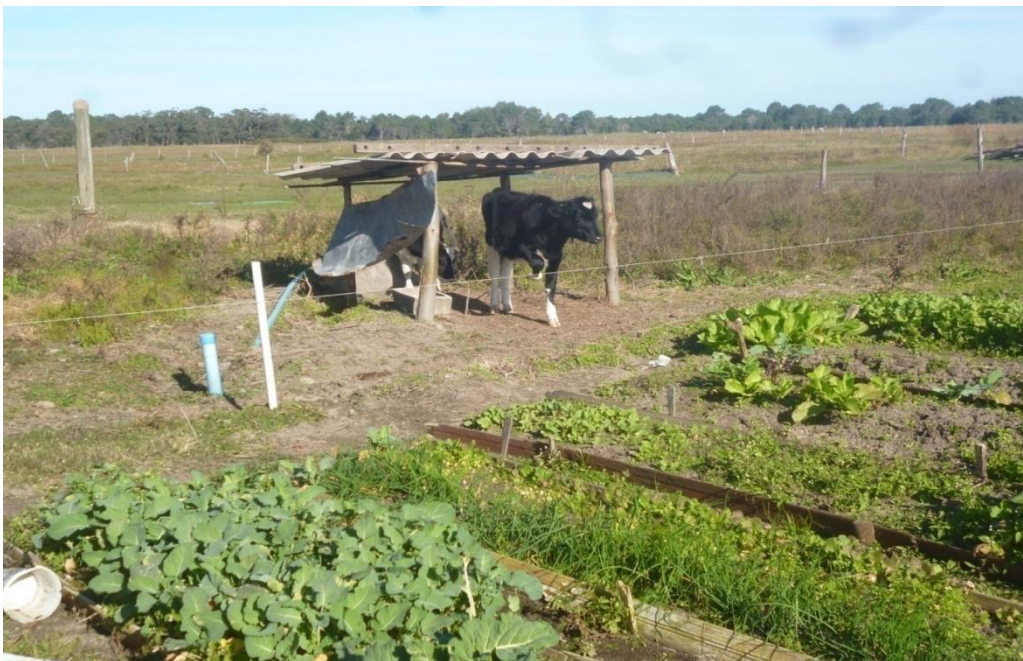
Figura 10: Produção de hortaliças no interior da propriedade B

A propriedade é diversificada, os proprietários participam da associação de produtores rurais do município e a propriedade nunca participou de atividades de turismo rural.