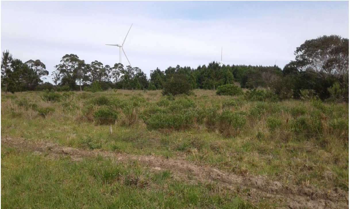
Figura 6: Plantas nativas no interior da propriedade A

O trabalho de produção é feito pelos proprietários, a propriedade possui casa de alvenaria, e uma estufa para as plantas. As atividades são bastante diversificadas, o cultivo de hortaliças sendo a principal atividade atrativa da propriedade seguido da produção de frutíferas, criação de suínos e produção de mudas de plantas de várias espécies. Além disso, possui área de matas nativas. O Parque Eólico está há poucos metros dessa propriedade.