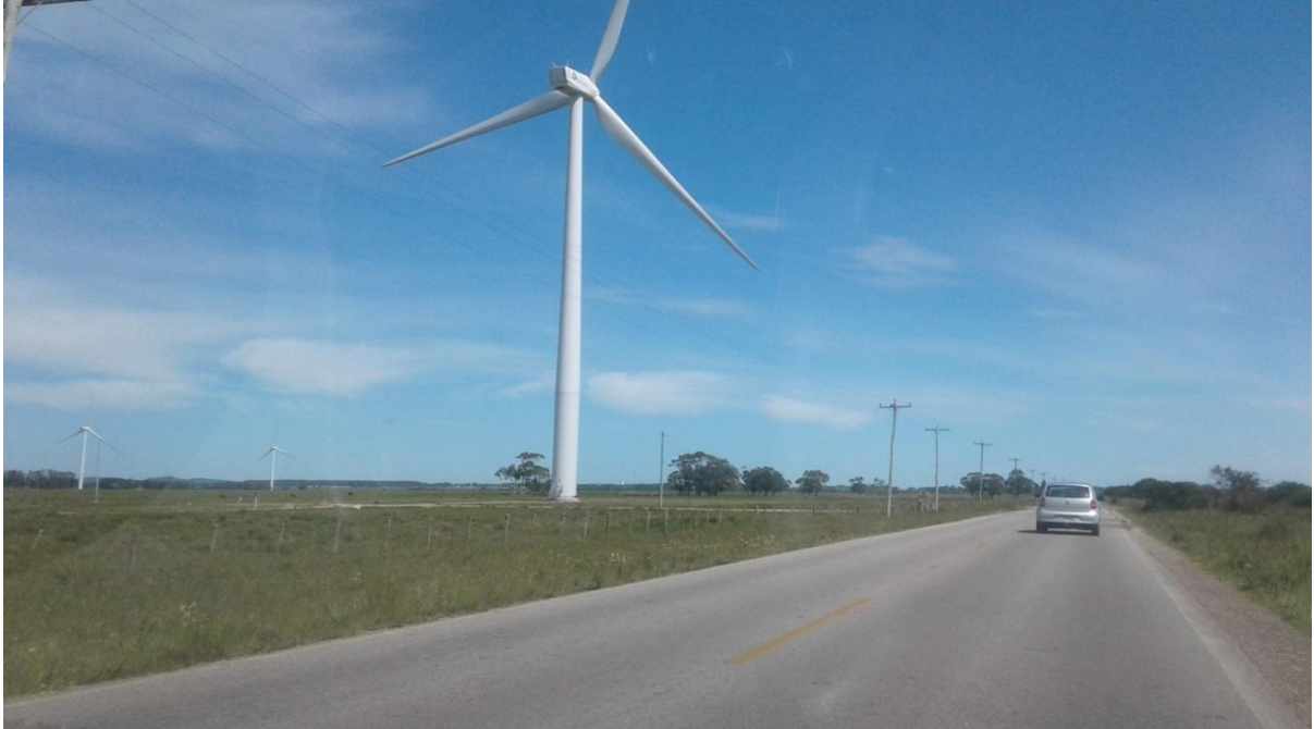
Figura 4: Aero geradores do Parque Eólico do Chuí