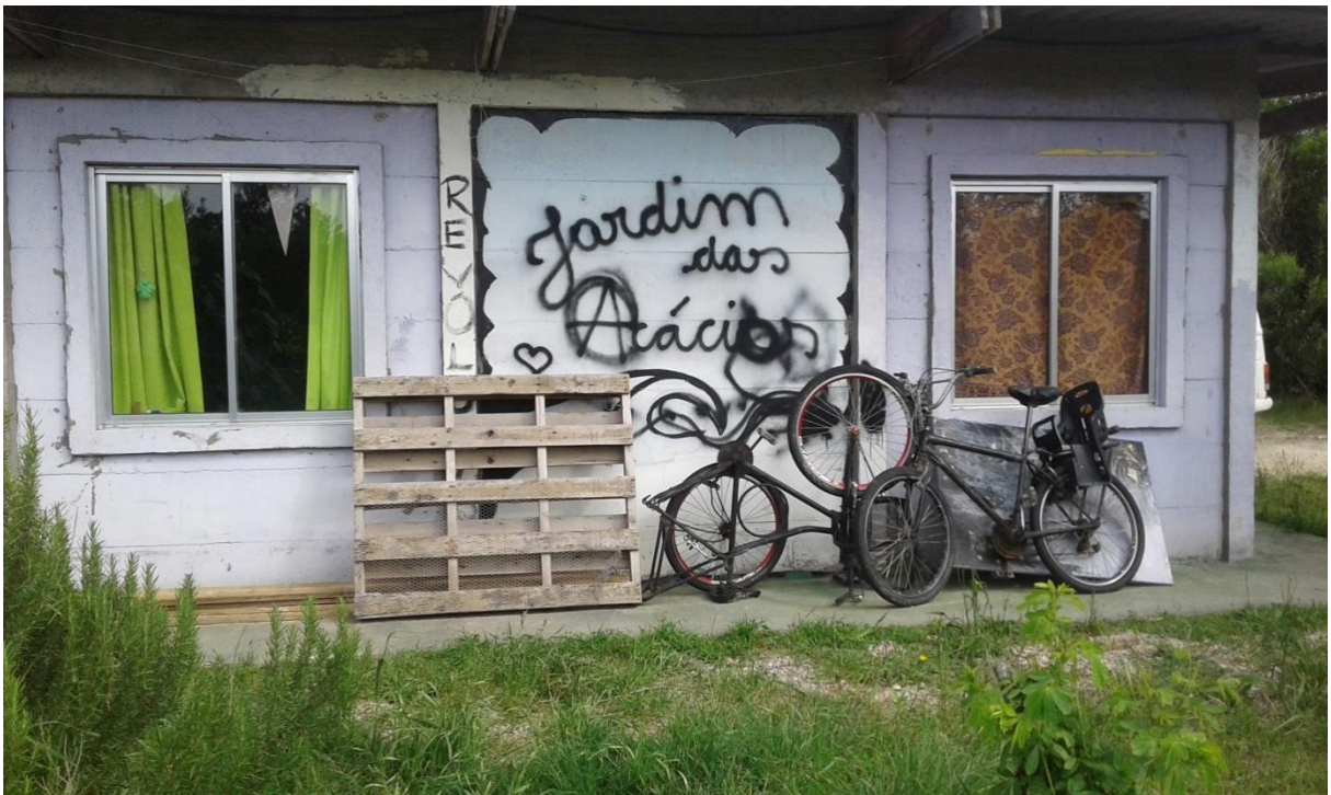
Figura 5: Casa da propriedade residência do proprietário A

Entrevistado A, um dos proprietários rurais que reside próximo ao Parque Eólico, a propriedade denominada Jardim das Acácias, com 1 hectare, agricultura familiar, moradores um casal e dois filhos, ambos professores de escola estadual e agricultores familiar, estão na propriedade a 3 anos. A metade da renda familiar é dos produtos da propriedade.