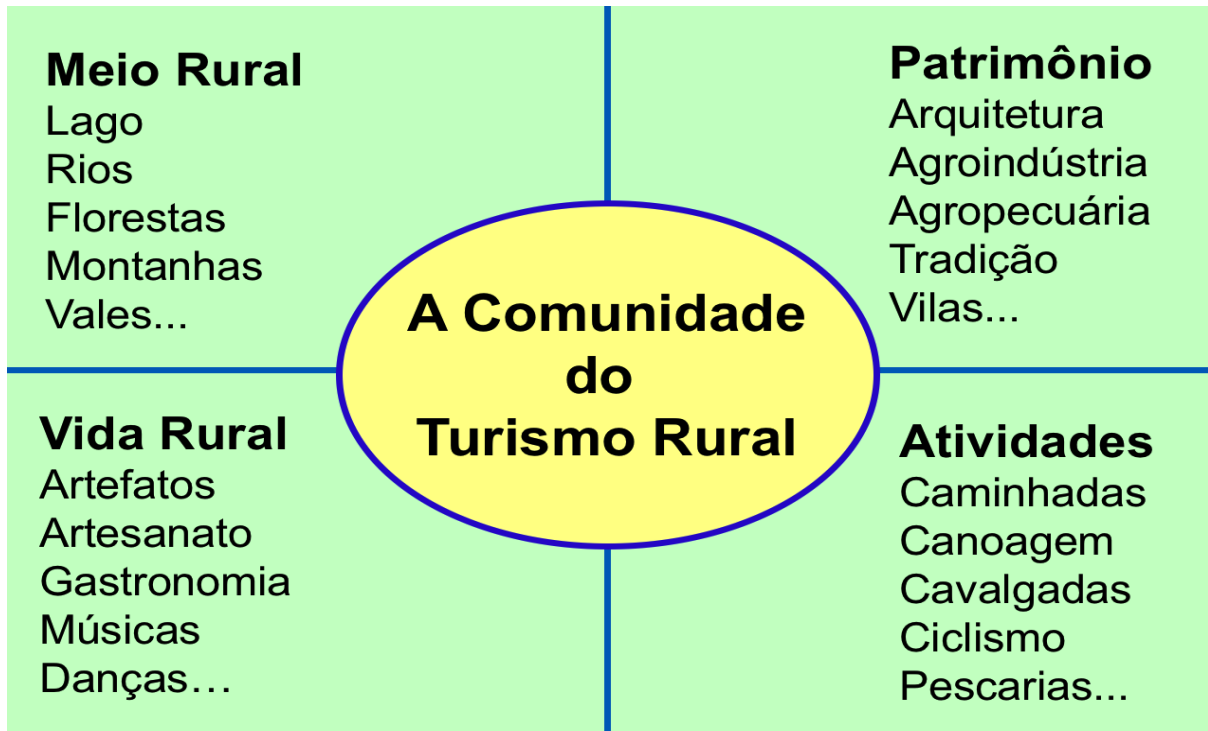
Figura 1: Diagrama explicativo comunidade do turismo rural