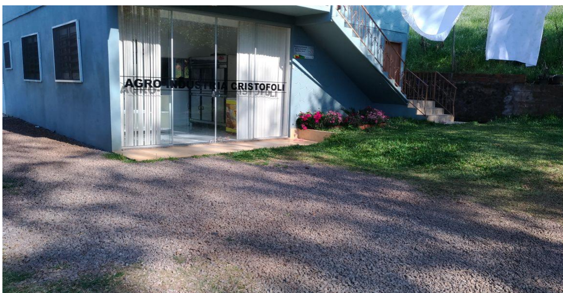
Figura 9 - Fachada da Agroindústria Cristofoli.

clientes fidelizados que vem até a mesma para adquirir os produtos, sendo que o proprietário conta que a demanda é tão grande que fazem alguns anos que eles planejam colocar uma placa identificando a agroindústria, mas não a fazem por não haver excedentes na sua produção. Além da atividade agroindustrial a propriedade trabalha com engorda de suínos, gado leiteiro, a produção de milho e louro que se destina a uma indústria da cidade que trabalha na produção de temperos, sendo que o principal atrativo da propriedade é a agroindústria familiar.