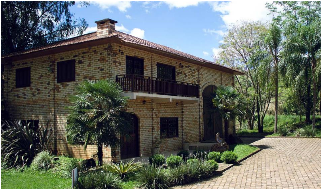
Figura 3 - Vinícola Giaretta.