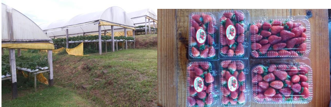
Figura 8 - Estufas e morangos embalados para a comercialização na propriedade da família Bettanin.

A propriedade possui como atrativos a produção de morangos no sistema de bancadas e a produção de uvas orgânicas. O sistema de produção de morangos pode ser visualizado na figura 8 na qual a primeira imagem retrata algumas estufas onde são produzidos os morangos e na segunda imagem é possível observar os morangos já embalados e prontos para a comercialização.