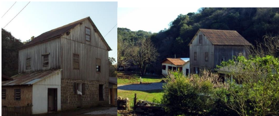
Figura 5 - Moinho Ortolan.

local, preservando o patrimônio da cultura dos imigrantes que desbravaram a região. Podemos observar abaixo fotos externas do moinho conforme a figura 5.