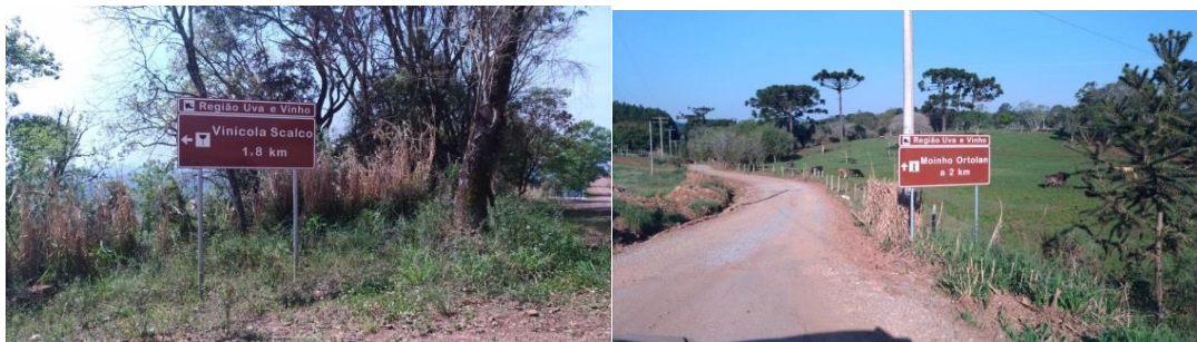
Figura 7 - Placas indicativas das propriedades.

Os entrevistados A e B ressaltam que no segmento de turismo rural o visitante primeiro procura um local para passear ou conhecer algo novo e o consumo de produtos é uma consequência. Nesse sentido, a rota que visa às compra não irá atrair visitantes as propriedades rurais. O entrevistado B afirma que falta consenso entre os integrantes e empenho do poder público para colocar em prática uma rota turística no meio rural. Para o entrevistado C ocorre a falta de divulgação, então ele observa que a divulgação da sua propriedade ocorre de boca em boca com uma abrangência pequena, sendo que a única divulgação existente é a sinalização da propriedade com placas que a ATUASERRA colocou, mas da rota não existe nada específico de divulgação. As imagens de algumas placas de sinalização podem ser visualizadas na figura 7.