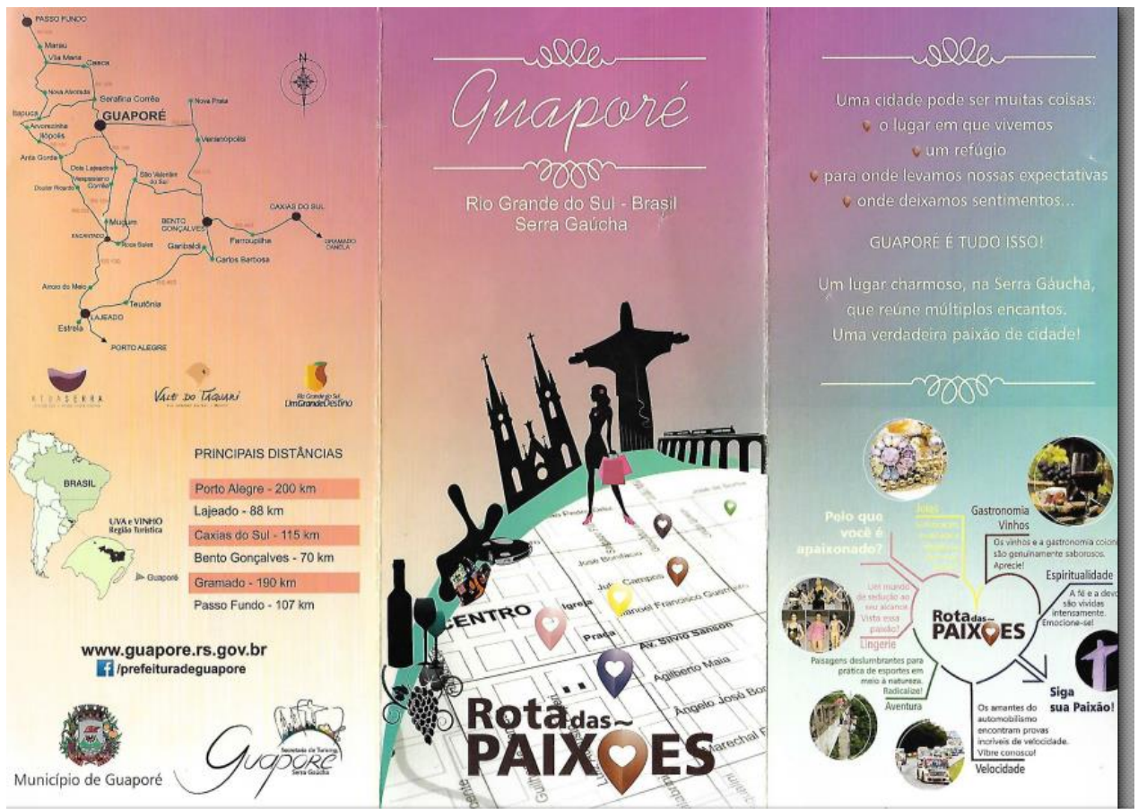
Figura 6 - Folder da rota das Paixões.