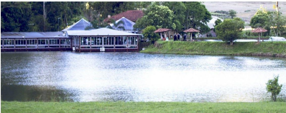
Figura 4 - Pesque e pague e restaurante na propriedade da família Giaretta.