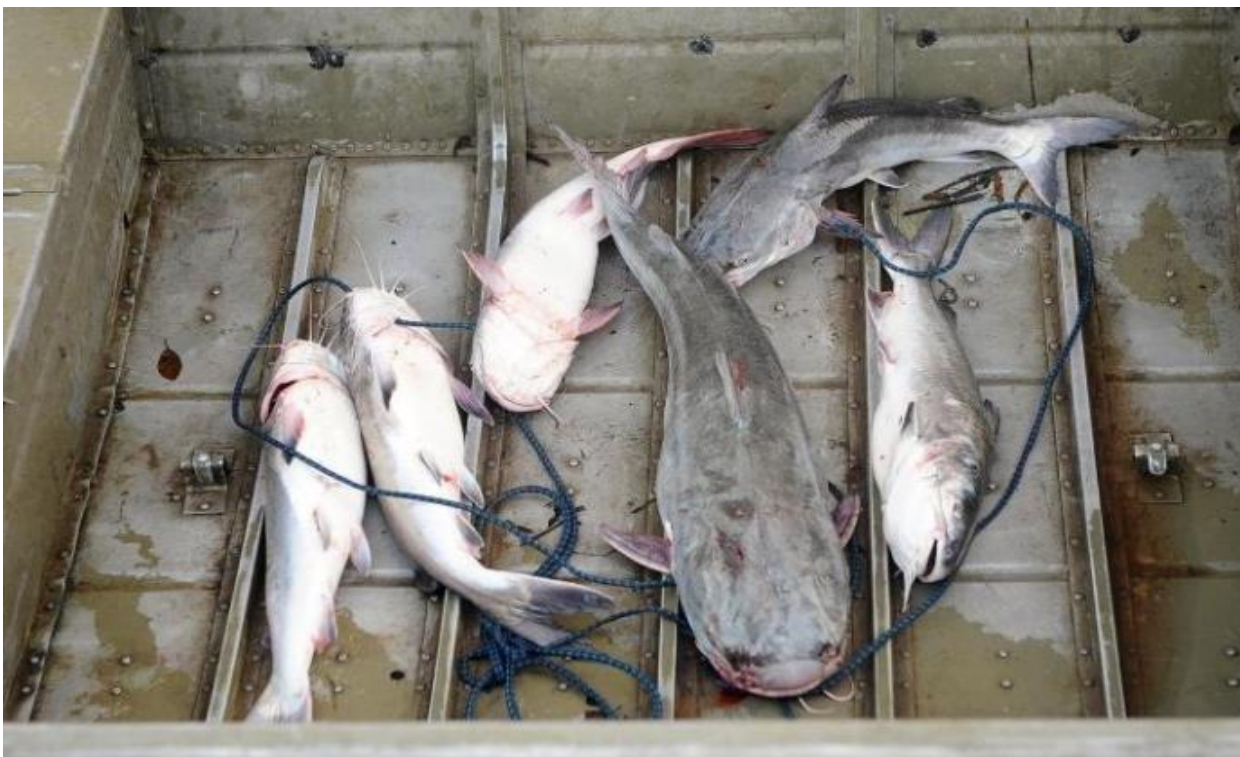
Figura 6 – Disponível em: https://www.google.com.br/search?rlz=1C1CHZL_pt-BRBR753BR753&biw=1366&bih=662&tbm=isch&sa=1&ei=9_UsW77GEoupwgTz_4uAAg&q=Bacia+hidrografica+do+Rio+tramandai&oq=Bacia+hidrografica+do+Rio+tramandai&gs_l=img.3..0i24k1.146996.159868.0.160660.23.23.0.0.0.0.132.2281.15j8.23.0....0...1c.1.64.img..0.5.530...0j0i30k1j0i5i30k1j0i8i30k1j0i7i30k1j0i8i7i30k1.0.Vhb0z8N2RZA#imgdii=JoywfxeHofghjM:&imgcr=O_v1tjy7DAr__M : Acesso em 30 de maio de 2018.