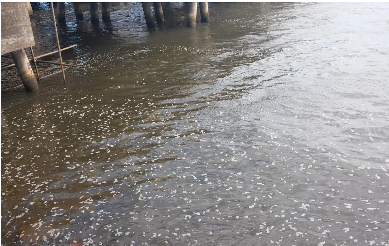
Figura 5 - Vista parcial da margem do Rio Tramandaí, indicando um possível processo de eutrofização de suas águas, no ano de 2018.

A floração pode ser ainda pior, pois podem apresentar organismos que liberam substâncias tóxicas, causando a mortalidade de peixes, de outros animais e até mesmo seres humanos (DANTAS, 2006). Segundo este autor, a queda da qualidade da água afeta todo território em torno do rio, levando a queda na pesca, no turismo e na saúde daqueles que lá residem, contribuindo para a redução econômica do município, como se fosse uma reação em cadeia. Com os detritos sendo alocados nas águas do Rio Tramandaí, todos os seres vivos que de alguma forma permanecem neste habitat podem ser prejudicados, os pescadores, as aves e até mesmo os peixes sofrem com a poluição, pois sem ter um ecossistema adequado as suas necessidades, os peixes e seres vivos ao em torno do rio acabam por morrer ou sendo contaminados ao ponto de não poderem ser consumidos pelos seres vivos.