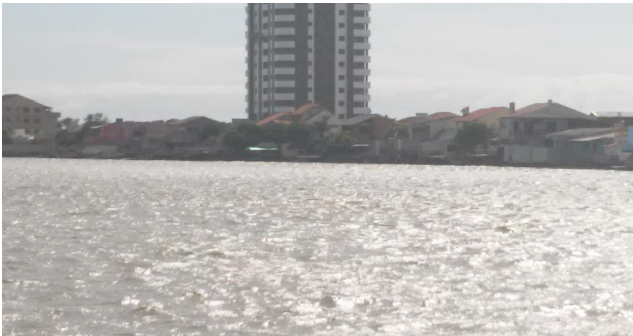
Figura 2 - O acúmulo de casas e construções às margens do Rio Tramandaí, no ano de 2018 (Fonte: Arquivo do autor).

A contaminação do rio por esgoto ocorre em grande quantidade na época da alta temporada, devido à grande quantidade de veranistas que vem para o litoral no período de férias dos seus respectivos trabalhos, com o intuito de descansar, visitar o mar e sair de suas rotinas diárias de suas cidades (CAMPELLO, 2006 apud FABRÍCIO F°. 1989, p. 25). Mas o município não está devidamente preparado para receber tantas pessoas em um período tão curto, e por isso ocorre alguns problemas devido ao aumento significativo nesta época do ano, e quando eles regressam para suas cidades, deixam para trás uma grande quantidade de lixo e esgoto na cidade, e quando ocorre a chuva, esses resíduos são levados ao rio pela própria chuva (CAMPELLO, 2006).