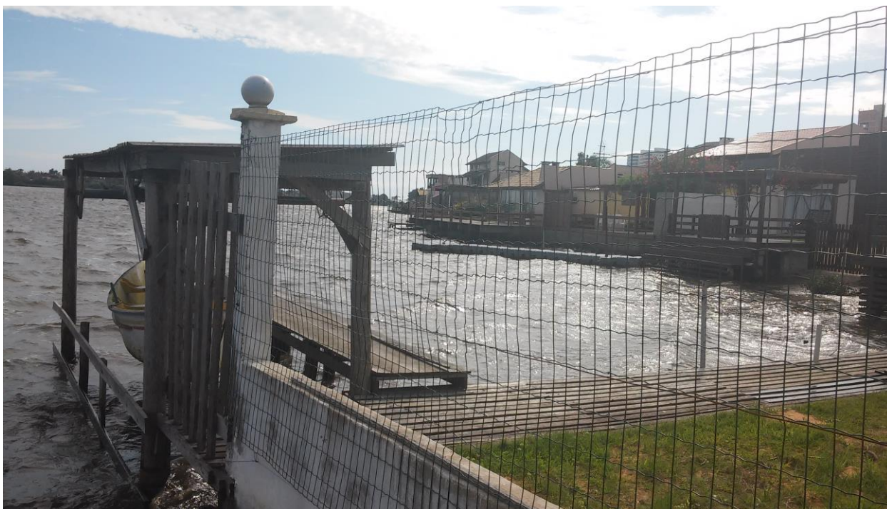
Figura 1 - Construções às margens do Rio Tramandaí, no ano de 2018, onde se descartam dejetos provenientes de esgoto doméstico.

Rio Grande do Sul, com conseqüente erosão do solo e transporte de sedimentos proveniente das rochas vulcânicas da bacia do Paraná (Serra geral), que são ricas em Fe e Cu. Outra possibilidade indicada pelos autores, seria a adição de metais através de efluentes domésticos gerados em Imbé e Tramandaí. Em Tramandaí, as casas às margens do rio, lançam nas águas seus dejetos sem qualquer tipo de tratamento, e em Imbé os dejetos não possuem tratamento, sendo utilizadas fossas sépticas que pode provocar contaminação no lençol freático (CAMPELLO, 2006 apud. AYERBE, 2003).