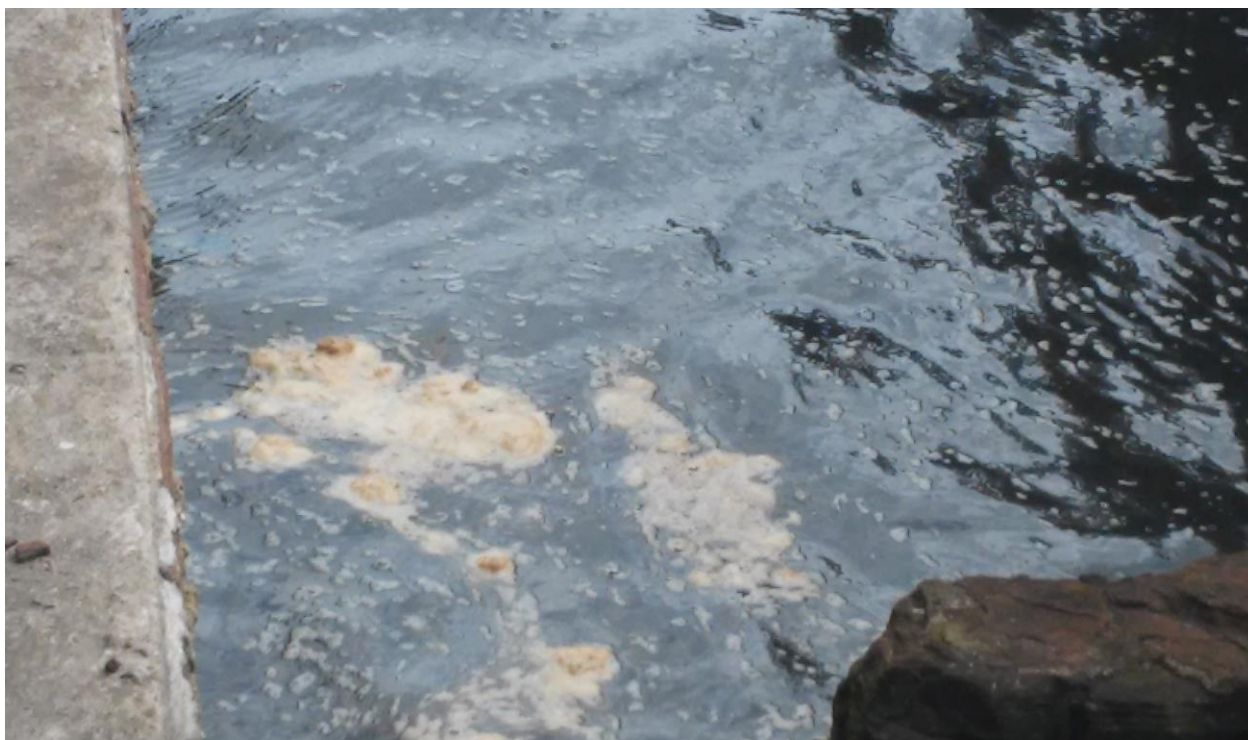
Figura 4 - Espuma no Rio Tramandaí, no ano de 2018, resultante do descarte de dejetos provenientes de esgoto doméstico.

As águas do rio acabam contaminando também os peixes, no qual os pescadores ao consumir sua carne, podem ficar doentes devido o consumo do peixe deste rio contaminado pelos esgotos das cidades de Tramandaí e Imbé. Dentre as doenças mais comuns devido a este tipo de contaminação está o vômito, mal-estar e disenteria (CAMPELO, 2006 apud SILVA et. al. , 2001). O esgoto descartado diretamente no Rio é significativo, mas não tanto quanto ao longo dele, já que o rio possui uma grande extensão, ele passa por diversos municípios e ao longo deste rio, há o descarte de grandes quantidades de agrotóxicos e fertilizantes, que possui grandes quantidades de metais como Cromo (Cr), Chumbo (Pb), Mercúrio (Hg), Cobre (Cu), Cádmiio (Cd), que por sua vez, é muito prejudicial à saúde, e em algumas situações de excesso, pode até causar câncer. Portanto, essa parte do rio, torna-se potencialmente, muito mais preocupante do que o descarte de esgotos e lixo (Fig. 3). A qualidade de água do rio vem seguindo em uma decrescente, tanto pelo descarte de resíduos sólidos, esgoto, como pela contaminação de agrotóxicos.