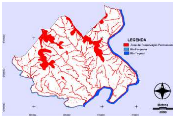
Figura 1. Zona de preservação permanente do município de Arroio do Meio

A delimitação das Áreas de Preservação Permanente (APPs) do município de Arroio do Meio (Figura 1) foi realizada considerando os critérios estabelecidos pelo Código Florestal Brasileiro e seguindo as resoluções Conama 302/02 e 303/02, que regulamentam as APPs para os reservatórios artificiais e dos topos dos morros. É importante lembrar que em 1989 foi feita uma modificação no Código Florestal Brasileiro (Brasil Lei 4771, 15/09/65), que até então previa, em seu artigo 2º, a largura mínima para as matas ciliares de cinco metros para cursos de água de até 10 metros de largura. Com a modificação no texto do artigo 2º, no trecho pertinente às matas ciliares, a largura mínima passou a ser de 30 metros.