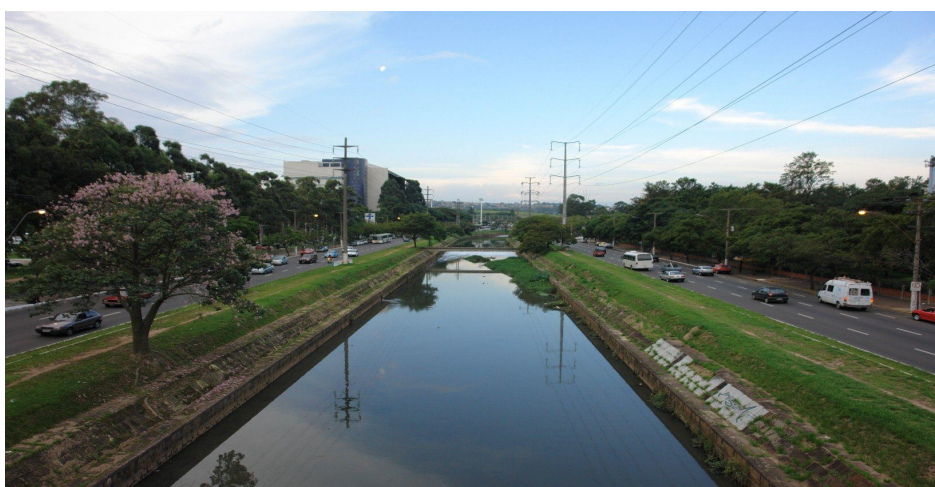
Figura 1: Arroio Dilúvio; UFRGS/Divulgação.

O presente estudo buscou traçar o perfil de resistência a antimicrobianos de enterobactérias isoladas do Arroio Dilúvio a fim de compreender como estes organismos estão respondendo à pressão seletiva ocasionada pelo aumento da poluição e urbanização.