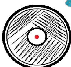
Disco de antimicrobiano