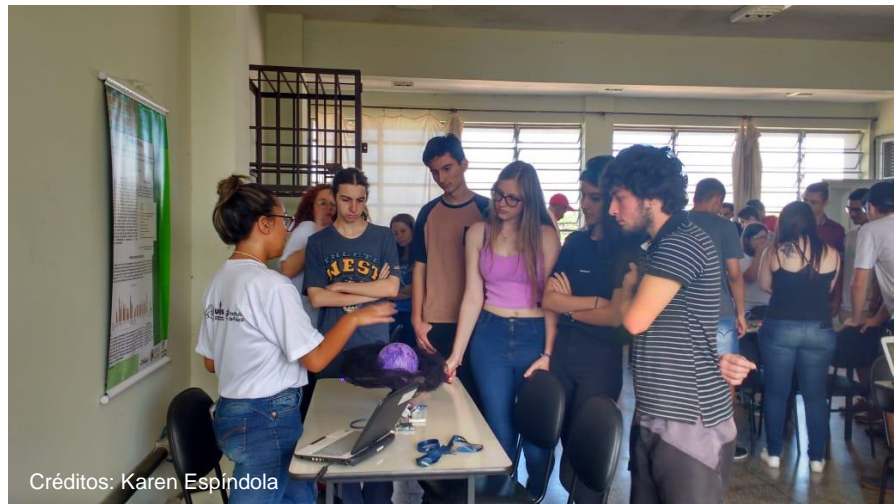
Figura 5 - Aluna do GGPRO apresentando seu trabalho na feira promovida na escola.