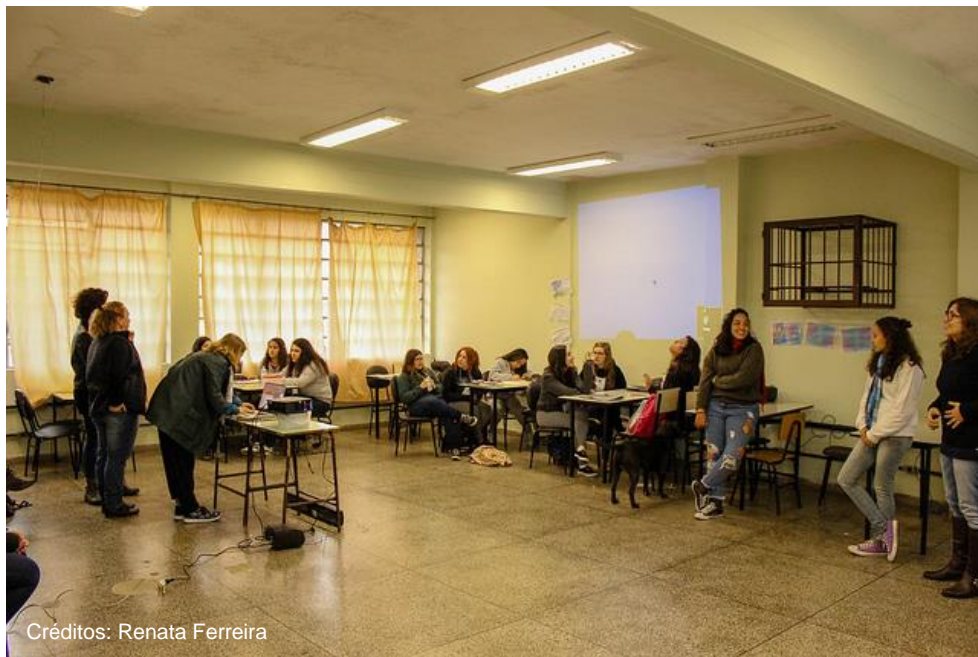
Figura 4 - Configuração da sala nas oficinas de robótica.

foram apresentados conceitos básicos sobre circuitos elétricos, a placa Arduino UNO e componentes eletrônicos. Foi realizada uma dinâmica com três participantes, em que cada uma recebeu um crachá com um desenho para representar um circuito elétrico básico. Os três desenhos representavam um resistor, uma fonte de tensão e um amperímetro. A Bolsista 1 propôs uma atividade com o Arduino em que as alunas iriam fazer uma sinalização de freio para bicicletas.