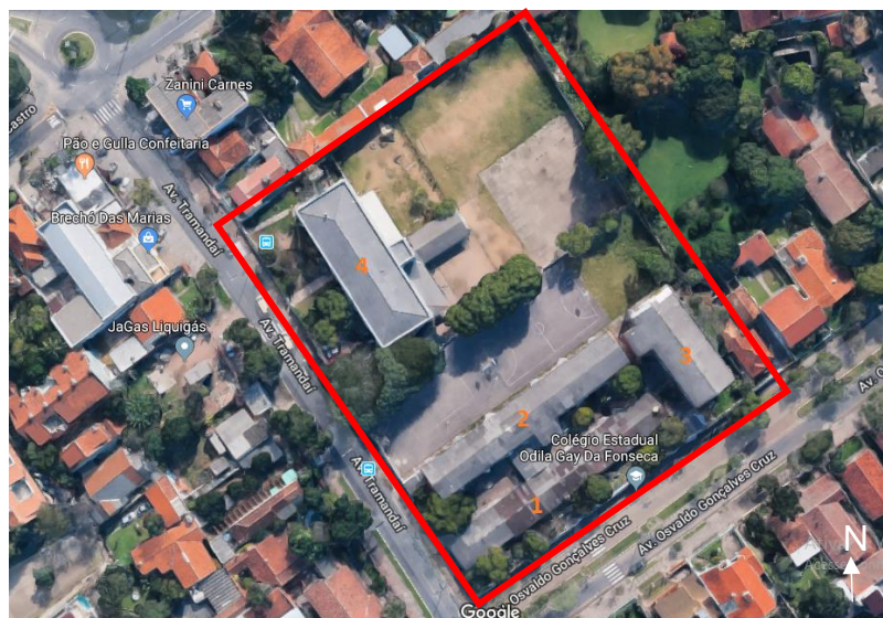
Figura 1 - Imagem via satélite obtida em 2019 da Escola Estadual Odila Gay da Fonseca.

A infraestrutura da escola é composta por 4 prédios, como podemos ver na Figura 1. O prédio 1 é utilizado para a administração da escola e também é onde se localiza a sala dos professores, diretoria, secretaria e sala de multimídia. Nesta sala contém um quadro negro, um televisor, um aparelho de videocassete e um DVD player . O prédio 2 é utilizado para realizar as aulas das turmas de Ensino Médio. O prédio 3, composto por 4 andares, é utilizado apenas para a utilização do laboratório de informática, que foi local onde foram realizadas as atividades do GGPRO. No laboratório de informática continham vários netbooks, que foram utilizados para as oficinas de robótica, um quadro negro, e várias mesas grandes para trabalhos em grupos. Na sala ao lado, continham vários computadores desativados. Já o prédio 4, é onde ocorrem as aulas do Ensino Fundamental. A escola não possui rede de internet.