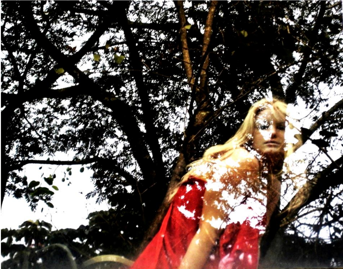
Imagem 1- fotografia: Edegar Starke

Encontrei essa foto, um dos poucos registros que tenho daquela montagem. O figurino era vermelho, a sala tinha janelas grandes, eu podia ver o público primeiro da janela, enquanto chegavam no espaço. Vejo meu rosto sem contorno na imagem que não deixa ver o que há do outro lado, na direção oposta; os outros rostos, se é que existiam, já não estão mais. Raramente se fotografa o público, como se o mais interessante estivesse do outro lado. Falta fotografar o que está oculto na cena e que a faz ser como é. A falta é sentida, tanto como prática, quanto como incapacidade de registro da coisa que faltou registrar. Mas o que está oculto não se deixa desocultar. Aqui não se vê o contorno do meu rosto, faltava-lhe rosto para ser rosto. Faltava, faltava-lhe ser, simplesmente por ser falta, e agora, por já não estar.