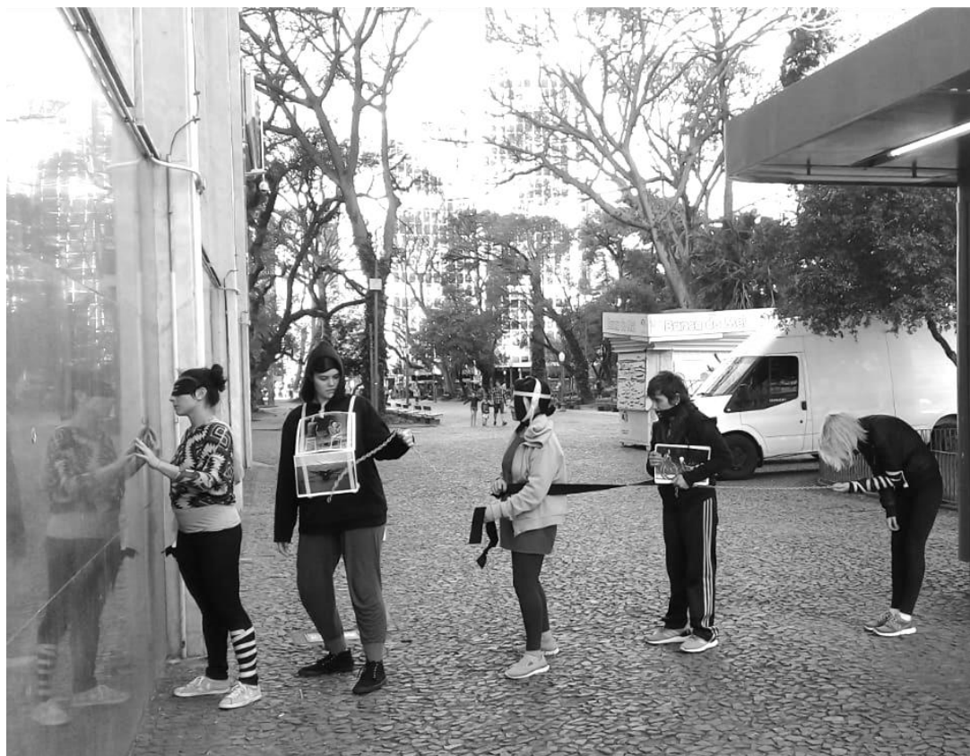
Imagem 6- Fotografia: Carolina Teixeira