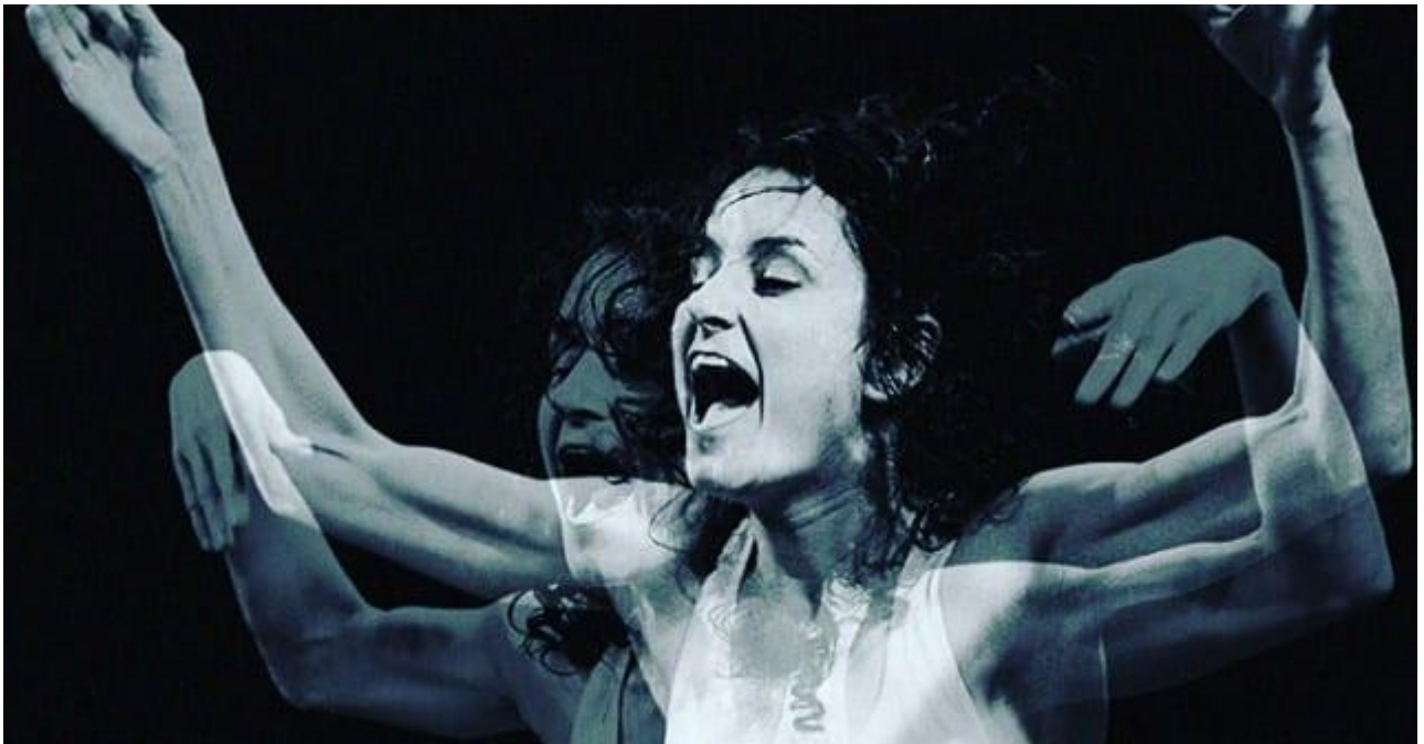
Imagem 2- Fotografia: Rafael Saes (divulgação)

Voltei para abraçar e agradecer a atriz, não soube dizer mais que isso.