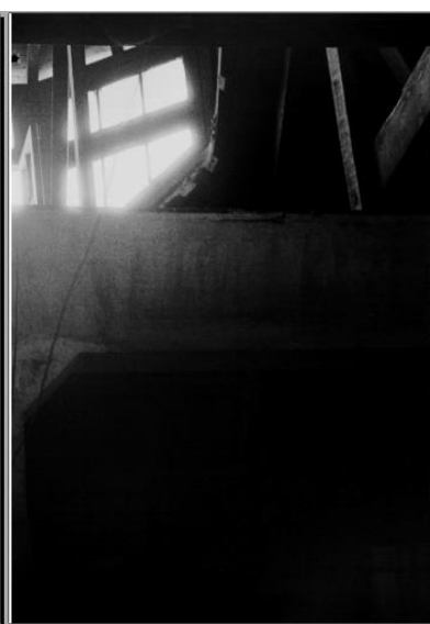
Imagem 14 (Ronald Kay)

Aqui, outra camada de relação é possível: