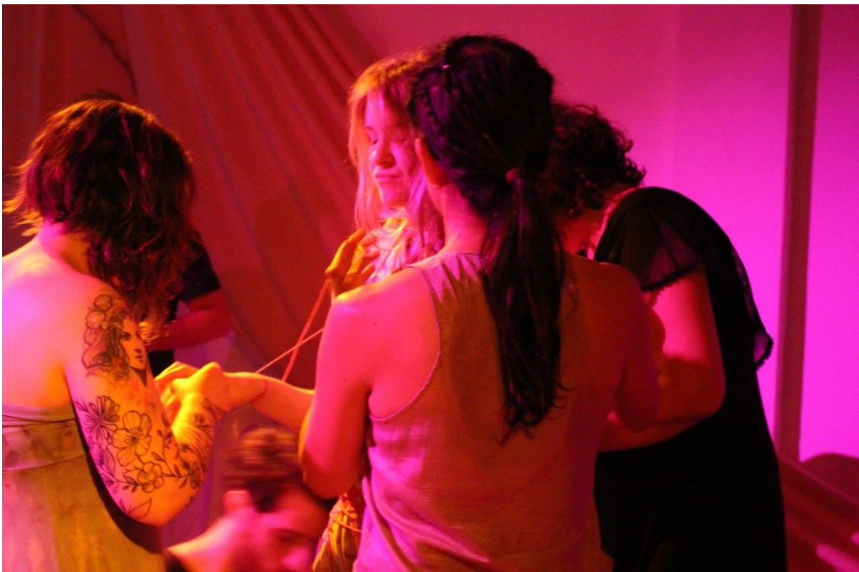
Imagem 11

Ação performativa realizada no Meme Santo de Casa Estação Cultural, Porto Alegre, 2016.