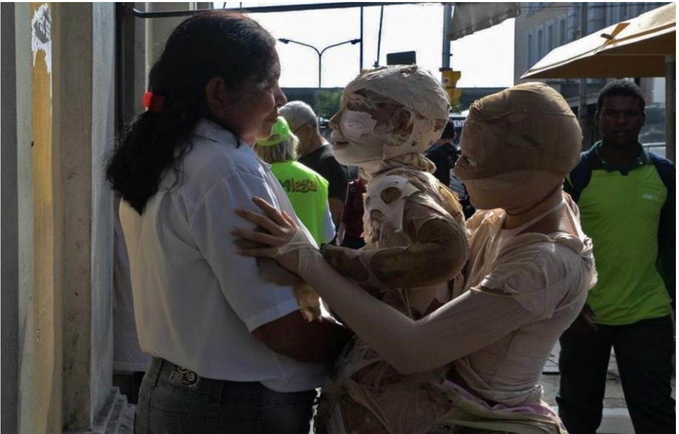
Imagem 3 - Fotografia: Milena Machado.

sua passagem habitual interrompida por esse olhar. Corpos espectadores e atores que fazem em conjunto o acontecimento do que trocam e fazem nascer, acontecem no mesmo movimento do que fazem acontecer. Fazem acontecer a criação que, em comum, produzem no encontro de suas existências partilhadas e sentidas, tornando-se um para o outro, um com o outro, corpos que passam uns pelos outros deixando rastros e vestígios uns nos outros, vestígios de um acontecimento que passou.