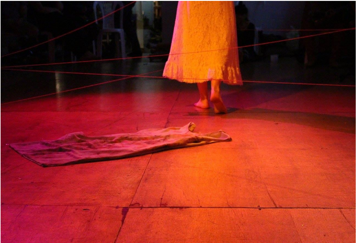
Imagem 10 - Fotografia: Patrícia Silveira