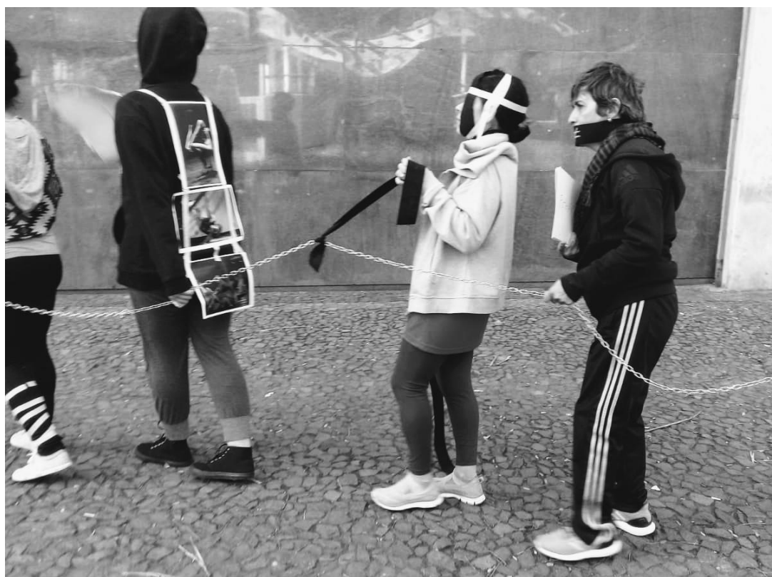
Imagem 7- Fotografia: Carolina Teixeira