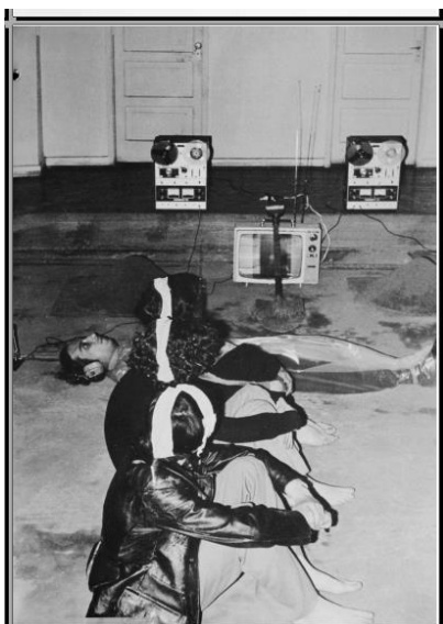
Tentativa Artaud: Imagem 12

Em 2008, quando as fotografias do acontecimento teatral vieram à tona, elas passaram por um processo de acoplagem entre paisagens sonoras e fotografias. Ronald Kay integrou às fotografias sonoridades que foram gravadas pelas escutas da época (sons de tiros, gritos, vozes assustadas). Podemos dizer que a apresentação das imagens e sonoridades em 2008 representa um aparecimento, já que o trabalho permaneceu durante mais de 30 anos recluso. Essa distância temporal de sua exibição marca o desejo de ver aparecer aquilo que desapareceu: os corpos desaparecidos e o teatro como paradigma da desapareição, da efemeridade, da perda, da negatividade. Ao aparecer a público, as imagens atualizam no presente o peso do desaparecimento – tornam presentes as ausências que permanecem flutuando na memória dos corpos. As imagens são estarrecedoras, a sensação que elas causam se aproxima de um profundo escuro.