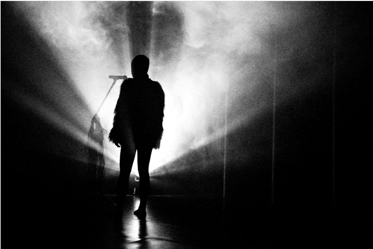
Imagem 4