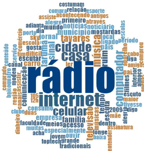
Figura 11. Termos mencionados em relação aos usos do rádio