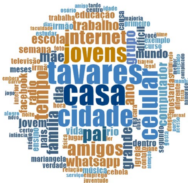
Figura 1. Termos mencionados em relação aos lugares de convívio

Fonte: Elaborado pelos autores no software NVivo (2017)