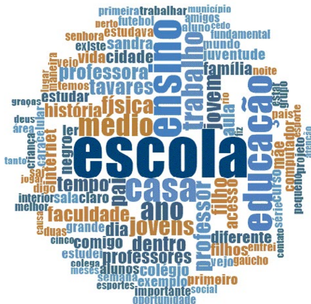
Figura 5. Termos mencionados em relação à formação escolar