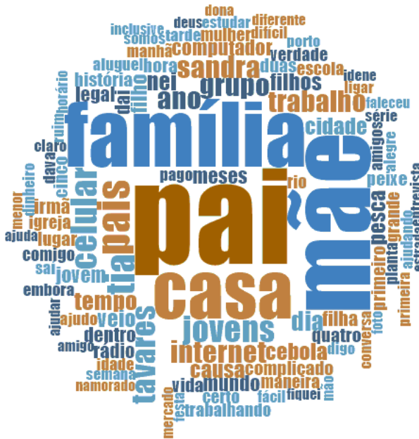
Figura 3 – Termos mais mencionados em relação à família