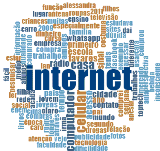
Figura 9. Termos mencionados em relação aos usos da Internet