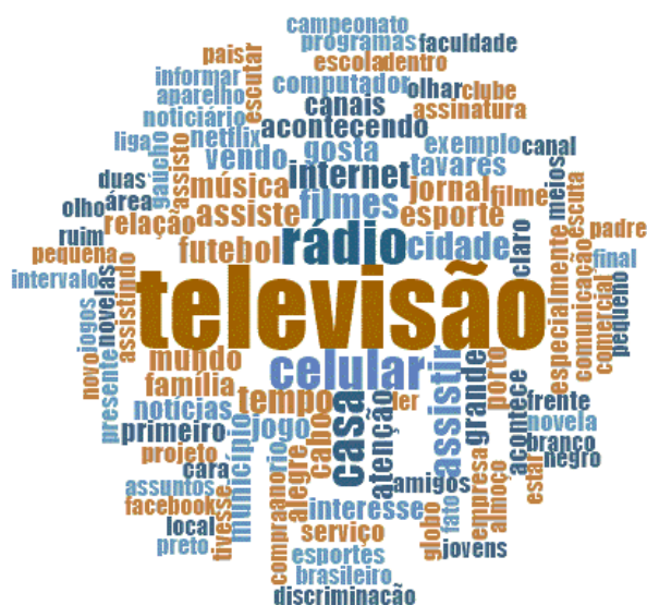
Figura 10. Termos mencionados em relação aos usos da televisão

No que diz respeito ao consumo de televisão (Figura 10) ressaltam-se os termos «família» e «casa», os quais indicam ser esta uma prática ainda realizada no âmbito doméstico e coletivamente, como testemunha uma jovem: «[...] à noite a gente olha televisão, a gente toma banho e fica na Internet... eu e meus pais e meu irmão» (Entrevistada 9). Destacamos que essa prática já estava configurada na pesquisa PBM (SECOM, 2016), a qual registrou que, dos jovens de 18 a 24 anos, 72% assistem à televisão durante todos os dias da semana. Isso não significa que em alguns momentos o façam sozinhos, como indicam as palavras «celular», «internet» e «computador», pois os jovens acessam seus conteúdos através deles, assim como citam que utilizam esses dispositivos enquanto assistem à televisão. Uma jovem conta que complementa o conteúdo televisivo por meio da internet e das redes sociais: «[...] às vezes, quando eu quero saber alguma coisa... tipo, se dá (sic) na televisão, aí diz assim: em tal site tem mais... Aí eu procuro» (Entrevistada 4).