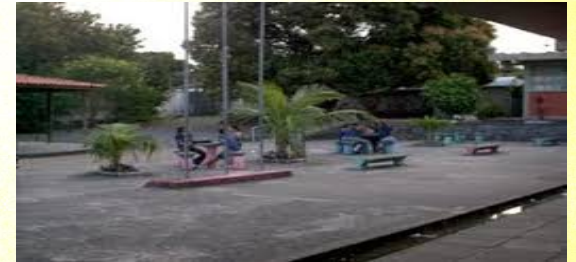
Colégio Est. Edvaldo Brandão