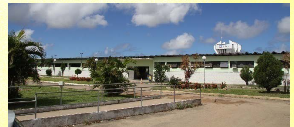
Maternidade Albert Sabin