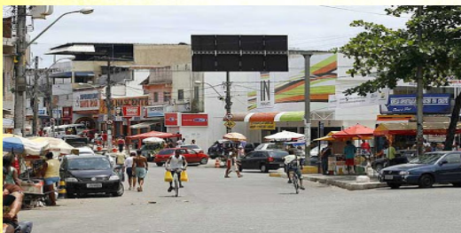
Com. na Rotula da Feirinha