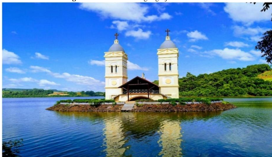
Figura 1 - Torres da antiga igreja matriz de Itá

Na década de 1970, Itá depara com o seu maior dilema, quando a cidade foi inundada para a construção de uma hidrelétrica que represou a água do rio Uruguai, cobrindo todo o seu território. Isso exigiu que as famílias fossem indenizadas, e a cidade reconstruída numa região mais alta. Da cidade velha, inundada pelas águas, restaram visíveis apenas as torres da antiga igreja, que se constituem em ponto turístico e patrimônio cultural, uma vez que elas exercem uma função social e simbólica para o grupo que vivenciou a transição e transformação do lugar.