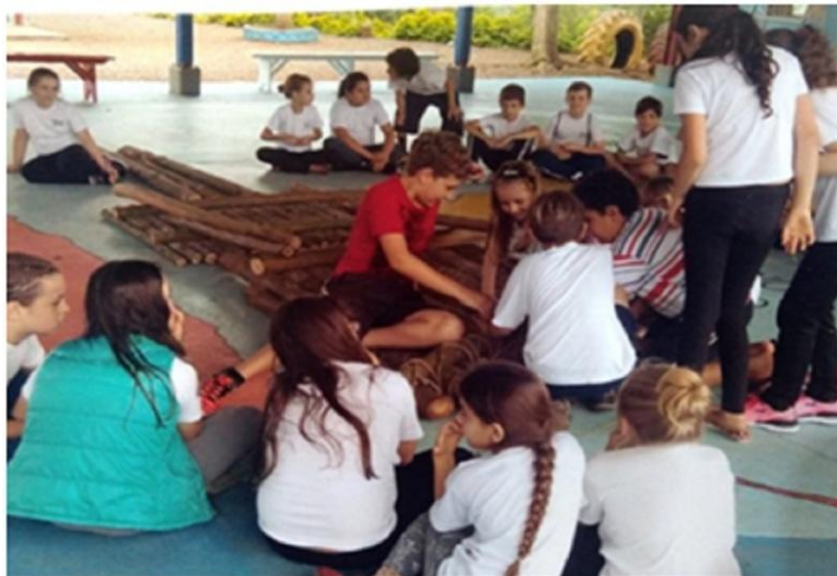
Figura 4 - Confeção de balsa com os alunos da Escola Valentin Bernardi