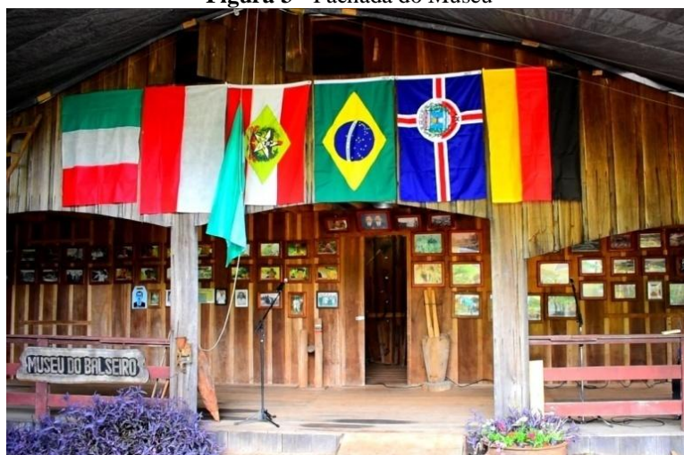
Figura 3 - Fachada do Museu

No mesmo local de onde partiam as balsas pelo Rio Uruguai, foi criado o Museu do Balseiro. Composto por um acervo que reúne mais de quinhentas peças do cotidiano e do ofício de balseiro, entre as quais ferramentas, utensílios e móveis da época, o local vem transformando-se em local de memória e de preservação do patrimônio cultural, de grande significado para os moradores da região. Na Figura 3, percebe-se que, logo na entrada do museu, foram expostas dezenas de fotografias dos balseiros e de suas viagens.