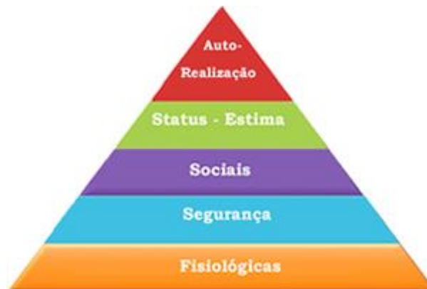
Figura 1 - Pirâmide de Maslow