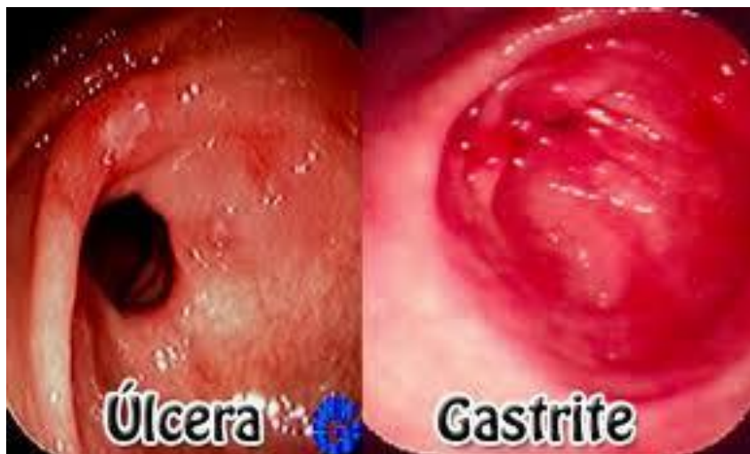
Figura 1: Úlcera e Gastrite. Portal da Nutrição e Saúde

Gastrite atrófica é mais prevalente em idosos, também está associada com a infecção do H. pylori e é caracterizada pela perda de glândulas na mucosa gástrica. Pode estar associada com hipo ou acloridria, e consequente comprometimento da absorção de minerais e vitaminas. 13 Outra causa de atrofia da mucosa gástrica, não associada com a infecção do H. pylori , é a anemia perniciosa, uma doença autoimune que provoca atrofia severa do corpo gástrico (mucosa oxíntica). Deficiência de cobalamina (vitamina B12) costuma ser uma das manifestações em ambas as formas de gastrite atrófica, embora elas possam ser assintomáticas. 4