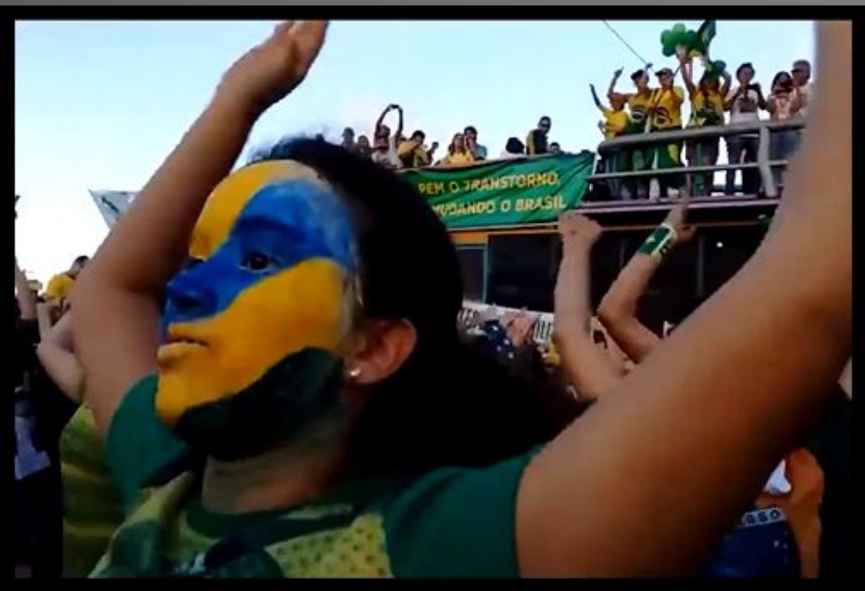
Fragmento da obra Pátria , 2019, de Bia Rodrigues

OBJETIVOS | Analisar e registrar a maneira com a qual os memes têm sido utilizado na história da arte contemporânea, além de, justificar sua presença como parte do mundo da arte.