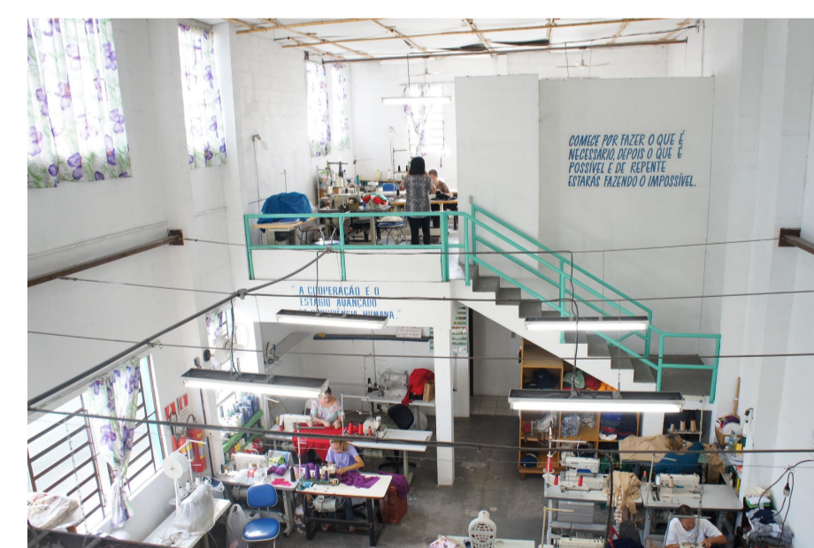
A parte interna da cooperativa UNIVENS.