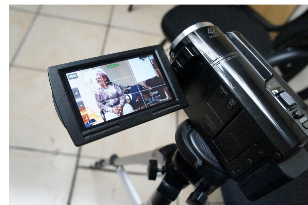
Registro da captação de uma das seis entrevistas individuais realizadas.