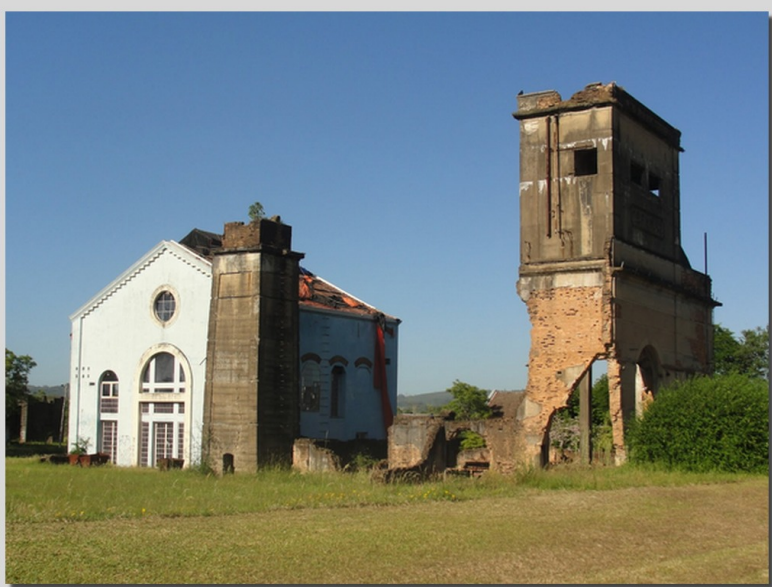
Museu do Carvão, em Arroio dos Ratos.

O intuito da pesquisa é discutir uma experiência em relação à construção e utilização do banco de dados na pesquisa histórica. A partir da utilização do programa Access (pertencente ao pacote Office), o banco de dados produzido pela pesquisa teve como objetivo a sistematização de documentos pertencentes ao Museu Estadual do Carvão, em Arroio dos Ratos, referente à imigração de trabalhadores europeus para as minas de carvão da região de São Jerônimo durante a década de 1940.