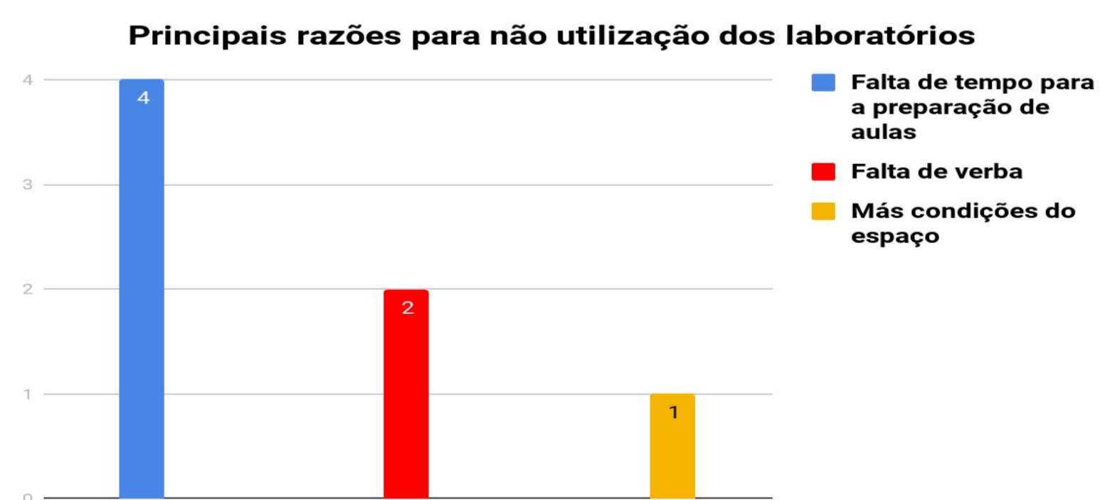
Figura 3 – Principais razões para a não utilização dos laboratório nas escolas públicas de Porto Alegre.