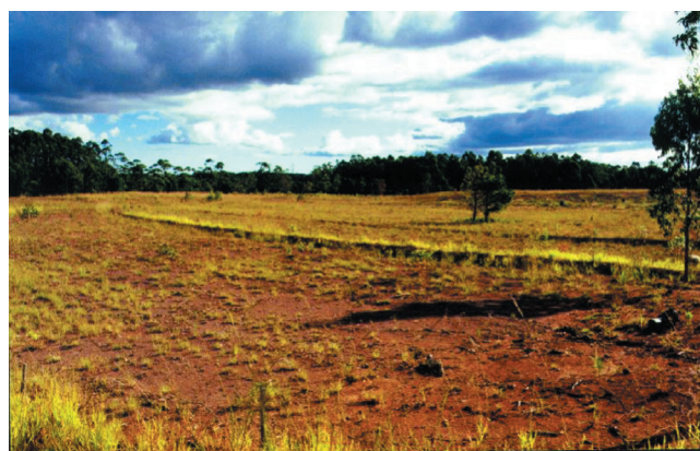
Figura 4 - Vista geral de área já recuperada da cava de mina de carvão (mineração de grande porte). Pode-se ter a idéia do nível de exigência quanto à qualidade final do trabalho de recuperação da área, o que reflete em benefícios à comunidade diretamente afetada.