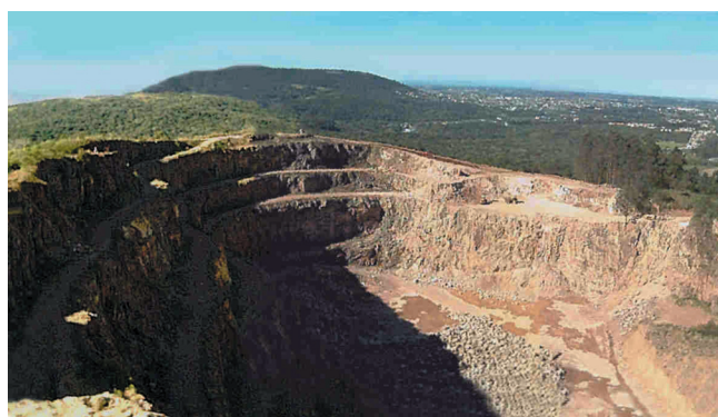
Figura 3 - Vista geral de cava de pedreira (mineração de médio porte), observa-se que o nível de impacto é menor que o da mina de carvão, porém existe o mesmo nível de exigência de recuperação; alternativas de utilização futura do local devem entrar em negociação envolvendo a participação do poder público e a comunidade.