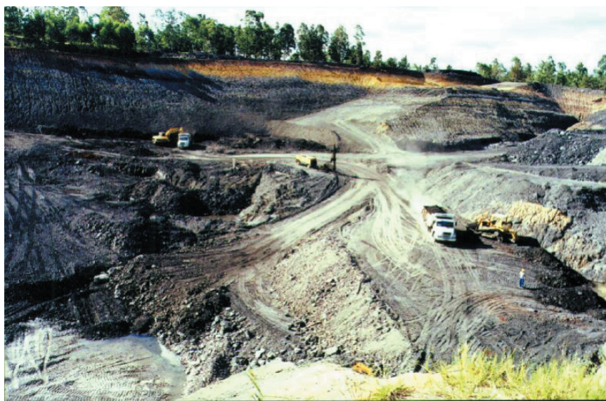
Figura 2 - Vista geral de cava de mina de carvão (mineração de grande porte).