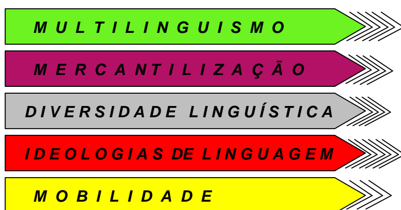
FIGURA 3 CATEGORIAS INICIAIS DE INDEXAÇÃO

categorias. Em termos de categorias, eu tinha um ponto de partida. Com base nas perguntas e nos objetivos da pesquisa, delineei categorias amplas relacionadas ao que me interessava encontrar nos dados. Essas categorias iniciais eram amplas o suficiente para que eu não gerasse um número inadministrável de categorias e também amplas o suficiente para me permitir refiná-las conforme os dados mostrassem necessário. A figura 3, abaixo, ilustra as categorias que foram o ponto de partida da indexação.