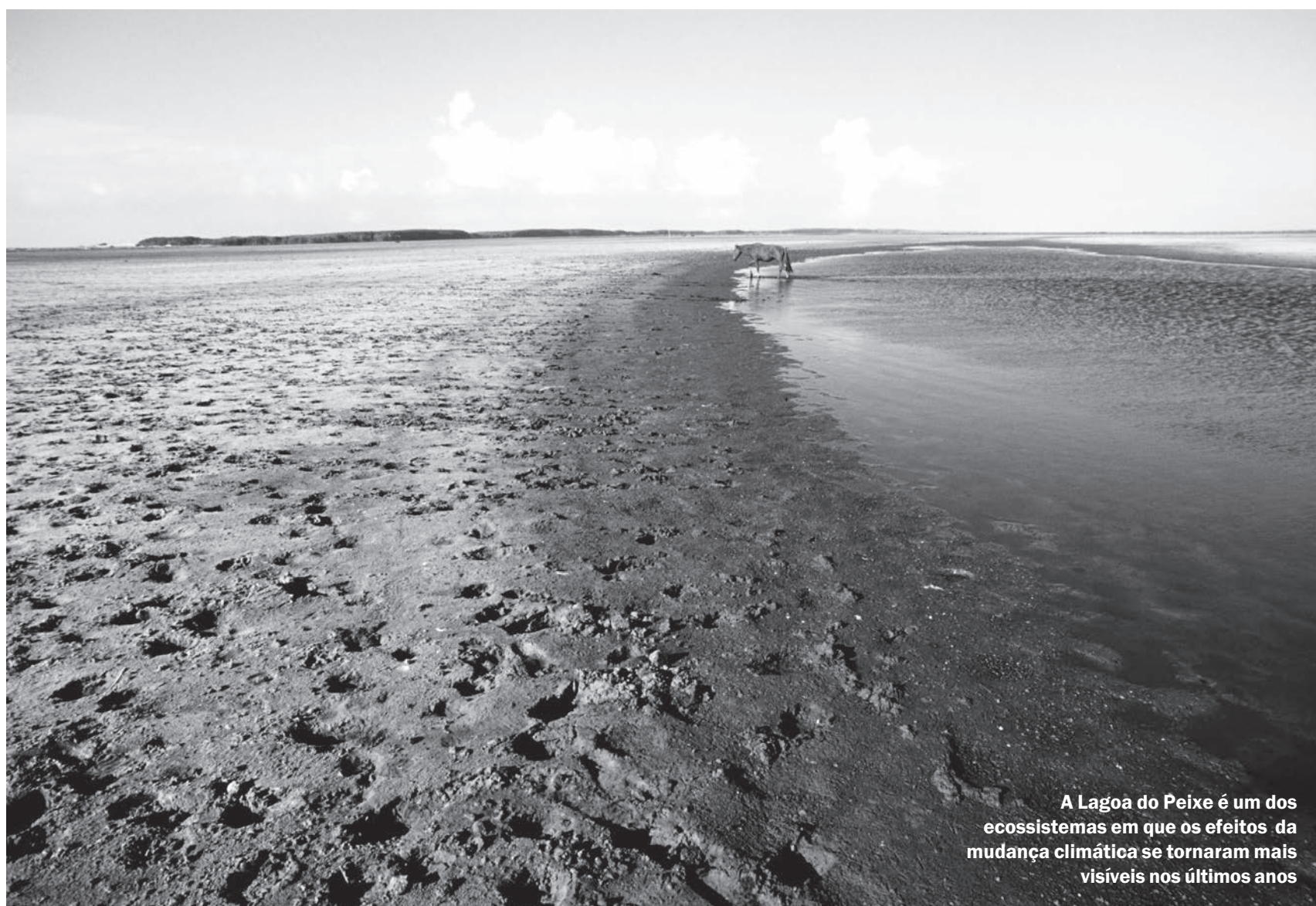
A Lagoa do Peixe é um dos ecossistemas em que os efeitos da mudança climática se tornaram mais visíveis nos últimos anos

Paula Vieira, estudante do 3º semestre de Jornalismo da Fabico — Especial para o JU