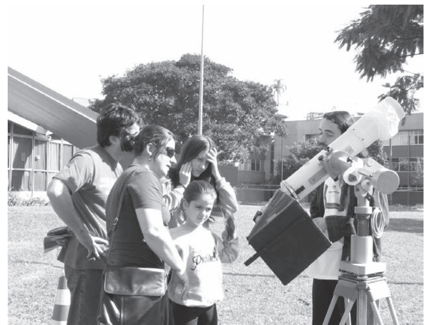
O Portas Abertas reuniu jovens de todas as idades em atividades oferecidas nos quatro campi e nas 29 Unidades Acadêmicas da UFRGS. No alto, grupo visita as instalações da Rádio. Acima, família participa do projeto de observação do céu desenvolvido no pátio do Planetário José Baptista Pereira, auxiliada por um monitor.