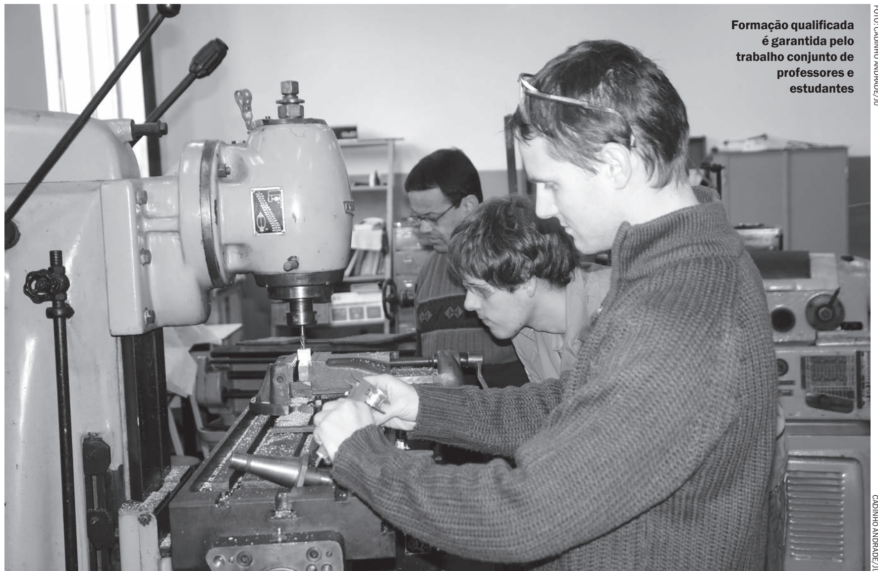
Formação qualificada é garantida pelo trabalho conjunto de professores e estudantes

São as empresas de grande porte (mais de 500 funcionários) que empregam a maioria dos engenheiros: o percentual é de 51,8%, em números absolutos. Na contagem relativa, considerando o número de engenheiros versus o número total de colabora-