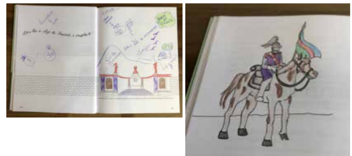
Páginas dos livros usados pelo casal, respectivamente Cláudia e Carlos.