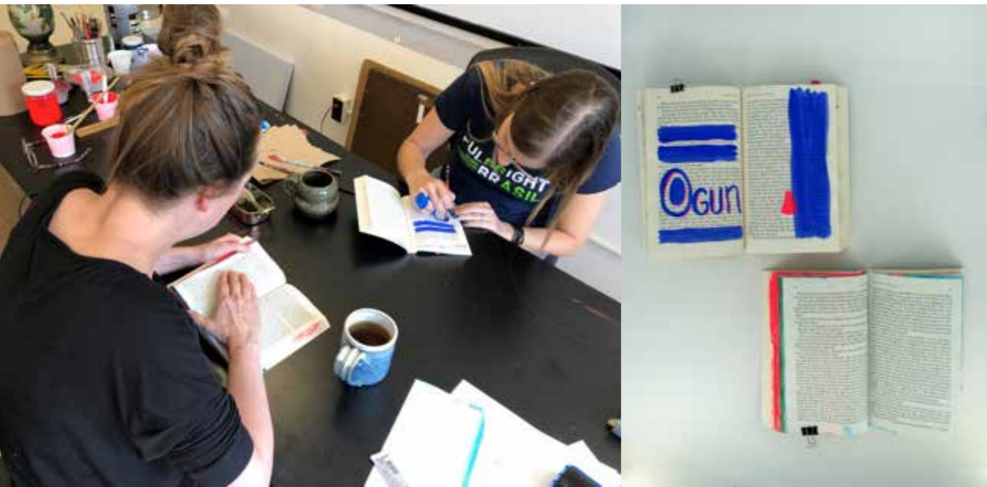
Figura 3 - Sessão de leitura e resultado da intervenção ao lado.