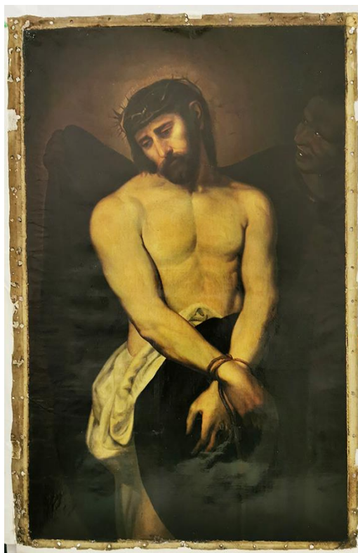
Figura 1. Ecce Homo , sem data. Óleo sobre tela, 116 x 76 cm. Coleção Arquidiocese de Porto Alegre, RS.

Destacaremos, a seguir, aspectos pontuais sobre algumas das obras expostas, mas ressaltando que, sendo essa uma exposição da qual seria difícil destacar individualidades, visto sua importância como conjunto, algumas peças apresentam questionamentos e problemas que exigiram algumas opções de curadoria.