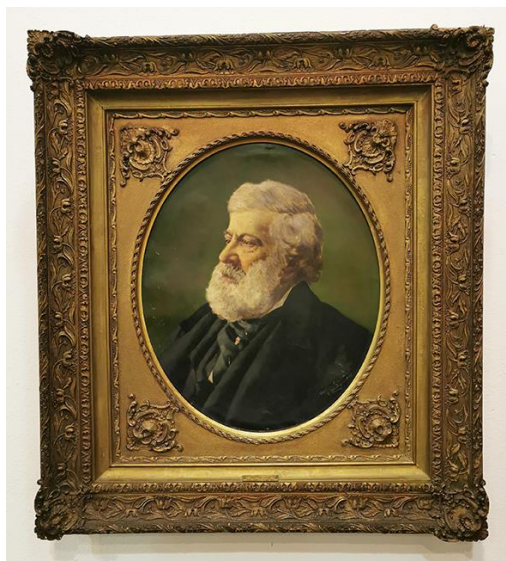
Figura 7. CERVÁSIO, Vicente. Retrato do Barão de Santo Ângelo, c. 1929. Óleo sobre fotografia, 50 x 60 cm. Museu Júlio de Castilhos, RS.

O terceiro retrato [Figura 7], uma fotografia pintada à óleo, é de autoria de Vicente Cervásio xv (? – ?). É um retrato notável pela força do exibido aqui, provavelmente, um homem com mais de 70 anos, mas com um brilho intenso no olhar e uma afirmativa presença.