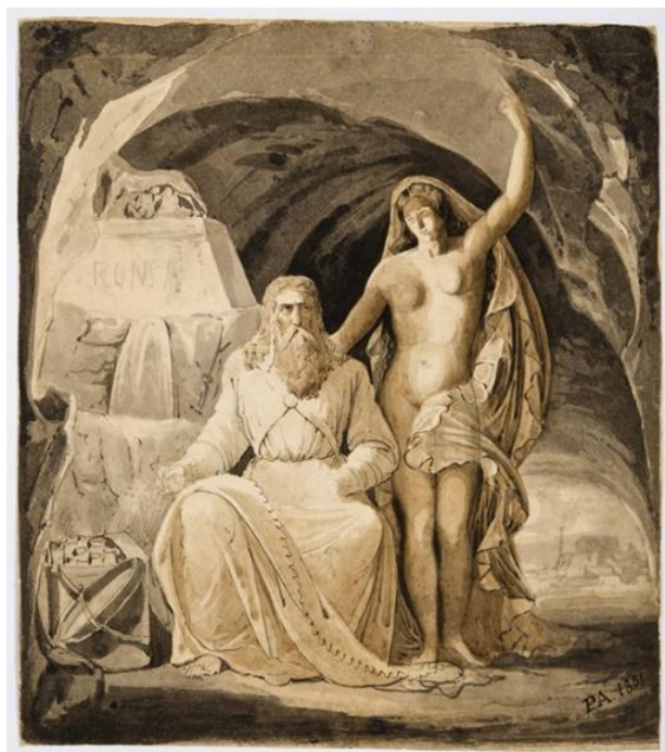
Figura 3. Estudo para painel decorativo , 1851. Aquarela sobre papel, 25 x 22 cm. Acervo Museu de Arte do Rio Grande do Sul Ado Malagoli.

O Estudo para painel decorativo x [Imagem 3], datado de 1851, foi classificado no grupo dos Estudos para Decoração , por entendermos que suas características combinam mais com uma decoração alegórica parietal do que com uma pintura autônoma (talvez, mesmo que remotamente, poderíamos aventar a possibilidade de ser um estudo para uma ilustração). De temática indefinida, com duas figuras distintas — um homem velho com toga e uma figura feminina jovem, apontando para o alto — em uma gruta, elas têm, à esquerda do espectador, a escultura da Loba Romana do Capitólio, com sua identificação na base. A gestualidade de ambas as personagens indica claramente uma narrativa alegórica não identificada. Seus elementos, apesar da relativa facilidade de identificação, dependem ainda de uma interpretação plausível. Rafael Cardoso (2014, p. 189) avanta a possibilidade de a figura masculina ser a imagem de algum historiador romano, talvez Suetônio, mas esclarece que “essa identificação exigiria maior pesquisa iconográfica”.