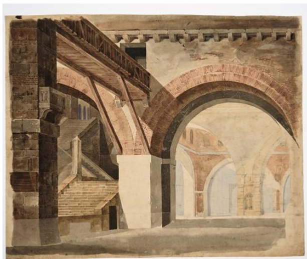
Figura 4. Croquis para um cenário , sem data. Aquarela sobre papel, 35,5 x 44 cm. Acervo Museu de Arte do Rio Grande do Sul Ado Malagoli.

O Croquis para um cenário xi [Imagem 4] é uma das peças mais conhecidas da coleção e também carece de identificação precisa. Com um pouco de esforço, podemos ver aqui um cárcere, de clara inspiração piranesiana pela perspectiva acentuada dos arcos, das escadarias vertiginosas e da passarela, embora o fundo, após o grande arco, tenha uma decoração incoerente com o espaço. Se for, como diz o registro de aquisição, um croqui para um cenário, qual seria a peça? Letícia Squeff (2004, p. 96) informa que Porto-Alegre projetou cenários para duas peças de Domingos José Gonçalves de Magalhães. Em nota, ela informa, baseada em De Paranhos Antunes, que as peças foram Antônio José, ou o Poeta e a Inquisição (1838) e Olgiato (1389). Das duas, apenas a primeira tem uma cena de cárcere, conforme podemos ler na rubrica indicativa: