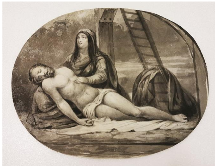
Figura 2. Descida da cruz , sem data. Aquarela sobre papel, 17 x 22 cm. Acervo Museu Júlio de Castilhos, RS.

A imponente tela é praticamente desconhecida do público e dos estudiosos da obra do artista e sua inclusão nesta exposição tem, principalmente, o intuito de torná-la visível e promover estudos sobre sua origem e autoria. O ignorado Ecce Homo , ao lado da celeberrima aquarela Selva Brasileira ii (coleção MNBA), aportam informações importantes sobre seu autor e seu tempo: na pintura religiosa constatamos a manutenção do mecenato da Igreja, ainda potente no século XIX, e o apreço do artista pelos grandes temas, naturais na Pintura de História, o ápice da formação acadêmica e, na pequena aquarela, a fundamental preocupação com a construção de uma identidade nacional, aqui pelo viés da paisagem “selvagem”, romantizada, dramática e fascinante até os dias de hoje.