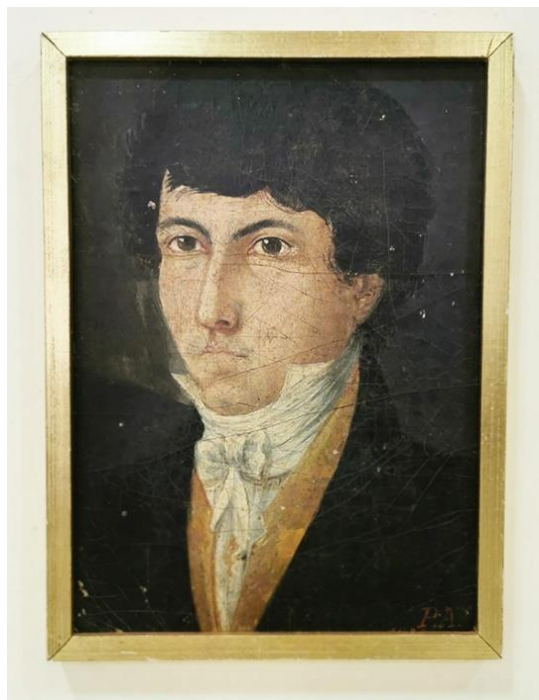
Figura 6. Autorretrato , de Manuel de Araújo Porto-Alegre, 1823. Óleo sobre painel, 29 x 23 cm. Acervo Museu Júlio de Castilhos, RS.

Do conjunto intitulado Retratos , o mais importante é o Autorretrato xiii [Figura 6], datado de 1823, quando o artista teria por volta de 17 anos, se considerarmos como efetiva a datação na tela. Trata-se de um retrato pintado quase à régua, isto é, os traços fisionômicos são captados com um rigor que beira a rudeza. Não há efetivamente muita habilidade na pintura, ao contrário, ela é rígida no desenho, simplista na modelagem da aparência do retratado e de suas roupas, e o colorido não se faz destacar. Talvez esse juízo, fundado na aparência atual da pintura, seja injusto, pois estamos fazendo-o a partir de uma tela que, em algum momento mais propício, deve ter tido um melhor aspecto. Efeitos talvez de uma restauração pouco feliz ou de um desgaste natural, a pintura certamente não recomenda seu autor, com a notável exceção de ser obra de um jovem aspirante à profissão de artista, com formação ainda incipiente. Há ainda no acervo do Museu Júlio de Castilhos um outro retrato, uma fotografia pintada do retrato feito por Pedro Américo, xiv em 1869, quando o artista teria por volta de 50 anos.