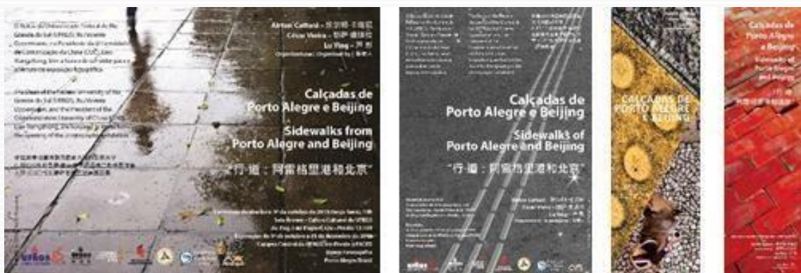
Figura 8 – Convites, cartaz e marcador de páginas da exposição em Porto Alegre

Os relatos de visitantes, recolhidos por ocasião das inaugurações das exposições, permitiram confirmar o que já fora percebido por ocasião da exposição de 2007: a percepção deste componente do mobiliário urbano, registrado em exposição e livro, fez com que os leitores/espectadores fossem estimulados e provocados a perceber seus trajetos cotidianos de uma nova maneira mais atenta; foram provocados a perceber que a mais banal das superfícies pode conter padrões estético/formais expressivos, passando a ter