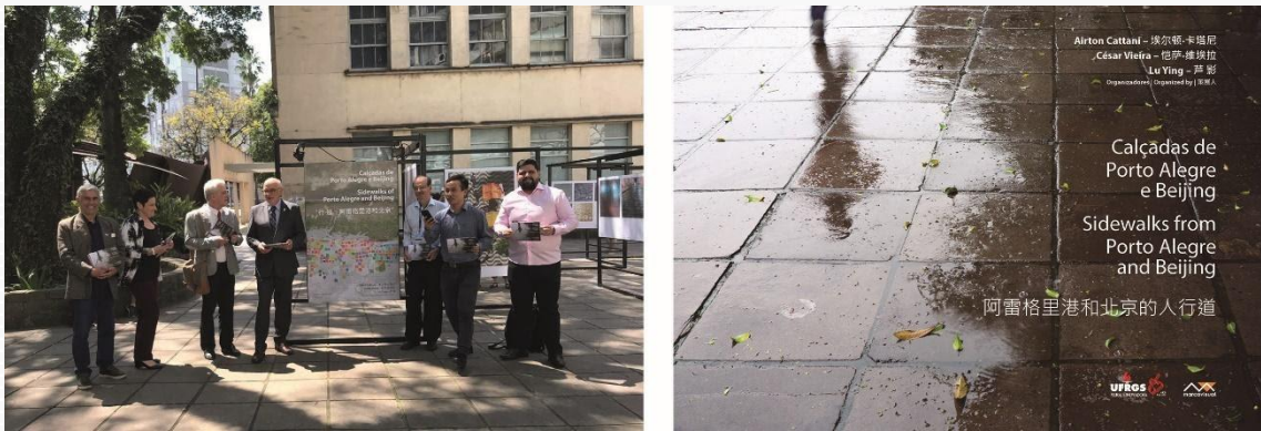
Figura 3 – Abertura da exposição em Porto Alegre e capa do livro.