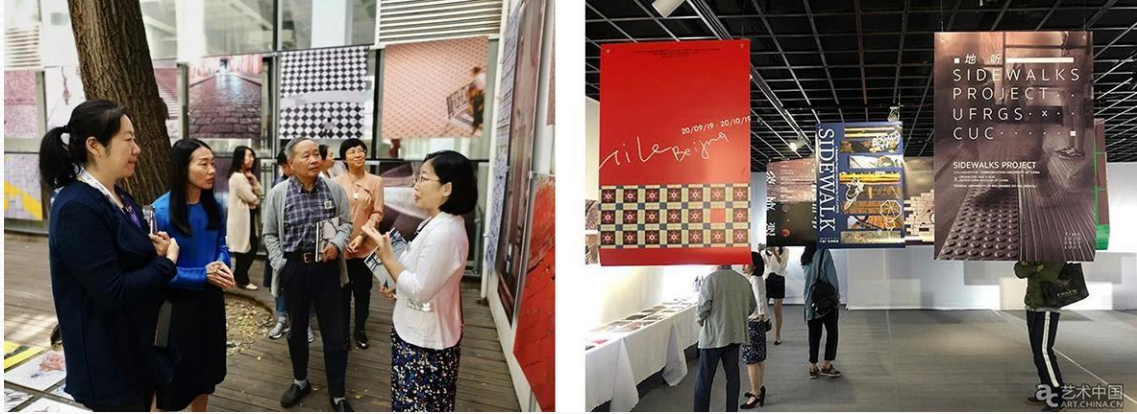
Figura 2 – Aspectos da exposição em Beijing.