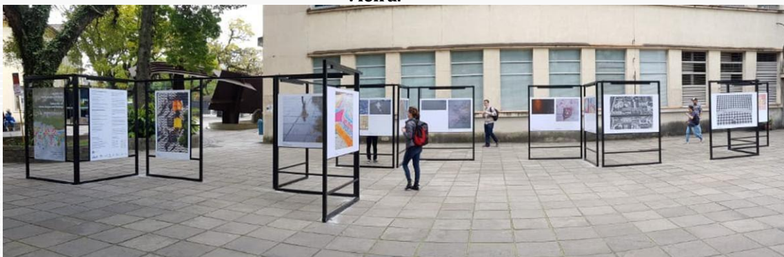
Figura 4 – Aspecto geral da exposição em Porto Alegre.