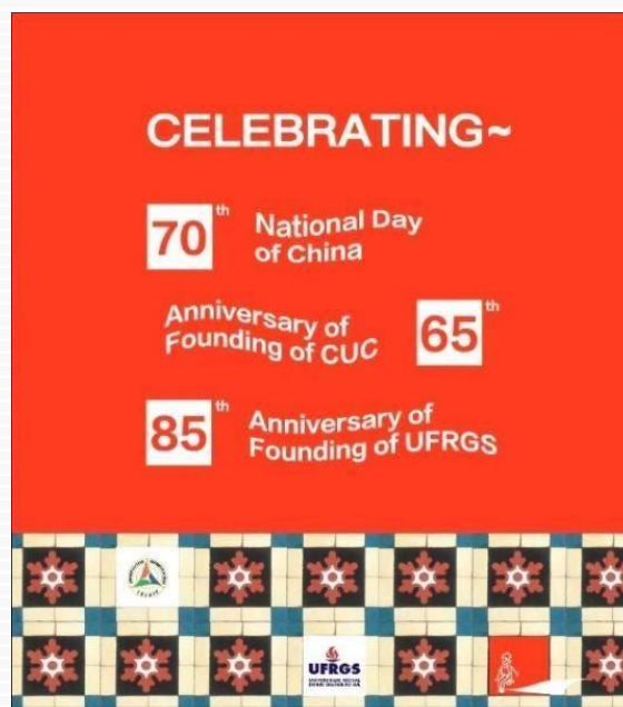
Figura 5 – Cartaz comemorativo da exposição em Beijing.