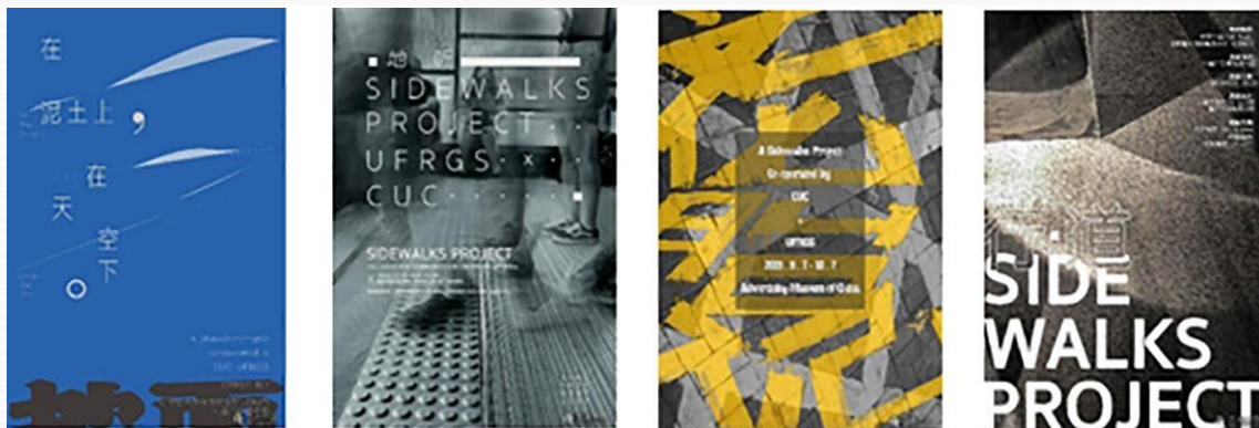
Figura 7 – Cartazes da exposição em Beijing

edições dos livros permitiram comparar estratégias projetuais, abordagens estéticas levadas a efeito, sensibilidades, prioridades e valores, para perceber as peculiaridades das abordagens. Essas particularidades contribuíram de forma significativa para o processo de amadurecimento e construção de uma nova sensibilidade. São campos de provocação e experimentações de estratégias visuais, como pode ser visto nas Figuras 7 e 8 .