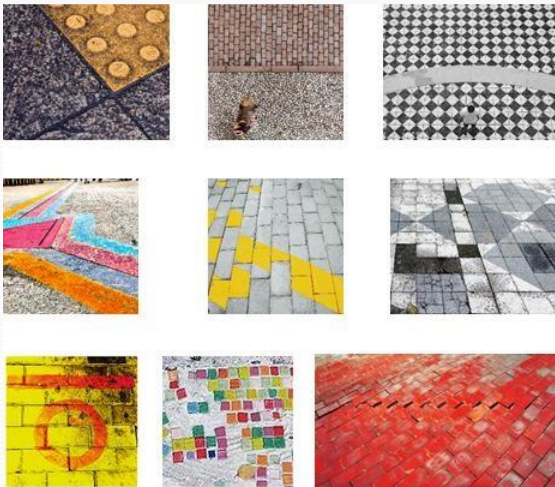
Figura 6 – Fotografias de calçadas de Porto Alegre (acima) e Beijing (abaixo).

evidência questões relativas ao território individual e coletivo, fomentando o diálogo intercultural entre países de culturas tão diversas. Ver uma calçada de sua cidade ao lado de outra de uma cidade do outro lado do globo terrestre, perceber diferenças de valores e conseqüentes sutilezas nas estratégias visuais, permitiram aos observadores – tanto aqueles que participaram do processo quanto aos simples espectadores – perceber as oportunidades oferecidas por uma globalização de uma maneira efetiva, não mais apenas no plano das ideias ou de maneira abstrata ( Figura 6 ).