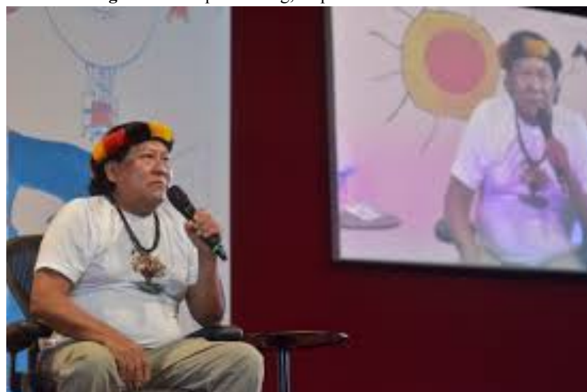
Figura 6 - Deep Listening, Xapiri e a escuta dos sonhos