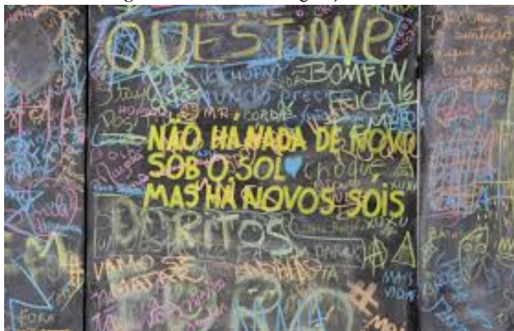
Figura 1 - Oficina de Imaginação Política