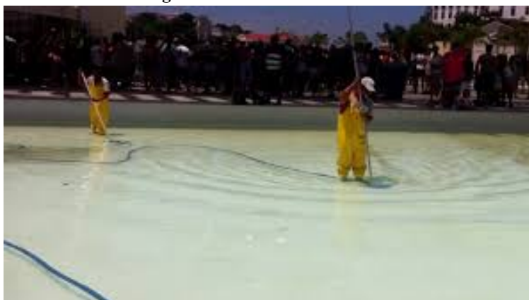
Figura 3 - Territórios Sensíveis