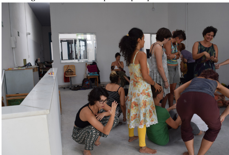
Figura 2 - Vocabulário político para processos estéticos