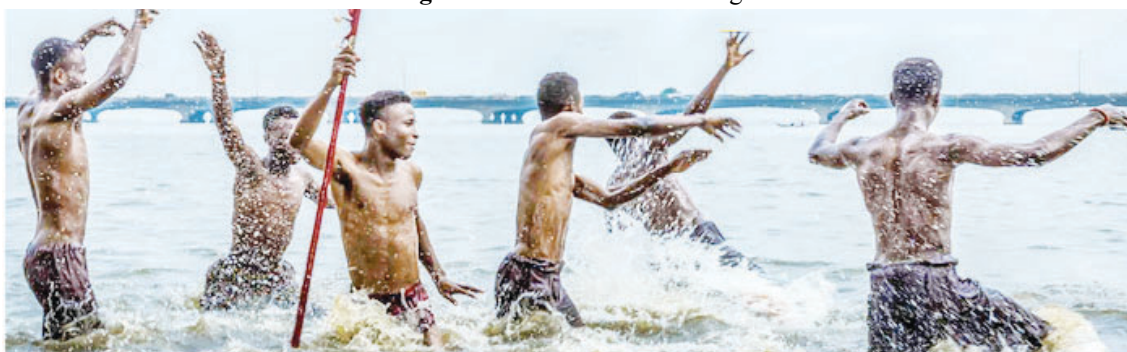
Figura 4 - KinoDanceGathering