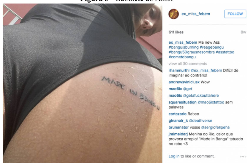
Figura 5 - Gabinete do Amor