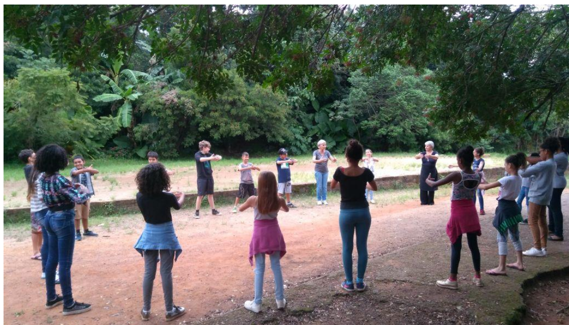
Foto da equipe da escola.