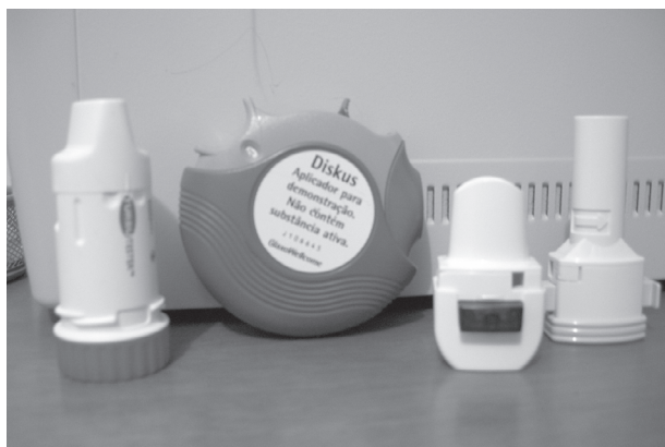
Figura 2 – Inaladores de pó seco.

O espaçador diminui, em termos absolutos e relativos, a quantidade da droga que ficaria nas vias aéreas superiores e seria deglutida. O espaçador diminui, portanto, a dose total tomada pelo paciente e a biodisponibilidade sistêmica oral e, dessa forma, otimiza a terapia inalatória, reduzindo os efeitos sistêmicos (2, 47).