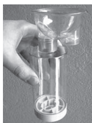
Figura 4 – Espaçador de máscara.

Algumas características individuais do dispositivo podem influenciar na deposição pulmonar da medicação: volume, adaptador, válvula, carga eletrostática, tipo de espaçador (caseiro x manufaturado) (17).