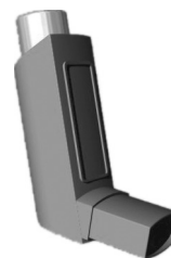
Figura 3 – Inalador pressurizado dosimetrado.