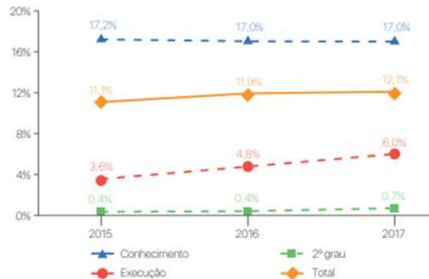
Figura 1 – Índice de Conciliações 2018 (ano-base de 2017)

Apesar das estatísticas concederem uma paridade de tratamento aos modelos de conciliação e mediação, que possuem características distintas 38 mas surgem nos dados estatísticos como se de um único instituto se tratasse, ainda assim é indiscutível os excelentes resultados obtidos pela implementação da política pública de resolução de conflitos.