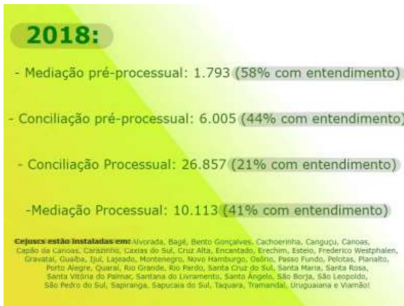
Figura 3 – Índices de Entendimento nos CEJUSCs do TJRS (ano-base 2018)

A leitura do quadro acima permite afirmar que o Rio Grande do Sul encontra-se bastante mais avançado relativamente à média nacional obtida pelo conjunto de todos os estados no ano de 2017. Felizmente, para maior acuidade deste trabalho, o TJRS providencia resultados individualizados tanto para a mediação como a conciliação. É