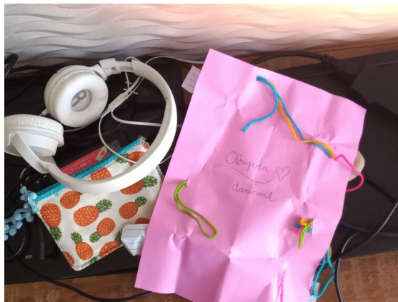
Imagens 1 e 2: