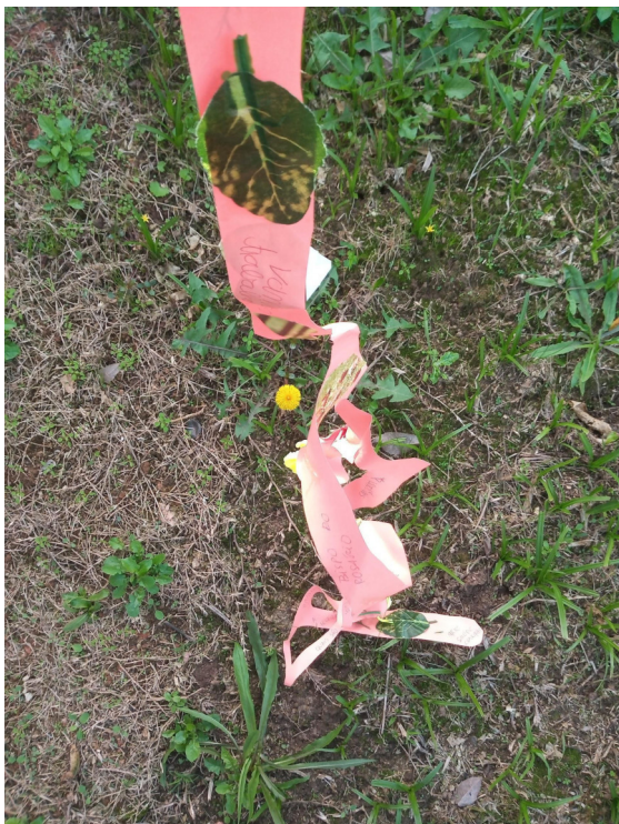
Imagens 9 e 10: Fotografias de autoria de Helena Estrela Noal Peres

A pergunta seguirá reverberando, afinal, nem todo currículo é feito de poesia e tampouco uma pandemia nos faz escritapoesia : como tornar-se professora das artesanias em meio a tanta tecnologia e com a covid-19?