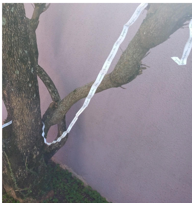
Imagens 6, 7 e 8: Fotografias de autoria de Helena Estrela Noal Peres