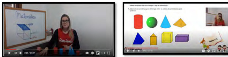
Figura 1 e 2 - Organização da primeira videoaula.