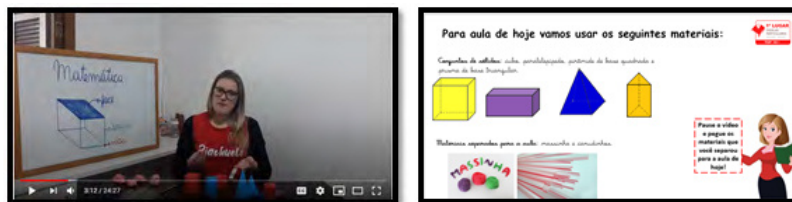
Figura 3 e 4 - Organização da segunda videoaula.

É por isso que a organização desta proposta buscou superar as comparações espontâneas para chegar na aproximação do conhecimento científico dos conceitos. Todavia, pode-se perceber que a primeira videoaula estava muito expositiva, e que poderia ter sido sugerido que as crianças montassem os sólidos geométricos a partir de modelos distribuídos, ou, na impossibilidade de uma impressão, tentar encontrar objetos em sua casa que fossem similares ao conjunto de sólidos geométricos. Por isso, ao propor, na segunda videoaula, que as crianças construíssem os sólidos através de suas arestas, foi solicitado material preparatório: canudinhos, palitos de picolé ou de dente; massinha de modelar ou massinha de modelar caseira. Para essa segunda aula, foram utilizados esses instrumentos e o powerpoint explicativo como mostram as figuras três e quatro.