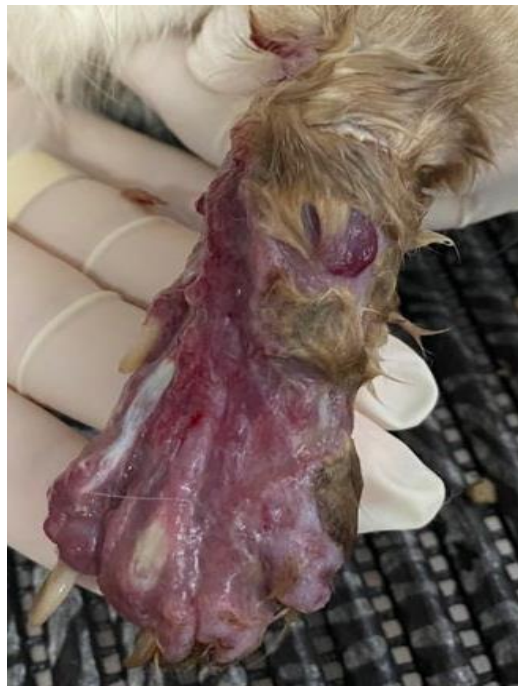
Figura 1 – Lesão erodo-ulcerativas na região no membro anterior esquerdo com exposição de tecidos subjacentes no membro.

gatos (MADRID et al. , 2012a), placas coalescentes (SCHUBACH et al. , 2004), abscessos, celulites (LLORET et al. , 2013), extensas zonas de necrose que pode expor tecidos subjacentes como músculos e ossos (Figura 1) (LLORET et al. , 2013; SCHUBACH et al. , 2004). O envolvimento linfático pode não ser clinicamente evidente, mas pode ser demonstrado histologicamente, tanto em biópsias quanto em amostras de necropsia (LLORET et al. , 2013), assim a linfangite e linfadenite regional podem ser observadas (MIRANDA et al. , 2018b; SCHUBACH et al. , 2004). Nódulos e úlceras cutâneas são os sinais dermatológicos mais comumente observados (BOECHAT et al. , 2018). Conforme a distribuição das lesões os gatos são alocados em três grupos: L1 (lesão cutâneas em um local), L2 (lesões cutâneas em dois locais não contíguos) e L3 (lesões cutâneas em três ou mais locais não adjacentes) (SCHUBACH et al. , 2004). A distribuição das lesões é mais comumente é superior a três lesões não coalescentes (CHAVES et al. , 2012; PEREIRA et al. , 2010; NAKASU et al. , 2020).