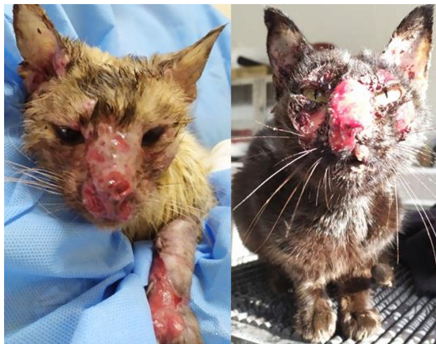
Figura 2 – Gatos com lesões localizadas no nariz e na mucosa nasal, com característico granuloma nasal de esporotricose.

presença de lesão localizada no nariz ou na mucosa nasal (Figura 2) (SCHUBACH et al. , 2004). Em alguns casos, precedendo o aparecimento das lesões cutâneas (SCHUBACH et al. , 2004). Os sinais respiratórios e lesões da mucosa nasal são associados à falha no tratamento antifúngico (SOUZA et al. , 2018) e a taxa de mortalidade (PEREIRA et al. , 2010), sendo a falta de um rico suprimento de sangue nasal uma possível explicação à dificuldade de cicatrização de lesões nesse sítio anatômico (SOUZA et al. , 2018).