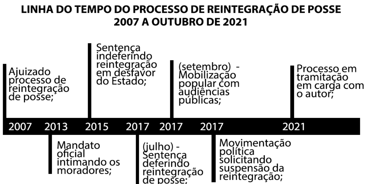
Figura 9: Linha do tempo do processo de reintegração de posse.