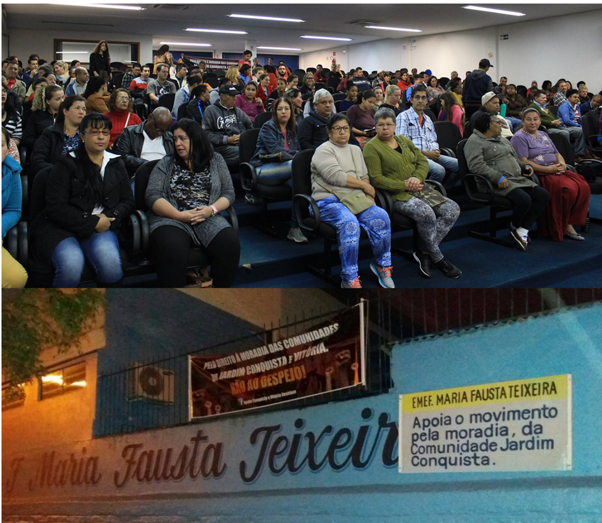
Imagem superior: Audiência Pública na Câmara Municipal, setembro de 2017; Imagem inferior: Apoio da escola pública que atende as crianças da região.

Tal mobilização, também contribuiu para a organização social dos moradores. Visto que muitos deles não tinham nem ciência da existência do processo judicial. Tal fato ocorre porque alguns moradores mais novos quando adquirem o terreno nem ficam sabendo da existência do processo. Além de que, no momento, não existe um advogado que centraliza e/ou acompanha o processo, o que ocorre é que ao longo dos anos diversos advogados entraram com representações, defendendo diferentes interesses, organizações e políticos.