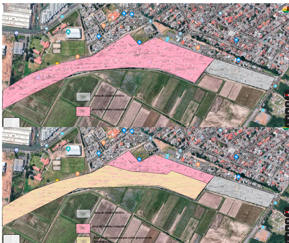
Figura 11: Delimitação do bairro Jardim Conquista.

Imagem superior: Delimitação do bairro Jardim Conquista (Rosa)