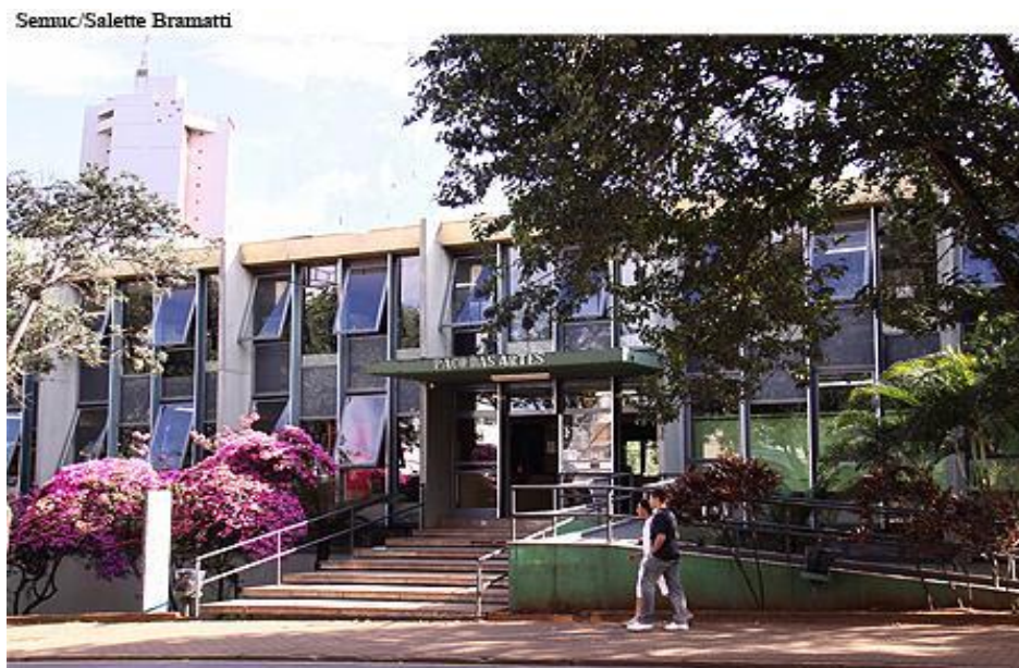
Figura 2 – Biblioteca Pública Municipal Sandálio dos Santos