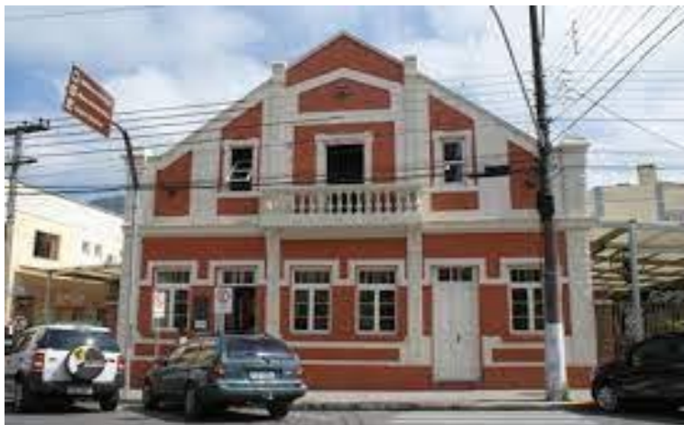
Figura 4 – Biblioteca Pública Municipal Fernandes Bastos