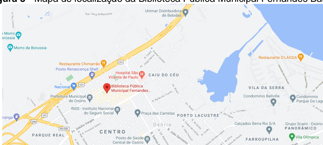
Figura 3 - Mapa de localização da Biblioteca Pública Municipal Fernandes Bastos

A cidade de Osório está localizada na microrregião do litoral setentrional do Estado do Rio Grande do Sul. O mapa a seguir apresenta a posição geográfica de localização da biblioteca na cidade de Osório. (Figura 3).