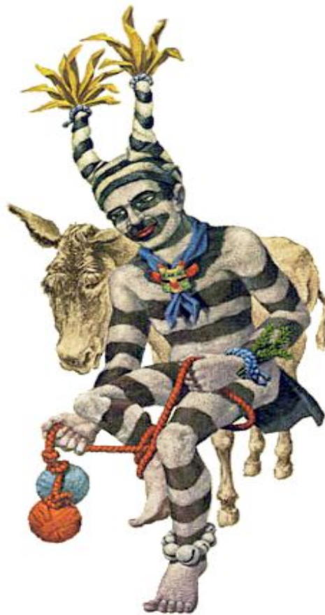
Heyoka - Trickster

ensinamentos ao Povo através do riso e dos contrários. Este Trickster Sagrado faz com que você pense por você mesmo e chegue às suas próprias conclusões, levando-o a questionar se aquilo que outros dizem ou fazem é verdadeiramente correto”. As características de trapaceiro e brincalhão são justamente as ferramentas de heyokah que procura desarticular certezas para abrir possibilidades a outras reflexões.