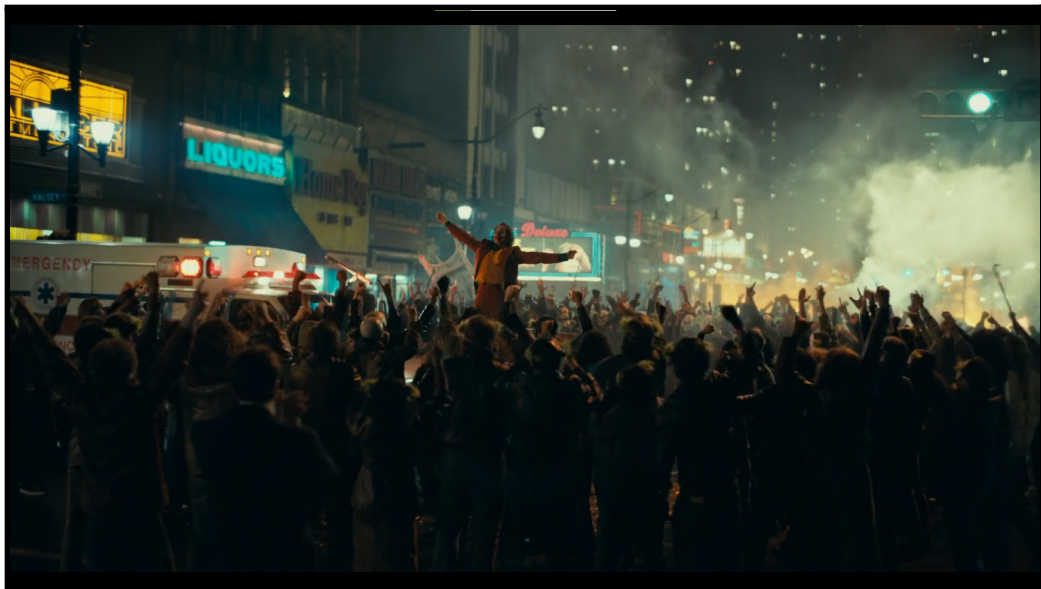
Joker e os manifestantes

Joker neste ato, está devolvendo as agressões e abusos sofridos desde a infância, assim como as violências psicológicas por ser um estranho, um esquisito aos olhos da sociedade que se diz certa, normal e bem sucedida. Mas Ele não está sozinho, pois os excluídos, desamparados e estranhos de Gotham irão às ruas para corroborar o que Joker disse e fez.