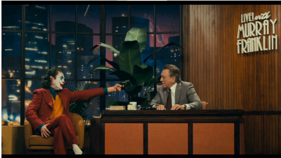
Joker no programa de TV

Joker neste ato, está devolvendo as agressões e abusos sofridos desde a infância, assim como as violências psicológicas por ser um estranho, um esquisito aos olhos da sociedade que se diz certa, normal e bem sucedida. Mas Ele não está sozinho, pois os excluídos, desamparados e estranhos de Gotham irão às ruas para corroborar o que Joker disse e fez.