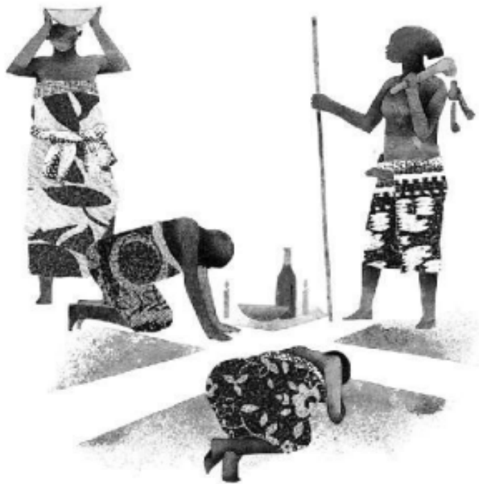
Exu - Legba - Eleguá - Bará

Ofereceu a Exu pedaços de carne de bode. Como a comida estava muito apimentada, Exu ficou com muita sede. Exu procurava água para matar a sede implacável, mas água não havia, estava tudo seco no lugar. Exu então abriu a torneira da chuva. Ela jorrou como nunca, fazendo com que o povo se regozijasse com Alumã. As colheitas estavam salvas! Mas a chuva não cessou.