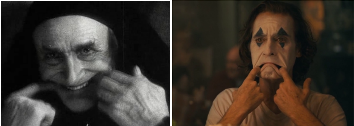
Em O Homem que Ri , Barkilphedro simulando um sorriso e em Joker , Arthur se maquiando

Essa vingança é arranjada por Barkilphedro, o bobo da corte, mas já na cena inicial do filme a descrição que lhe é dada revela outros atributos deste bufão que não são exatamente o humor, quando diz que “todas suas piadas eram cruéis e todos seus sorrisos eram falsos”.