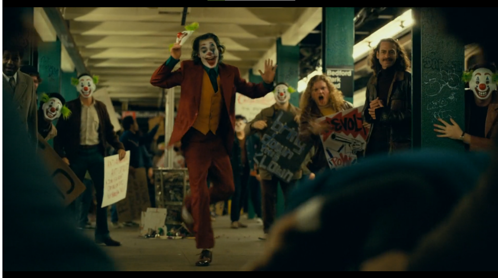
Joker divertindo-se com o caos

Durante o programa, ele irá assumir os assassinatos que cometeu e confrontar o discurso de cidadão de bem e moralista que Murray quer lhe impor. Explica que não é o tipo de palhaço que começa algum movimento, que matou os três homens de Wall Street porque eles eram horríveis, que atualmente todas as pessoas são horríveis e que só isso já faz qualquer um enlouquecer.