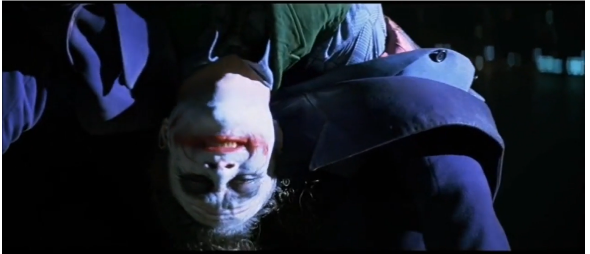
Joker sendo capturado

normas e roteiros, pois diz que foram justamente as normas e planejamentos que o deixaram tão estranho, uma denúncia e uma provocação de que não há “normalidade” possível neste mundo e o quanto todos somos estranhos. Ao final, ele deixa as estruturas abaladas, as fronteiras que definem o bem e o mal são transgredidas. A tradicional maneira de ver e entender os papéis sociais são virados de cabeça para baixo, são subvertidos.