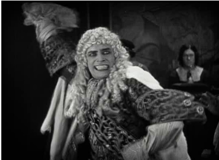
Gwynplaine na Câmara dos Comuns

denunciando a origem de seu estigma dizendo que foi o rei que o fez palhaço, gerando desordem por se opor às imposições da rainha e não se calar diante das violências que sofreu, em troca de um título de nobreza.