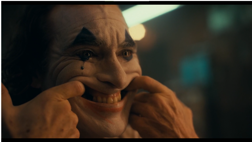
Arthur montando um sorriso no rosto para fazer uma cara feliz

Arthur é um sujeito que sub-vive em uma sociedade caracterizada pela desigualdade social e abismo econômico. A história vai evidenciar o glamour e riqueza financeira de um pequeno grupo de empresários e detentores de poder contrastando com o desamparo e as precárias condições de vida de uma grande parcela da população.