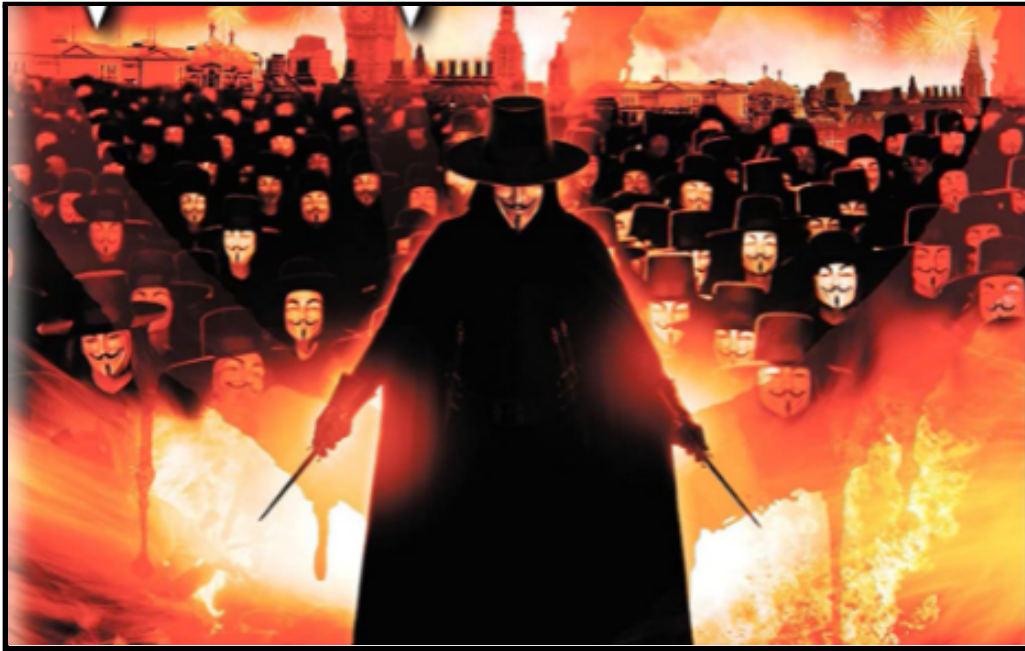
V e a população com a máscara de Guy Fawkes

Ao final, V consegue executar todas suas vinganças contra as pessoas que o prejudicaram e ainda destruir o símbolo do poder instituído, o Prédio do Parlamento (que abriga a Câmara dos Comuns e a Câmara dos Lordes) com a proposta de destruir símbolos opressores e possibilitar novos caminhos e opções de escolhas políticas e sociais à população.