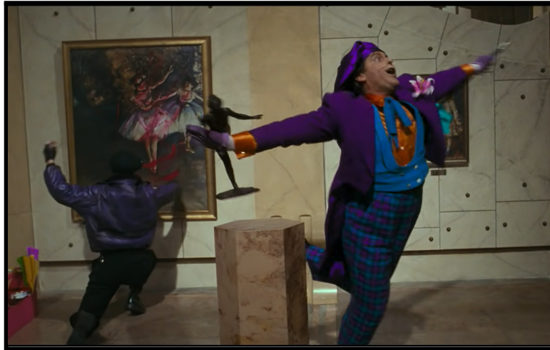
Joker no Museu

de maquiagem e outros produtos de beleza que irão desencadear reações alérgicas em quem os utiliza. As reações começam com uma gargalhada descontrolada, depois surge um sorriso desfigurado semelhante ao que ele tem e culmina com a morte da pessoa.