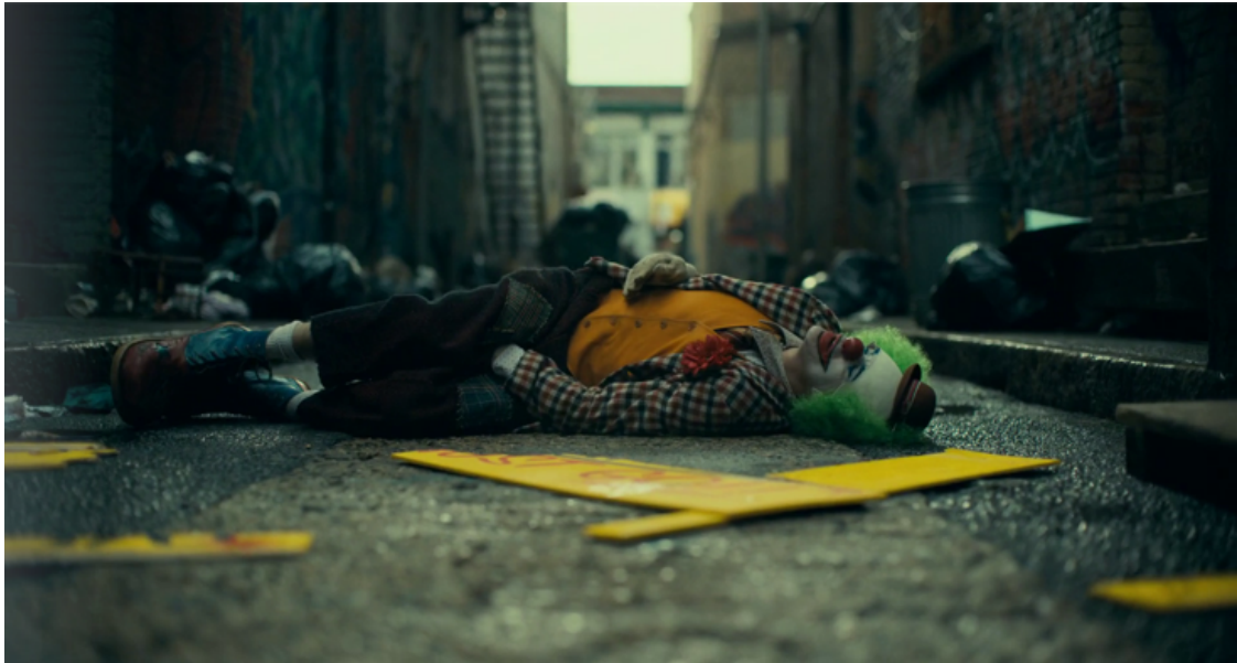
Arthur como o Palhaço Carnaval após ter sido espancado por um grupo de adolescentes

condição de saúde e também cuidar de sua mãe. Seu sonho é ser um comediante famoso e bem remunerado como Murray que tem seu próprio programa de TV.