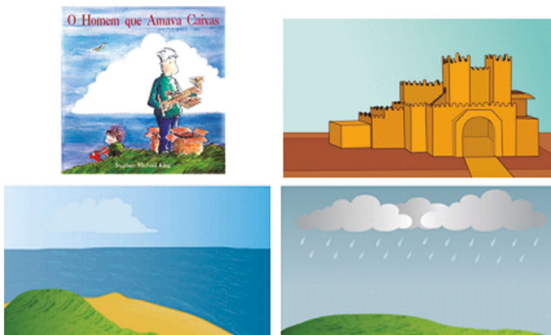
Figura 3: Cenários criados/adaptados

Fonte: O Homem que Amava Caixas , de Stephen Michael King (1997).