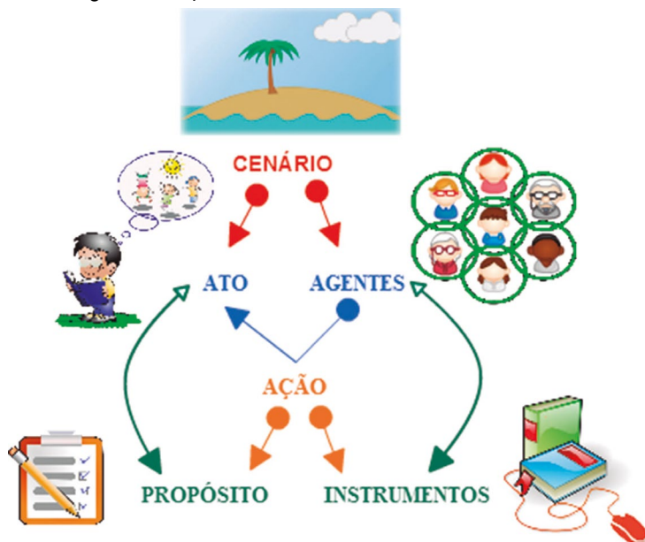
Figura 1: Diagrama do quinteto de Burke

signo, palavra e símbolo, em que a ação se produz mediadora, tornando-se essencial na compreensão do princípio da aprendizagem. Sendo que quanto maior for a complexidade da mediação no uso de instrumentos, mais complexas serão as ações da mediação simbólica (Sforni, 2004).