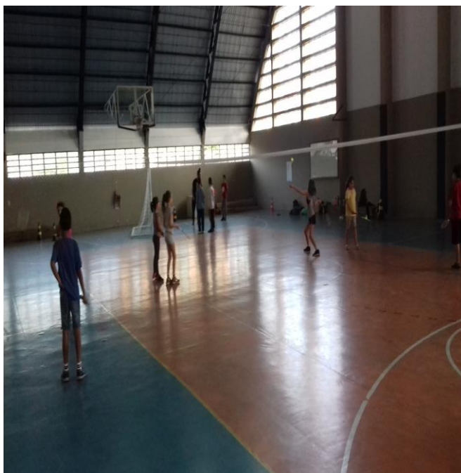
Figura 5: Preparação para uma das rodadas do campeonato