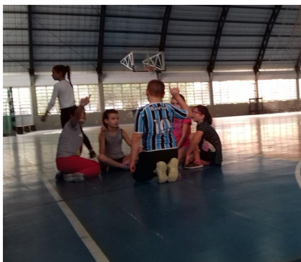
Figura 2: Reunião inicial das equipes

Na primeira aula, houve a explicação de todos os procedimentos específicos e particularidades que fazem parte do modelo. Os alunos foram divididos por nível de habilidade em três potes para o sorteio das equipes. Em seguida todos reuniram-se dentro das equipes para decidir o nome da mesma, a cor e quem seria o capitão. Essa dinâmica foi muito interessante, os praticantes realmente debateram para organizar todos esses aspectos. O cronograma de jogos foi estabelecido com a ajuda dos monitores, porém, todas as equipes tinham acesso a tabela do campeonato que ficava exposta no espaço onde aconteciam as aulas. A cada rodada duas equipes jogavam e a terceira realizava a arbitragem.