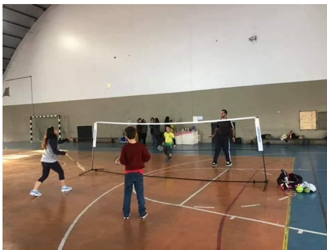
Figura 6: Desafio com os professores no evento culminante