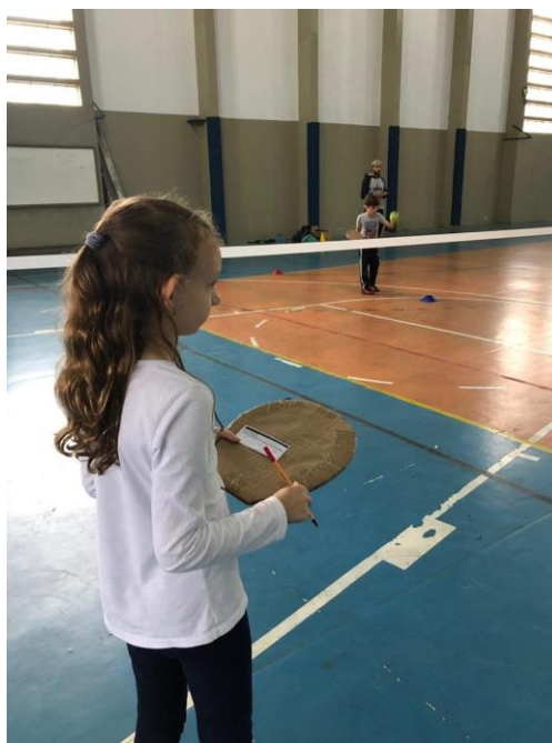
Figura 4: Papel de treinador

Alguns dos pais/responsáveis pelos alunos começaram a estranhar a metodologia que estava sendo utilizada durante as aulas. Uma das características do Sport Education é o registro de desempenho, com o praticante ocupando a função de treinador. Nessa situação, o aluno observa o colega de sua equipe jogando e vai fazendo o controle das ações em quadra, afim de avaliar a atuação e dar um retorno sobre a evolução do aprendizado. Ao observarem essa dinâmica, os pais/responsáveis questionaram seus filhos, por estarem parados fazendo anotações ao invés de estarem “correndo”, tendo em vista que se tratava de uma aula de esportes.