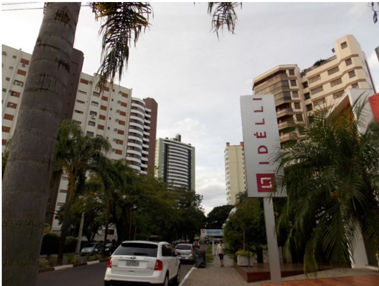
Figura 3 – Trecho da Av. Dr. Maurício Cardoso, com seus edifícios residenciais de alto padrão e estabelecimentos comerciais especializados.

Ademais, ao citarem detalhes e pequenas particularidades de símbolos presentes nessa paisagem, como beleza das fachadas e no interior das lojas, os frequentadores do lugar estão reproduzindo imaginário de padrão estético com o qual acostumaram-se a ver expressos pela mídia de massa. Muitas vezes sentem-se familiarizados com essas paisagens, que apesar de novas são similares a outras de alguma maneira já observadas. O julgamento que se faz da paisagem, desse modo, não deve ser percebido como uma manifestação autêntica, mas como resultado de um repertório de subjetividades intrinsecamente vinculadas às condições sociais de cada sujeito, seu volume de capital global (econômico, cultural, social e espacial), de acordo com o pensamento de Bourdieu (1983).