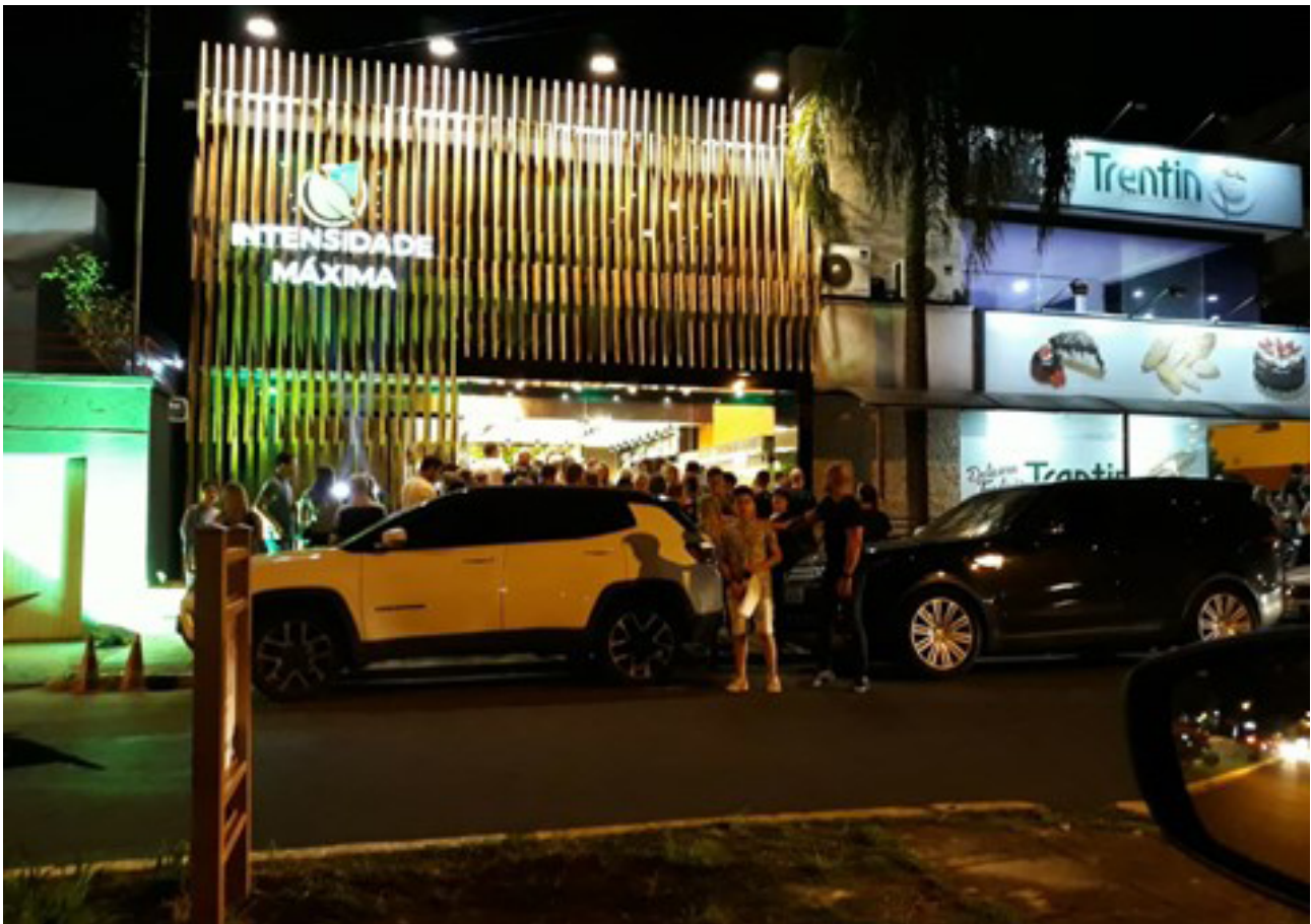
Figura 4 – Avenida Dr. Maurício Cardoso à noite.

À noite, sobretudo nos finais de semana, a Avenida está se tornando uma centralidade com inúmeros bares e restaurantes que conferem a ela uma aparência distinta (Figura 4). Integrados ao conjunto de edificações precedentes, esses estabelecimentos procuram criar uma atmosfera em conformidade com o imaginário e o discurso dominante sobre a área ao utilizar símbolos e signos decorrentes da mesma tipologia de comércio localizado em cidades globais, que ditam os padrões estéticos a serem mimetizados em todo o mundo.