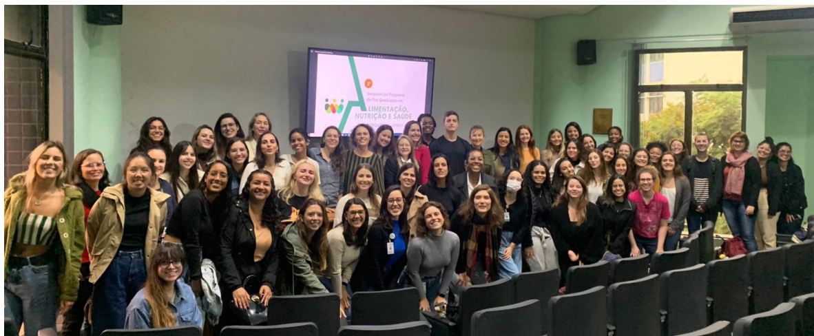
Alunos e professores do Curso de Nutrição FAMED/UFRGS