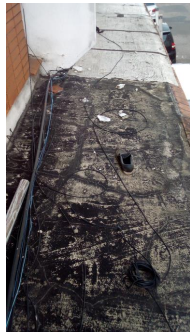
Figura 4: Vista superior da marquise com dois distintos estados de conservação