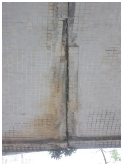
Figura 9: Remendos e manchas de umidade ao redor da junta de dilatação

Na parte inferior da marquise há a ocorrência de manchas que aparentam ser de umidade alertando para necessidade de se executar uma impermeabilização. Tais manchas ocorrem principalmente na região ao redor da junta de dilatação da marquise que, devido à idade da construção e à falta de rotina de manutenção, se apresenta deteriorada com capacidade funcional perdida. Fato este comprovado pelo manchamento por umidade e pelo indício de remendos ao redor da junta de dilatação mostrando que, provavelmente, as pastilhas já se desprenderam do revestimento anteriormente, presumidamente, devido à percolação de água (figura 9).