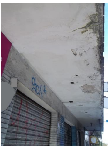
Figura 5: Fissuração, manchamento e iminente deslocamento do concreto no bordo livre

De modo geral, na parte inferior da marquise pode-se observar a existência de fissuras, manchas de umidade e mofo principalmente nas partes próximas ao bordo livre da marquise. Isto se deve ao fato de existir junto ao bordo livre em toda a extensão da marquise em sua parte superior, plaquetas cerâmicas que devido ao longo tempo de exposição foi se degradando. Esse fato propicia a percolação de água no bordo da marquise. Imagens das manchas de umidade e fissuras na parte inferior da marquise podem ser conferidas nas figuras 5 e 6.