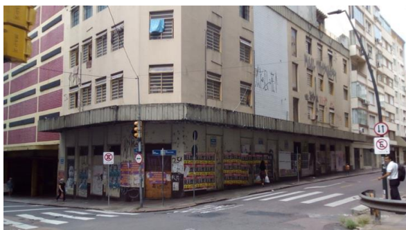
Figura 1: Fachada da edificação da marquise 1

Apesar de não ser possível visualizar a marquise em sua parte superior, pôde-se observar que a mesma foi impermeabilizada com manta asfáltica aluminizada. Porém, não se sabe quando isso aconteceu já que não foi possível obter informações com os moradores que, por receio, temem em passá-las. De forma geral a marquise encontra-se em péssimo estado de conservação. Devido à falta de manutenção e ao descaso ao longo do tempo, a impermeabilização perdeu sua função ocasionando manifestações patológicas e irregularidades na estrutura. O concreto encontra-se danificado em vários pontos, a armadura da maioria das vigas encontra-se exposta e já iniciou processo de corrosão por estar em contato direto com os agentes agressivos do meio ambiente. Há vegetações em algumas partes da platibanda e na região superior da marquise. Além disso, algumas partes das vigotas e tabelas caíram ou foram danificadas com o tempo, sendo ou não remendadas conforme o caso. Segundo relatos de moradores de prédios vizinhos tomou-se conhecimento que em dias de forte chuva acaba por gotejar em alguns pontos abaixo da marquise. Nas figuras 1 e 2 podem ser observadas imagens, respectivamente, da fachada da edificação evidenciando a marquise em estudo e de uma das vigas que a sustentam com destaque para as armaduras expostas e corroídas no engaste.