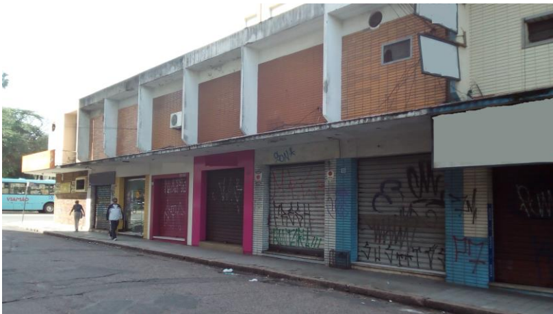
Figura 3: Fachada da edificação da marquise 2

Por serem vários estabelecimentos comerciais cada proprietário se responsabiliza pela manutenção e impermeabilização da sua faixa de marquise correspondente. Isto acaba por gerar situações de diferentes faixas de conservação da marquise. Nas figuras 3 e 4 podem ser conferidas, respectivamente, uma visão geral da fachada do imóvel e uma imagem da parte superior da marquise evidenciando duas das cinco distintas faixas de execução e conservação dos sistemas impermeabilizantes.