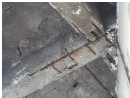
Figura 2: Armaduras expostas e corroídas em uma das vigas de sustentação da marquise 1