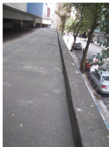
Figura 11: Marquise impermeabilizada com manta asfáltica

Para a drenagem da água pluvial há dois dutos localizados próximo ao engaste e junto aos pilares que recolhem as águas e as destinam para a rede de águas pluviais. Ambos os dutos possuem cerca de 10 cm de diâmetro e a manta asfáltica o recobre. Os encanamentos não ficam aparentes, provavelmente descendo paralelo e rente aos pilares, estando revestidos por argamassa. Tal solução é aprovada na literatura já que, segundo Jordy e Mendes (2006, p.7), “soluções com utilização de buzínates são inadequadas sob os aspectos de arquitetura, de drenagem e de manutenção e, por isso, devem ser evitadas”.