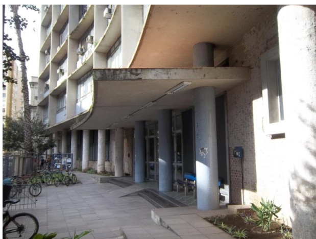
Figura 7: Marquise do prédio da Escola de Engenharia da UFRGS

Quanto ao revestimento a marquise é coberta em sua parte superior por placas cerâmicas avermelhadas retangulares e, do lado inferior, por pastilhas cerâmicas de coloração branca. Uma imagem da fachada do prédio da Escola de Engenharia com destaque para a marquise pode ser visto na figura 7, enquanto sua parte superior pode ser observada na figura 8.