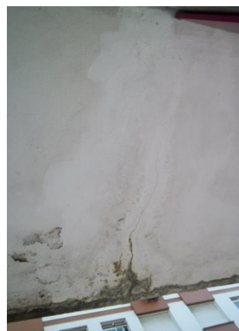
Figura 6: Fissura transversal e mancha de umidade ao redor