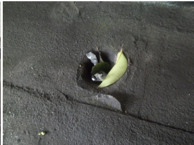
Figura 13: Depósito de sedimentos na marquise 4 coincide com o alinhamento da fachada do edifício

A partir das inspeções realizadas na marquise foi possível identificar as intervenções necessárias para uma correta manutenção da estrutura, evitando sua perda de desempenho e diminuição da vida útil. Para tanto, orientou-se quanto à limpeza da marquise para a retirada completa dos sedimentos, detritos, sementes, folhagens entre outros que possam provocar, principalmente, o entupimento dos dutos de escoamento das águas pluviais. Recomenda-se inspecionar toda a extensão do duto de escoamento das águas pluviais a fim de atestar que não haja entupimento ou obstrução de seção. Essa recomendação visa liberar o livre escoamento, evitando assim a deposição de lâmina d'água sobre a estrutura, o que gera sobrecarga.