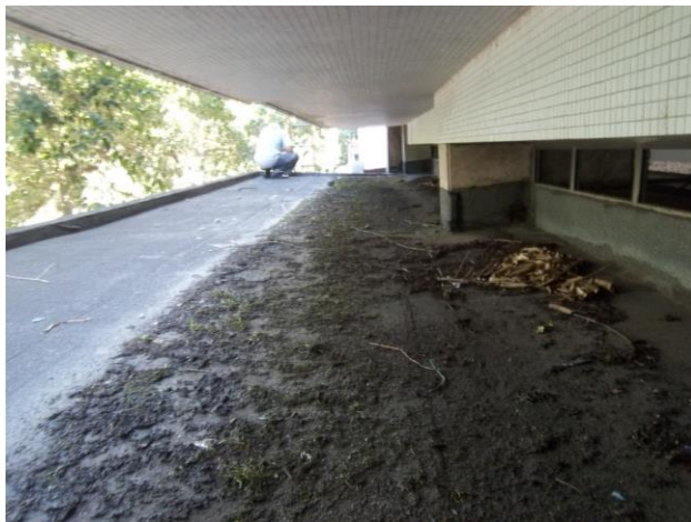
Figura 12: Deposição de detritos no duto de escoamento de água

O acúmulo de sujeira e detritos encontrados na marquise com provável entupimento dos dutos e conseqüente existência de lâmina d'água por falta de escoamento podem ser vistos nas figuras 12 e 13.