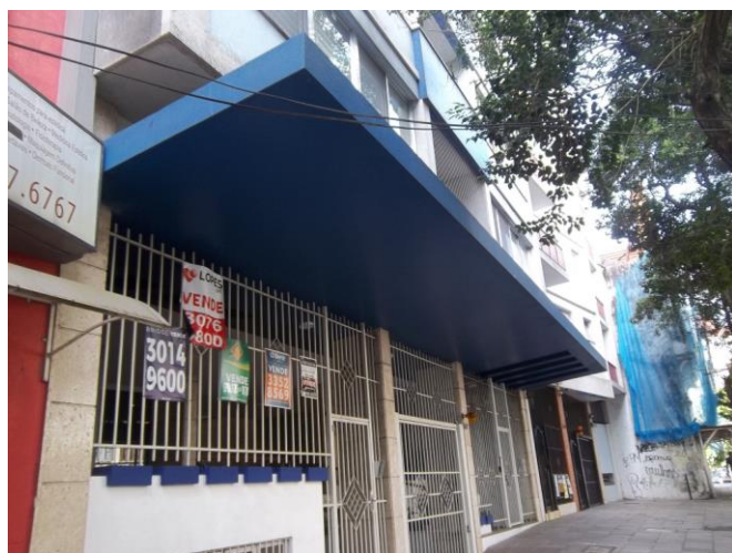
Figura 10: Fachada da edificação com evidência para a marquise nº4

Na figura 10 pode ser conferida uma imagem que evidencia a marquise na fachada da edificação enquanto a figura 11 ilustra a utilização de manta asfáltica como sistema impermeabilizante.