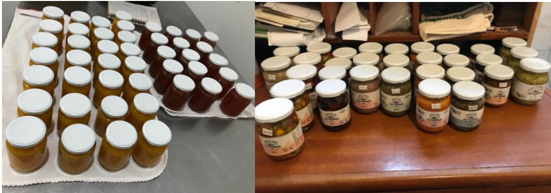
Figura 8: Pastas e geleias da agroindústria do Sítio Capororoca