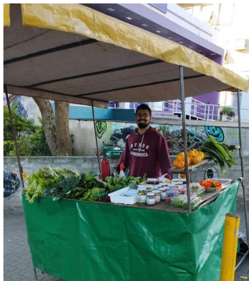
Figura 12: A banca da feira, no bairro Auxiliadora, Porto Alegre