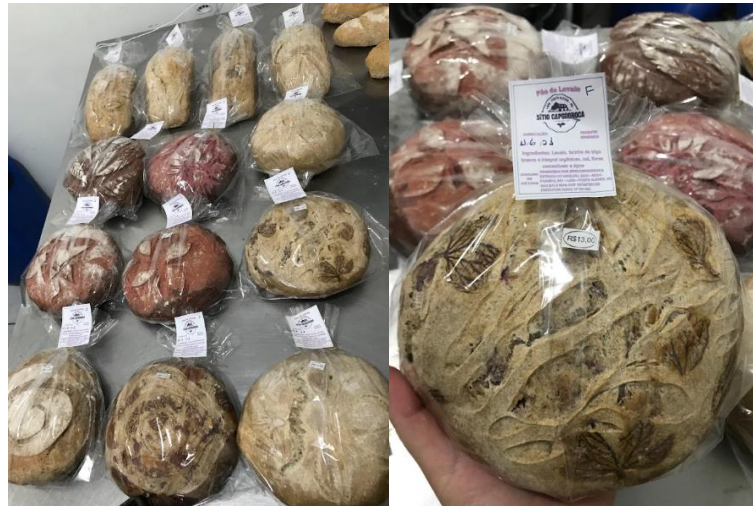
Figura 7: Pães variados de fabricados no sítio Capororoca

Na agroindústria do sítio Capororoca são produzidos pães de farinha refinada e integral, como os que foram produzidos durante o estágio, na figura 7. A fabricação dos pães inclui a utilização de PANCs cultivadas na propriedade, como a capuchinha, flor de sininho e de feijão borboleta. Os acompanhamentos de PANCs, além de valorizar e dar visibilidade a estas plantas como alimentos para ao público, têm como diferencial a cor, sabor e atratividade que elas dão aos pães.