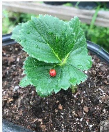
Figura 5: Presença de joaninha nos morangueiros, predadora natural de pulgões em estufa do Sítio Capororoca

Uma estratégia eficaz no manejo manual adotado foi a transladação cuidadosa de joaninhas ( Coccinella septempunctata ) para a estufa (conforme ilustrado na figura 5). Elas foram encontradas na propriedade e trasladadas com o objetivo de utilizá-las como predadoras naturais de pulgões ( Chaetosiphon fragaefolli e Aphis forbesi ). Essa ação visa promover um equilíbrio biológico no ambiente de cultivo, permitindo que as joaninhas desempenhem um papel importante no controle de pragas, contribuindo para a saúde e produtividade das plantas de morangueiro.