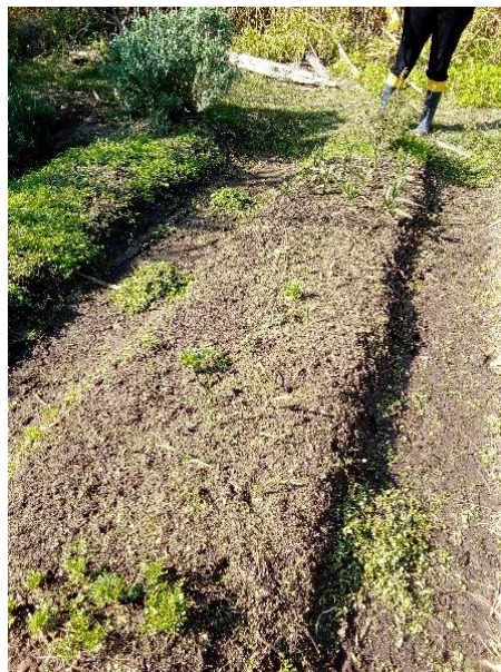
Figura 9: Canteiro recém preparado para o cultivo, Sítio Capororoca

O trabalho com as hortaliças deu-se em diferentes momentos de seu ciclo, as atividades iniciais envolveram o preparo do solo e retirada de plantas espontâneas, com a utilização de enxadas, para o erguimento do canteiro. As dimensões de largura eram de 1 m a 1,2 e o comprimento estava de acordo com a área a ser trabalhada, um exemplo de trabalho realizado na preparação do local pode ser visto na figura 9.