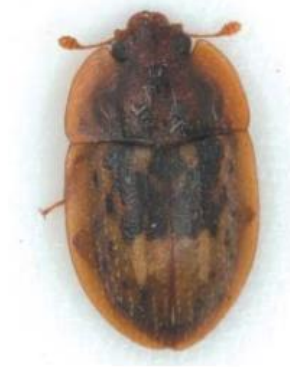
Figura 4: Broca-do-morango na fase adulta