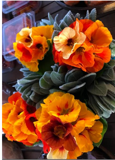
Figura 13: Capuchinha e peixinho-da-horta expostos na banca da feira do Bom Fim