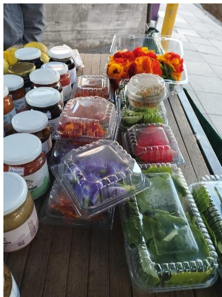
Figura 11: Produtos devidamente acomodados em embalagens, feira do bairro Auxiliadora

A colheita e a limpeza são as operações principais nos dias que antecedem as feiras, por isso, tratam-se de atividades que demandam a maior parte do tempo. Pois, a diversidade de produtos e cultivos implica em uma série de manejos específicos em pós-colheita para cada cultura. Por exemplo, para rúcula, beterraba, alho-poró, azedinha, espinafre, funcho e alface a limpeza é feita com água, para retirada de excesso de solo e de folhas senescentes que prejudicam a sanidade e imagem do produto. A colheita e processamento de outros cultivos como peixinho-da-horta, morango, flores no geral e espinafre necessitam de tratos diferentes para sua colheita, limpeza e acondicionamento (figura 11), devido à delicadeza e suas especificidades. As atividades descritas anteriormente (de colheita, lavagem e acomodação dos cultivos) também foram executadas durante o estágio.