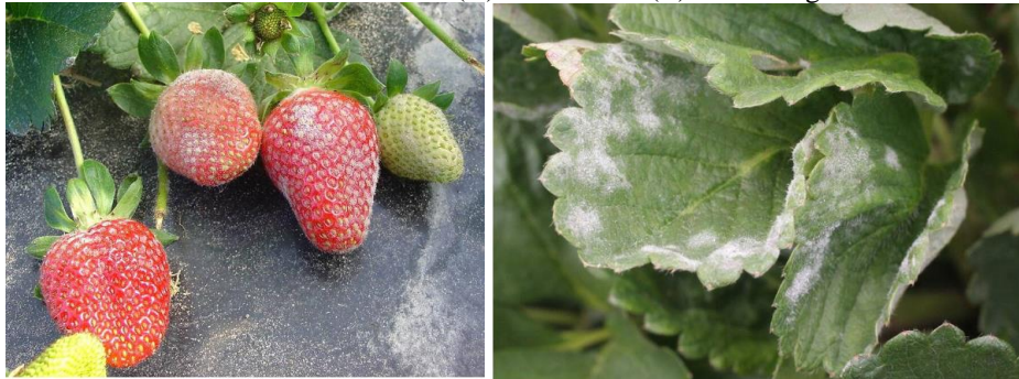
Figura 3: Sintomas visíveis de oídio no fruto (A) e nas folhas (B) de morangueiro cultivado sem solo

O controle ocorre por pulverização com o uso de três caldas, a primeira chamada de água-de-vidro, que contém água, cinza de lenha utilizada na propriedade e suco de cacto ( Opuntia ficus-indica ), que confere viscosidade. Justifica-se sua utilização pela presença visual de oídio ( Sphaerotheca macularis ) ao longo do ano. A segunda calda é produzida com bicarbonato de sódio na proporção de 100 g de bicarbonato e metade de uma folha grande de cacto para 10 litros de água, ela é usada para situações semelhantes ao da água-de-vidro. A terceira calda, é constituída de folhas de cavalinha ( Equisetum spp.), com extrato de 200 g das folhas de cavalinha para 20 litros de água, é utilizada em ocasiões de ataques fúngicos como o oídio e a micosfarela ( Mycosphaerella fragariae ) (figura 3).