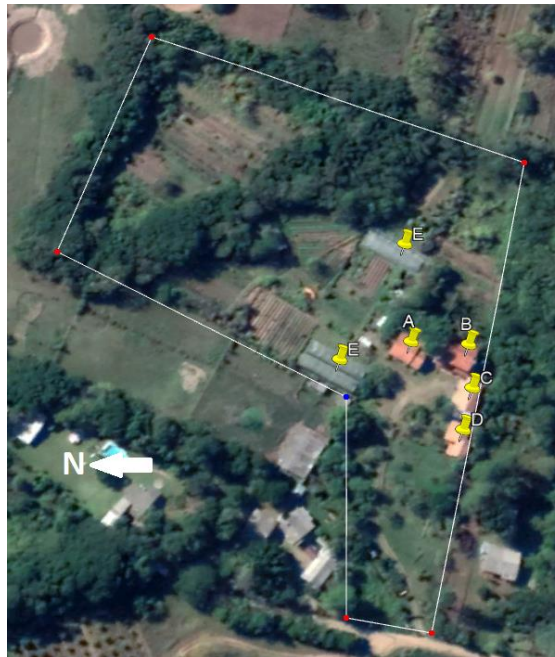
Figura 1: Vista aérea do Sítio Capororoca