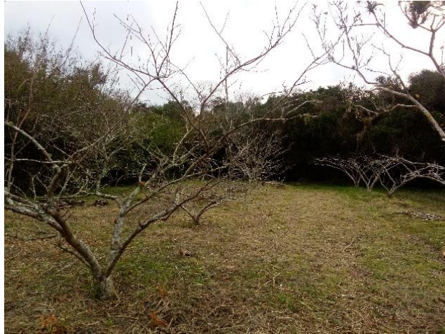
Figura 6: Ameixeiras após a poda, Sítio Capororoca

realizada de forma que disponibilizasse os frutos maiores e a manutenção do formato de vaso das plantas.