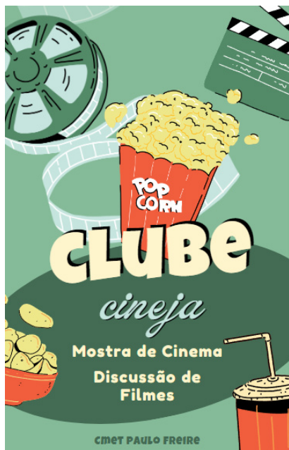
Clube CinEJA - mostra e discussão de filmes