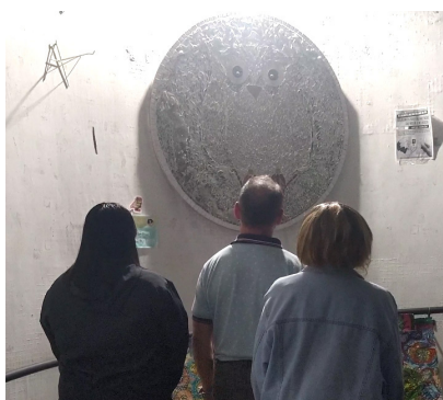
O Enigma da Coruja - frame do filme.