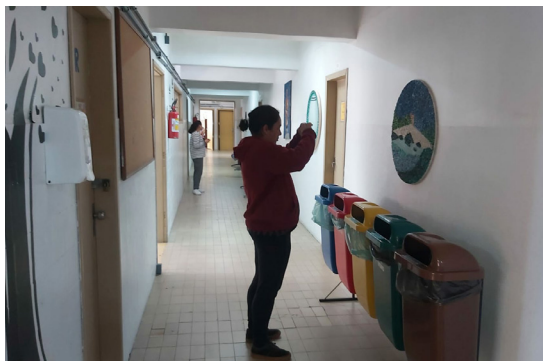
Oficina de foto