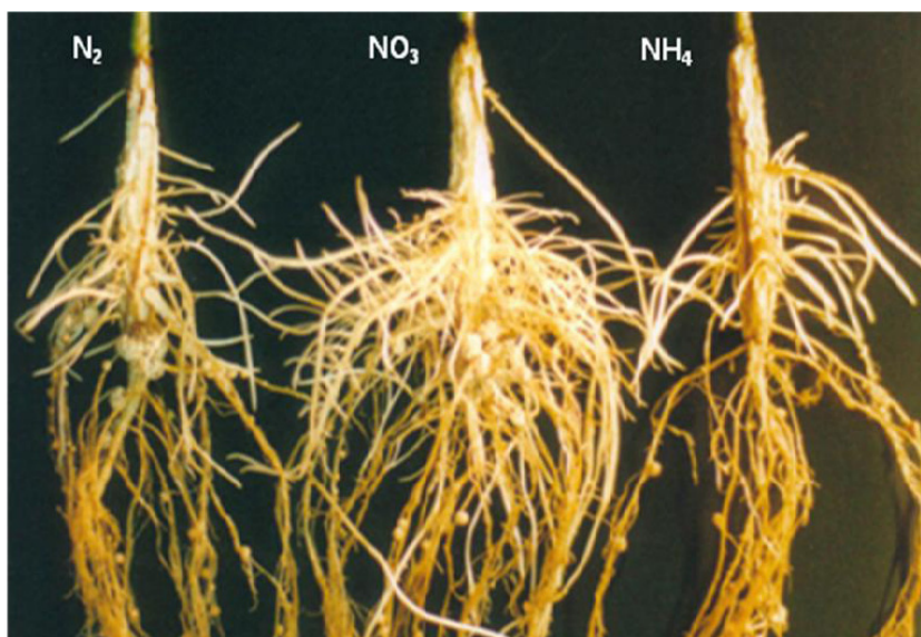
Figura 2. Sistemas radiculares de plantas de soja inoculados e inundados durante 14 dias com diferentes fontes de nitrogênio (N 2 - somente fixação simbiótica; NO 3 - adição de nitrato; NH 4 - adição de amônio).