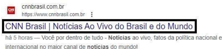
Figura 2 - Title Tag na SERP do Google

Além disso, o atributo Title auxilia uma página a aparecer nos resultados de pesquisa, guias do navegador e nas mídias sociais. É com ele que o usuário terá o primeiro contato no momento de ler os resultados na SERP e o momento em que o leitor decide clicar ou não, o que causa grande impacto nas taxas de cliques e quantidade de visitas que um site recebe. Ao digitar “últimas notícias” na página de resultados, o título é a primeira informação que aparece: