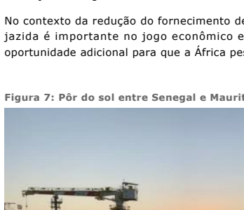
Aumentar Original (pág. 8,0k)