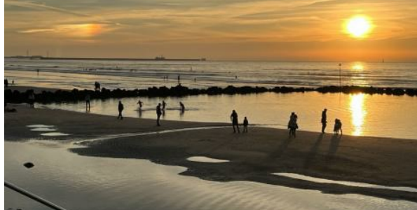
Aumentar Original (pág. 24)