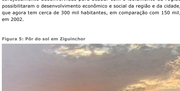
Aumentar Original (pág. 13)