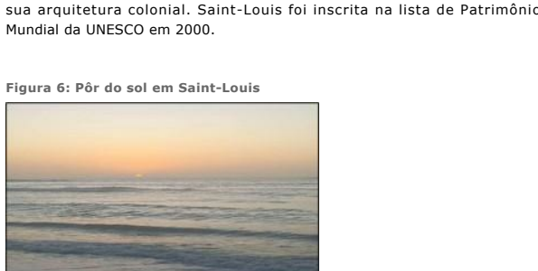
Aumentar Original (pág. 24)