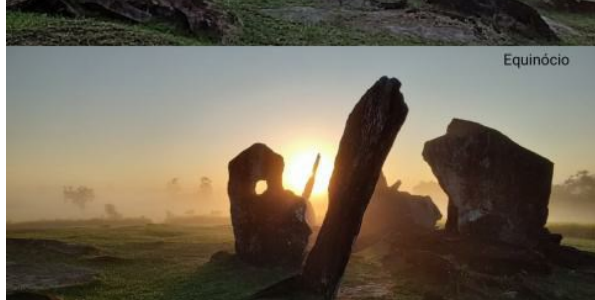
Aumentar Original (pág. 31)