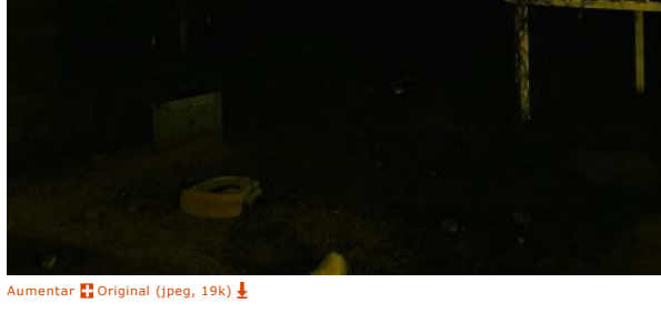
Aumentar Original (pág. 19)