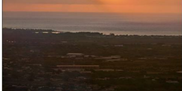
Aumentar Original (pág. 14)