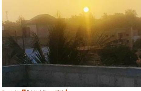
Aumentar Original (pág. 6,3k)