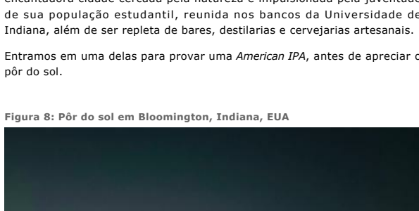
Aumentar Original (pág. 23)