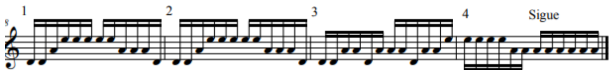
Figura 9. Cambios de Cuerda.

A continuación (ver Figura 8), se llevó a cabo un enfoque específico en áreas que requieren atención especial, centrándose en los cambios de cuerda y en un détaché controlado. Para ello, se abordó el capricho desde el compás uno hasta el 28 en cuerdas libres, prestando atención especialmente a estas dos tareas como en la Figura 9.