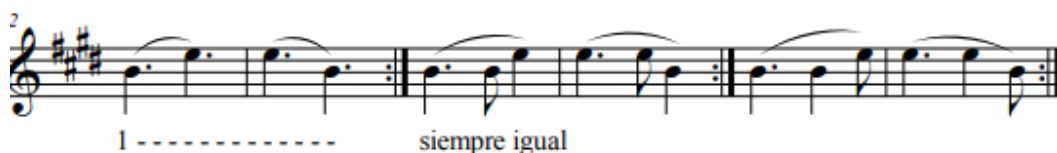
Figura 6. Identificación de pasajes técnicamente difíciles, mudanza de posición

Después de la práctica con ritmos expuestos en la Figura 6, se procede a realizar el cambio de posición manteniendo la figura de semicorchea, tal como se presenta en el capricho. Este enfoque rítmico se reveló como fundamental para consolidar la precisión y fluidez requeridas en la transición de posiciones, abordando de manera efectiva la complejidad identificada en este pasaje como en la Figura 7.