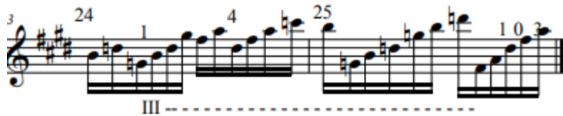
Figura 8. Mudanza de posición de los compases 24 y 25.

A continuación (ver Figura 8), se llevó a cabo un enfoque específico en áreas que requieren atención especial, centrándose en los cambios de cuerda y en un détaché controlado. Para ello, se abordó el capricho desde el compás uno hasta el 28 en cuerdas libres, prestando atención especialmente a estas dos tareas como en la Figura 9.