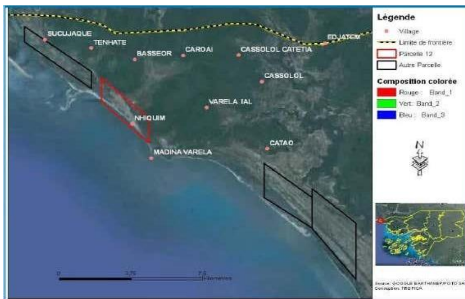
Figura 6: Localização Autorizada