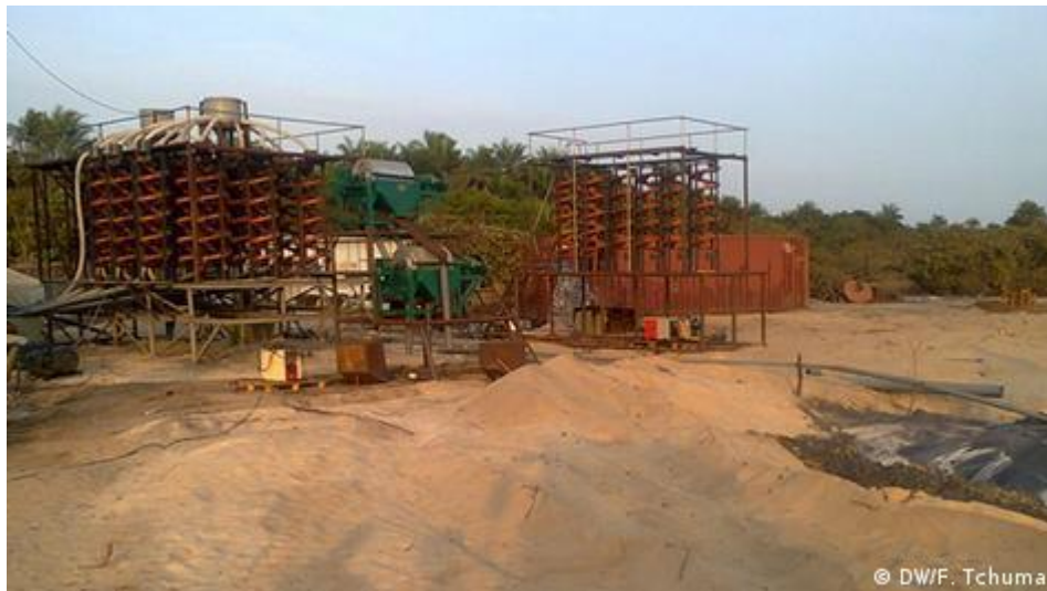
Figura 8: Equipamentos usados para exploração em Varela

possível destruição ou fragmentação de habitats naturais da fauna terrestre e marinha. De ressaltar que o processo de extração da areia será feito através de uma plataforma flutuante que filtra a areia, retendo os minerais e deixa de volta a areia no local, a uma profundidade estimada é de 3 a 5 metros (DW, 2014).