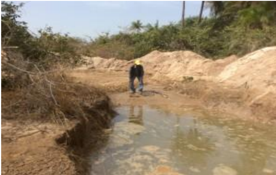
Figura 10: Foz do rio Willim

imagem abaixo demonstra a subida da água salgada, afetando as bolhanas das aldeias de Varela.