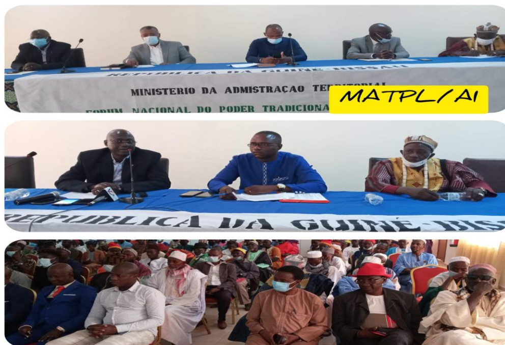
Figura 4: Fórum Nacional de Poder Tradicional