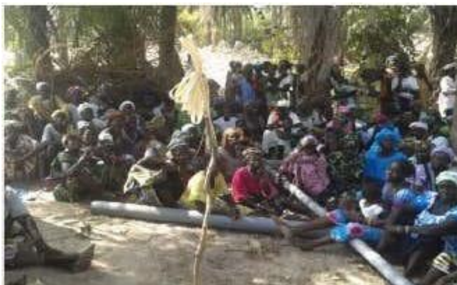
Figura 7: Protesto em Varela

As falas dos representantes comunitários em forma de protestos foram acompanhadas de protestos públicos da comunidade em geral, de modo a demonstrar a sua preocupação e insatisfação para com a exploração que decorre nesta localidade, assim como fazer chegar à entidade competente a sua posição de revolta quanto ao incumprimento das promessas feitas pelo governo, assim como pela empresa exploradora de areia pesada. O protesto contou com a reunião da comunidade em geral em um espaço público, debaixo das árvores na presença dos órgãos da comunicação social por horas de jejum, como se pode observar na imagem abaixo.