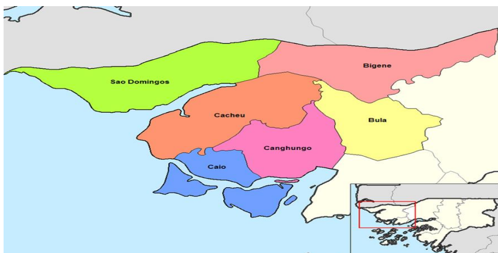
Figura 2. Mapa administrativo de Cacheu

Gouveia, com pavilhão multiuso, além de preservar alguns artefatos do tempo da escravatura.